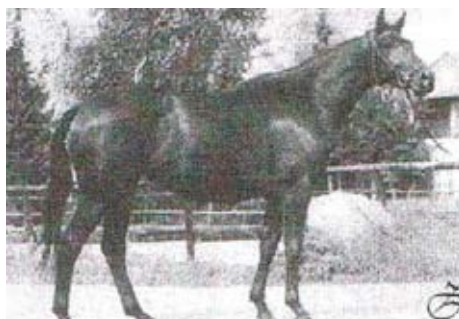
Rupie (Karneol – Rupija po Prival-11)