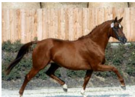
Klisna Rominten po Gelria

Začátkem roku 2015 došlo k zajímavým jednáním se zástupci německého Trakehner Verband. S nabídkou mezinárodní spolupráce se přihlásil tradičně Gestüt Schralling – Dr. H. E. Wezel a tak jsme již v březnu shlédli dvouleté hřebce připravené na výběry s úvahou jejich licentace v Čechách. Mladí hřebci jsou výborného exteriéru i pohybu a původu více než zajímavé. Otcové hřebečků jsou Singolo, Banderas a Chokkej. Velmi zajímavá je i kolekce klisniček r. 2014, kde nejvíce zaujala dcera hřebce Balisto Z (Zangersheide) z matky po Ignam, dále dcera hřebce Waitaki – Cheops a Schenkendorf – Lichtblick.