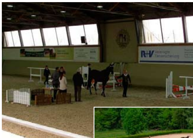
Hodnocení mladých klisen v Moritzburgu, květen 2015