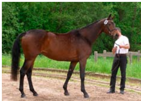
Moritzburg, čtyřletá Heidi (Perechlest - Hester po Zwickau xx - Karwendelstein)

rier, pohyb a výkonnost Českých trakénů.