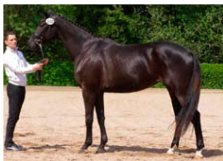
Moritzburg, tříletá Grande Lady (Hirtentanz - Grande Nation po Uckermarker - Upan la Jathe AA)

Český trakénský svaz získává nové členy z řad zahraničních chovatelů a v jednání je použití našich hřebců ve světovém chovu (Aktiv, Topas, Prökelwitz, Quintar). V Gestüt Schralling se již narodilo první hříbě do českých plemenných knih (hřebček po Aktiv ze Schlodien po Königspark xx). Do Čech byly importovány 2 výborné klisny, Sanditten (Lowelas – Peron) a Feuerrose po Lichtblick – Grossist.