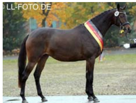
Nejlepší mladá klisna Heavenly Brown (Millennium – Le Rouge)