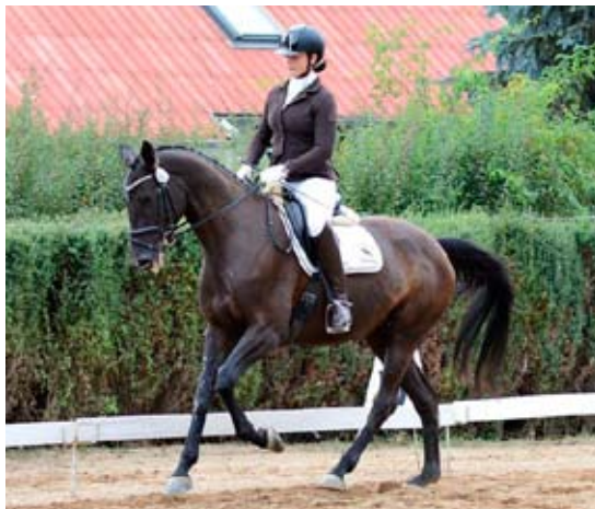
Čtyřletá Ask Me Please (Plesant – Victoria po Vals)

pijského drezuristy Biotopa. Otec báby Vychoděc 43 dal GP skokany Voroča, Chavtajma a další plemeníky jako Obvod, Plověc či Prizyv. Plesant přenáší vlohy pro drezuru i skákání.