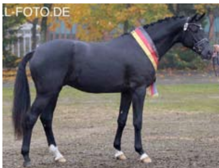
Vítěz výběru Perpignan Noir (Schwarzgold – Parade Go po Maizauber)