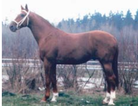
Quoniam III (Q II – 642 Venezuela po Singapur xx)

Posledně jmenovaný se v roce 2002 stal nejlepším českým koněm v GP CSIO Poděbrady. Jeho syn QUINTAR (Stella) zvítězil ve finále MŠMK pro 4leté i 5leté a byl nejlepším pětiletým koněm na Trakehner Bundesturnier v Hannoveru 2014.