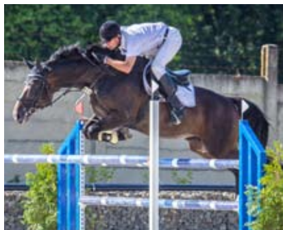
Quintar