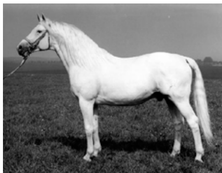
Faharadscha (Maharadscha - Fabiola po Reichsfurst)

The trakehner race is highly exclusive. It has been a closed population from the start. The origin lies with a small native horse called Schwaike. Trakehner horses were spread around the local residents of East Prussia, so many civil and military horses became available for breeding. Back to the past, in 1732 King Friedrich Wilhelm I laid the foundation for the present breed, building big state studs in East Prussia. Horses were elegant, temperament, with athletic ability... The main stud was situated in Trakehnen, but also in Georgenburg, Rastenburg, Braunsberg and Marienwerder. In 1787 count Lindenau performed a drastic selection. Only the best Trakehner individuals were given the opportunity to multiply their genes. Using English and Arabian thoroughbred, „new“ blood was added to the Trakehner race. And so Perfectionist xx produced famous Tempelhüter and Jagdheld and origin of legendary linie Dingo - Dampfross is thoroughbred stallion Bachus. From this linie was the most important sire in Czech republic