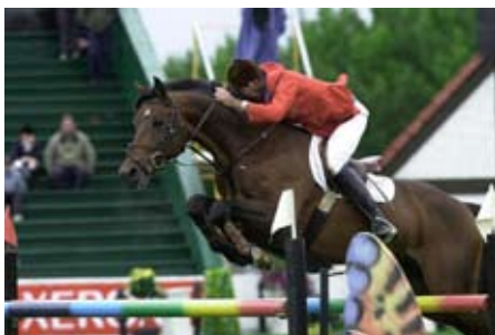
Horalas (Veimaras – Hipogeja po Gret), trojnásobný skokový šampion USA