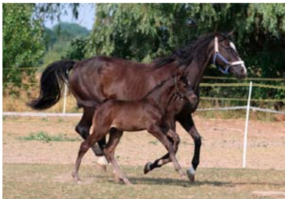
Aktis s matkou Kachetia