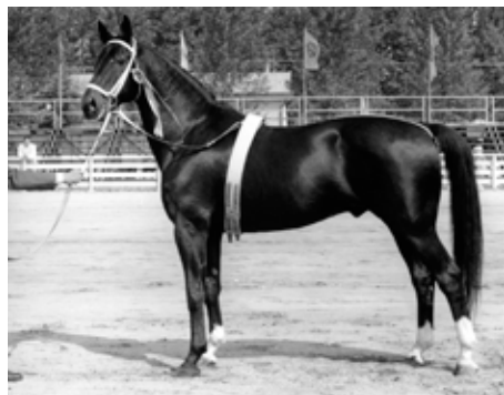
Quoniam II (Quoniam – 331 Portius – Gotika)

ho Amona), druhá část větve přes DONAUWINDA dala olympického medailistu ABDULLAHA.