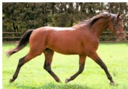
Dvouletý hřebec Schralling (Banderas – Sechserben po Connery)

Im Austausch für Topas kam der langjährige Albertovecer Hauptbeschäler Karneol