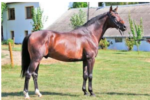
Quintar