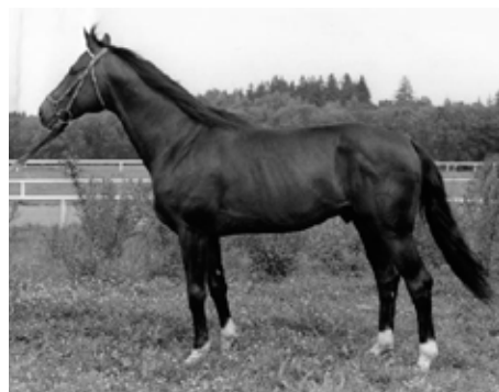
Topas (Schwalbenzug – Torosa po Ostwind)

- Quoniam II and his excellent son Quoniam III, which won 14 championships as breeding stallion (showjumping).