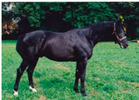
Topas – 14 (Topas – 650 Dostupnaja po Pamir- 15), foto archiv SCHČTr