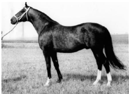
Quoniam (Quido – Oněga)

Nejvýznamnější byla pro nás linie Dingo proslavená plemeníkem v královských trakénách DAMPFROSSEM. Narodil se v r. 1916 a v Královském hřebčíně (založen 1732 pruským králem Fridrichem Vilemem I. v oblasti dnešního Kaliningradu) působil v letech 1923 - 1933. Jeho syn HYPERION je dědem ABGLANZE (předek slavného Argentinuse a u nás známé-