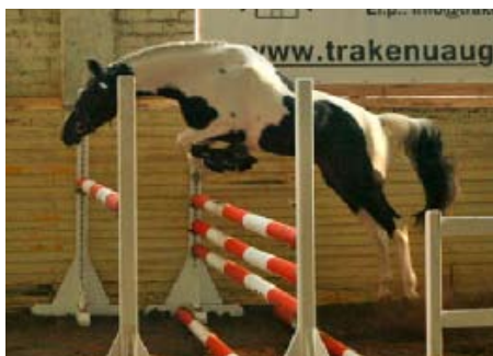
Sheridan (Gluosnis xx)

Dlouhým přejezdem přes Bavorsko pak naše návštěva končila v překrásném historickém Gestüt Graditz nedaleko Berlína.