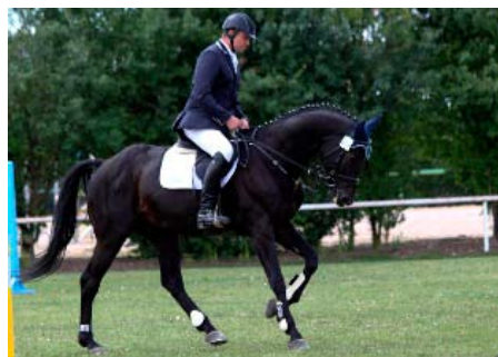
Hřebec Arizonas (Almox Prints)