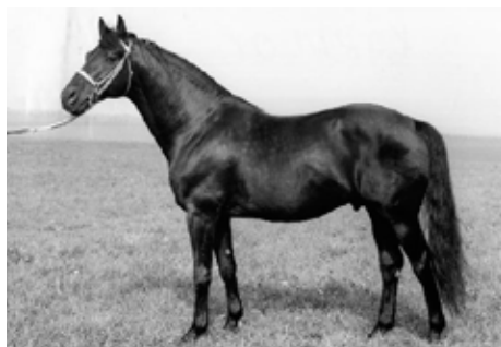
Karneol (Impuls – Cassandra po Sporn)