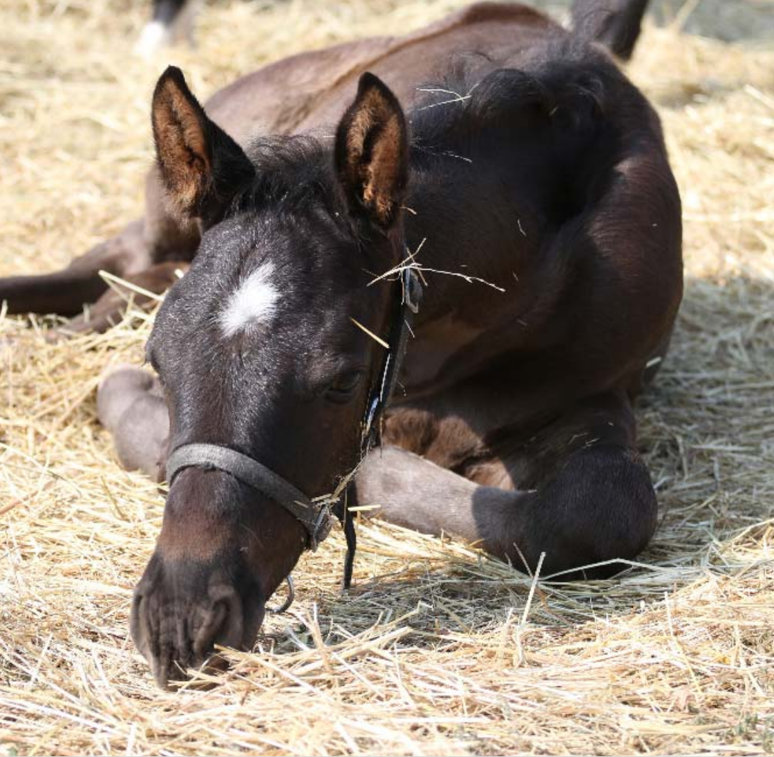
Hřebeček AKTIS (Aktiv – Kachetia po Chalif 5), nar. 2015