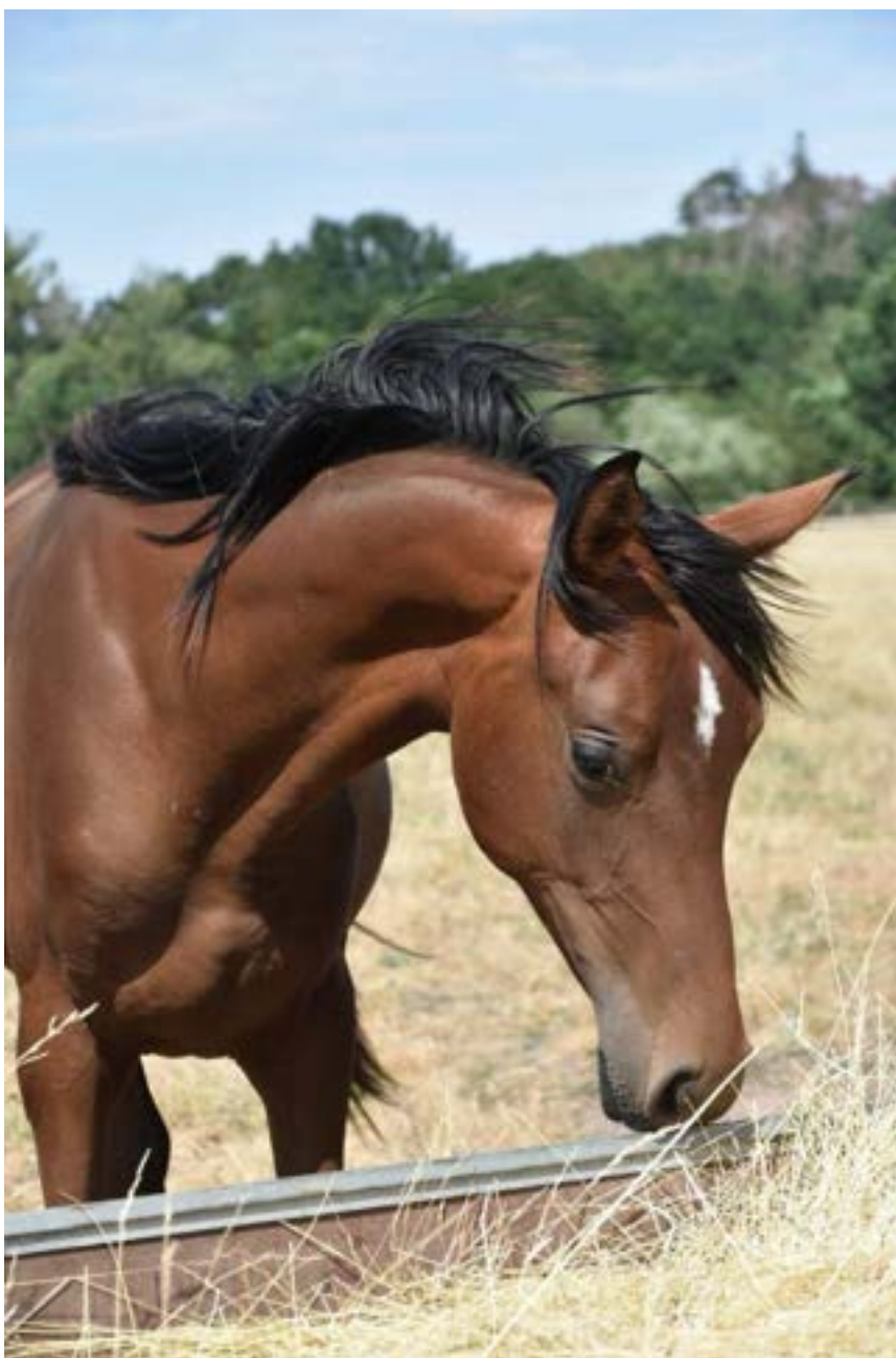
Dahoman I MT – 5 / Ithildin

Výsledný počet bodů 8,99 jej zařadil do třídy E.