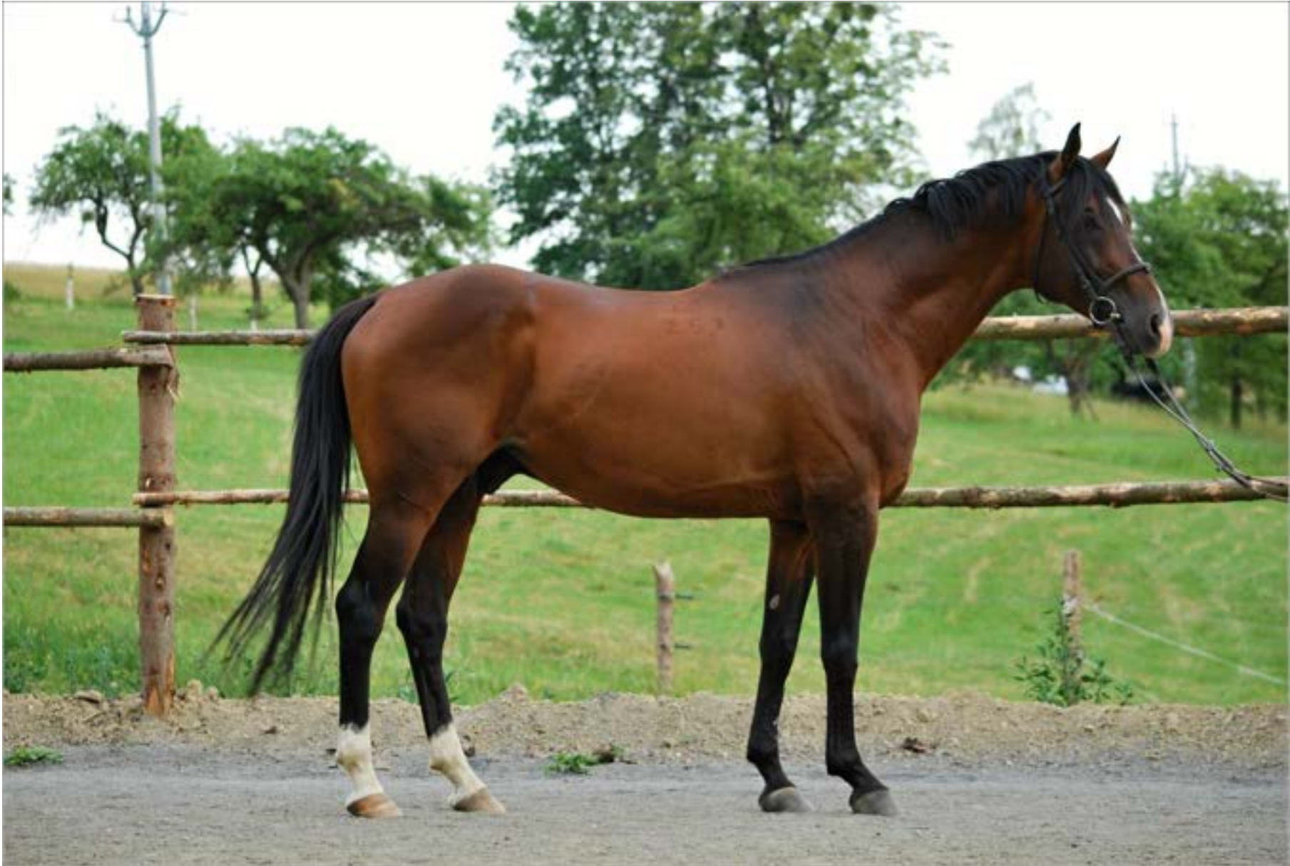
Gidran IV MT / 1899 Garnet (68/257)