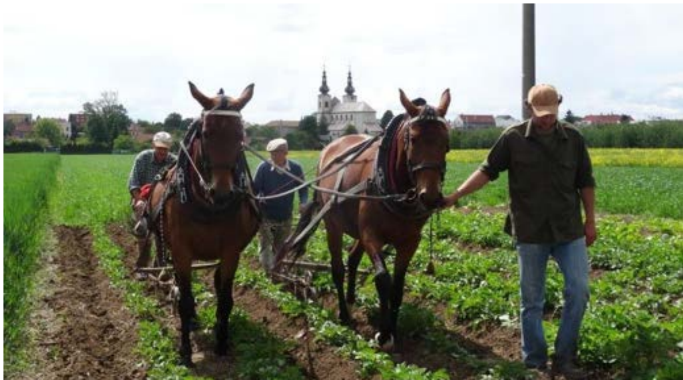
Polní práce 81/4 Frída II a Furioso VIII MT-6/Forta (podsední)