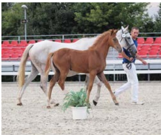
klisnička Gidran IV MT-3/Stella