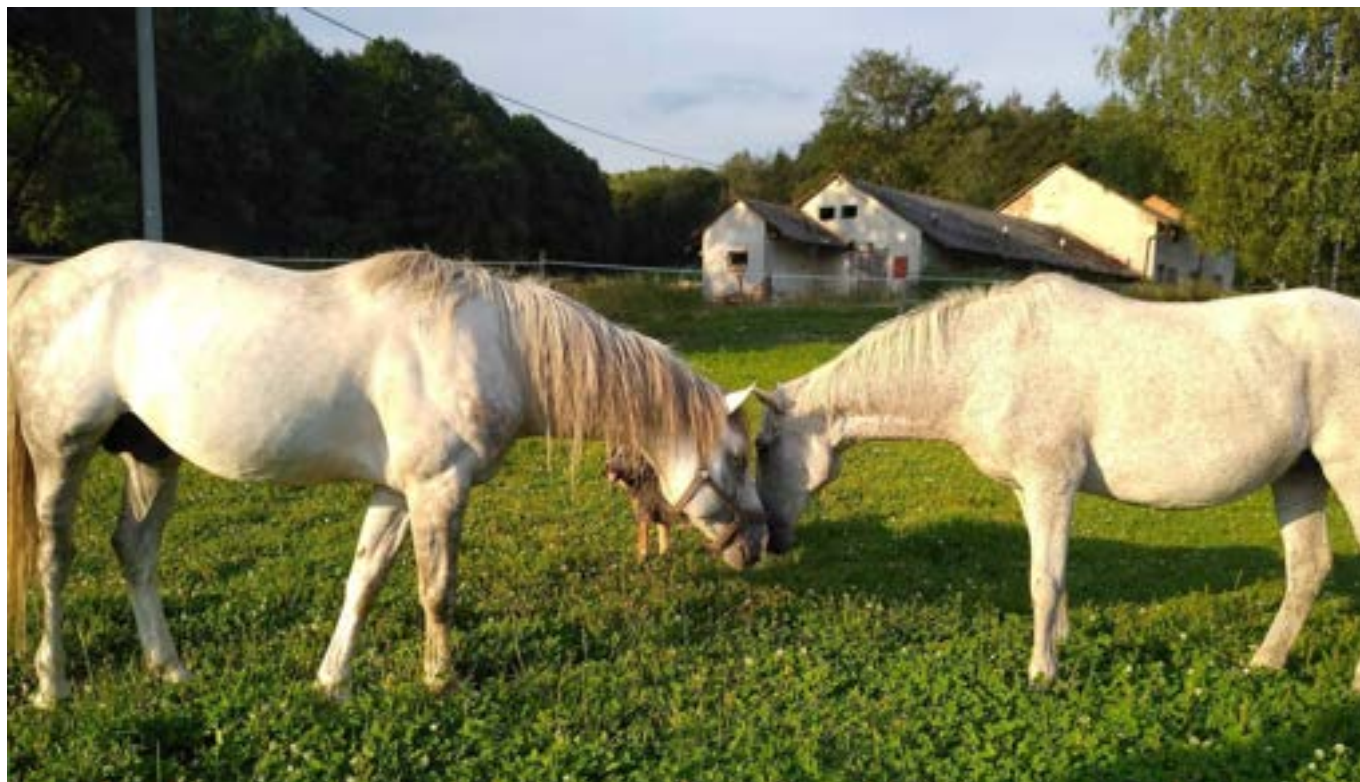
Dva zamilovaní - Gidran VIII MT/Grigorij 52/824 Shantalka (arabský kůň)

Nelze než tiše obdivovat krásy Adršpachu