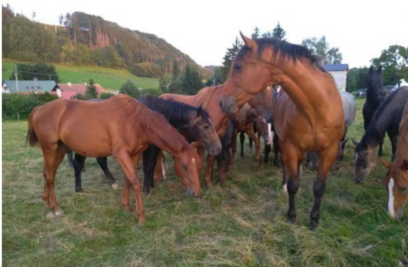
Mladí hřebečci a jejich dvacetiletý hlídač a ochránce 53/730 Wikomt