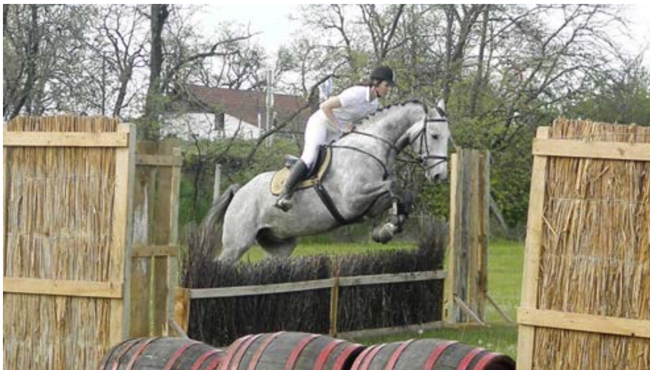
Výstava Maďarsko – Pares ve skokové ukázce

Jedná se o kostnatého hřebce, delšího rámce s hrubší hlavou, delším krkem, dobrou horní linií, korektním fundamentem přitom však dostatečně ušlechtilého. Vyniká prostorným krokem i klusem a kulatým cvalem. Od hříbete se prezentuje přátelskou povahou a velmi dobrým charakterem. Byl finalistou KMK ve všestrannosti, kde dosáhl výkonnosti „L“ a v drezuře „Z“. Krátce byl testován i v zápřeži kde dosáhl výkonnosti „S“. Zúčastnil se na výstavách nejen v České republice ale i v Maďarsku a na Slovensku s velmi dobrým hodnocením, 4x získal titul Šampion výstavy.