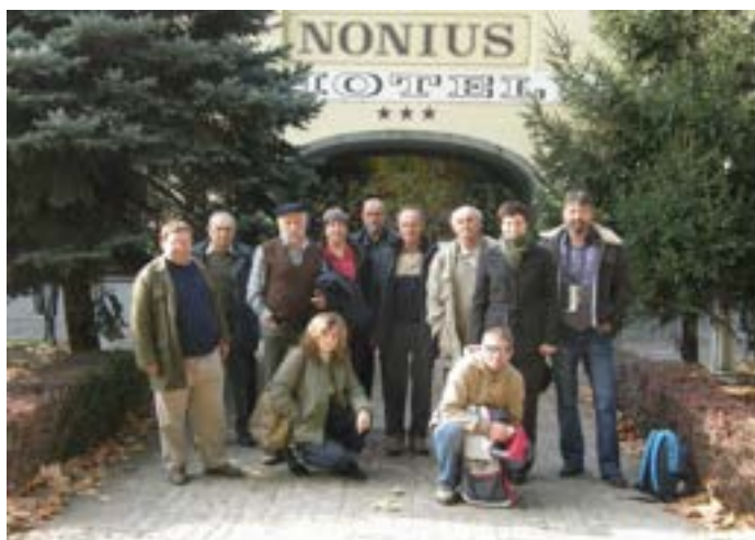
Návštěva hřebčína Albertovec a návštěva historického hřebčína v Mezohegyesi