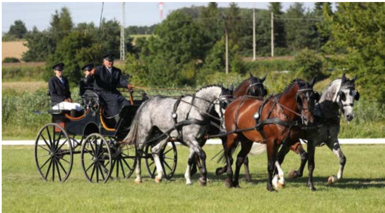
FURIOSO XV MT/FXXX-16/SK/Čardáš G (náruční vpředu)

FURIOSO XIV MT/2155 Furioso I MT-3/Richard G