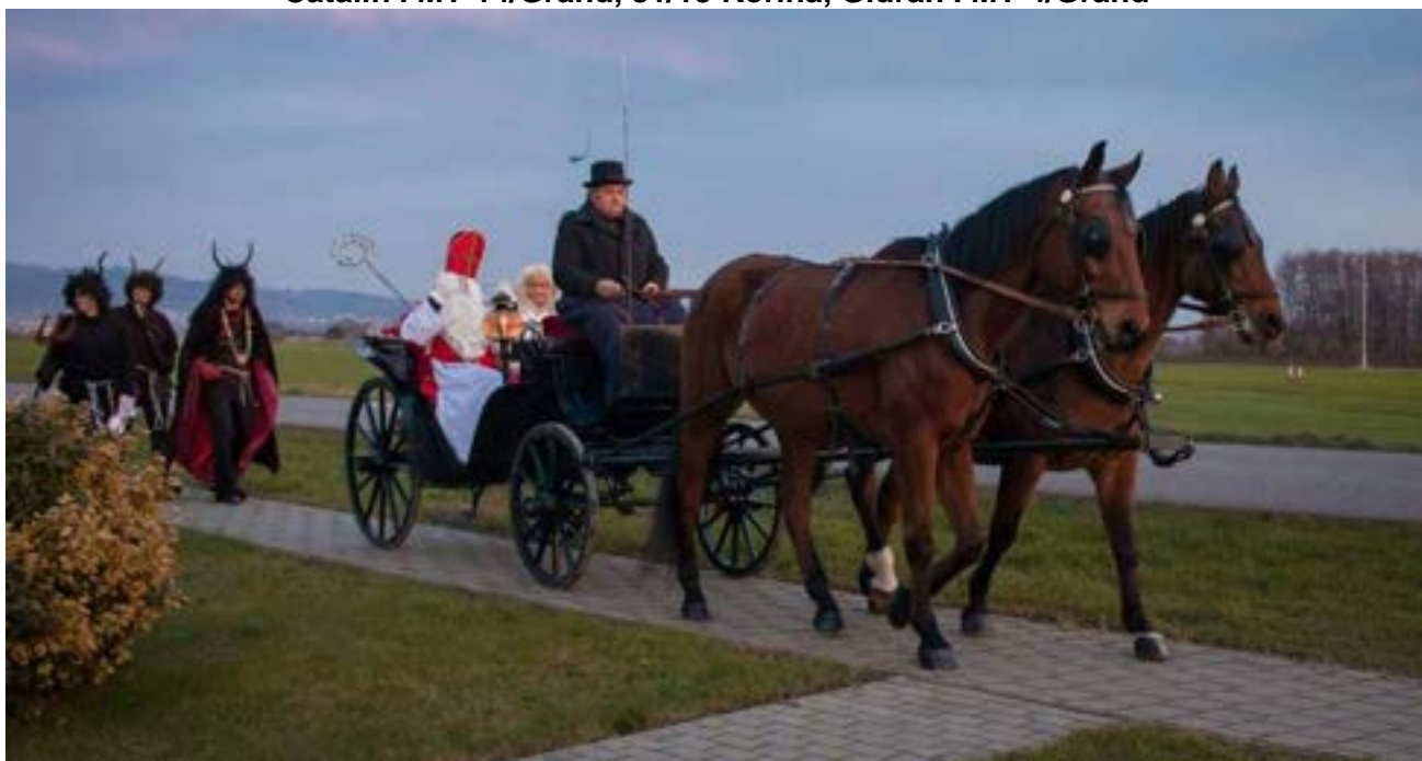
81/15 Korina (podsední), Gidran I MT-4/Grand – Mikuláš Třebětice