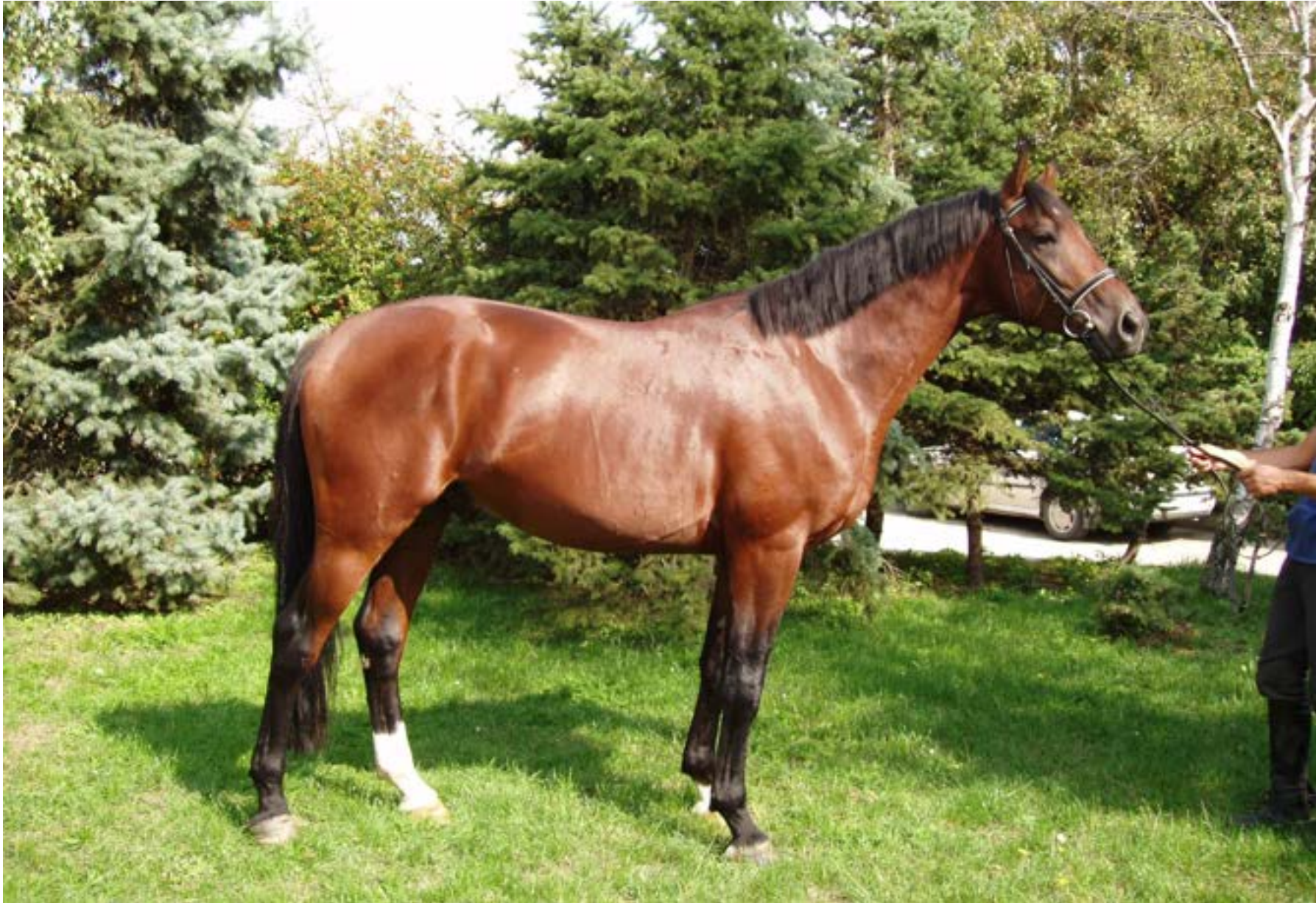
North Star I MT / NS XIII SK / 1542 NS X - 7 /Jenisej