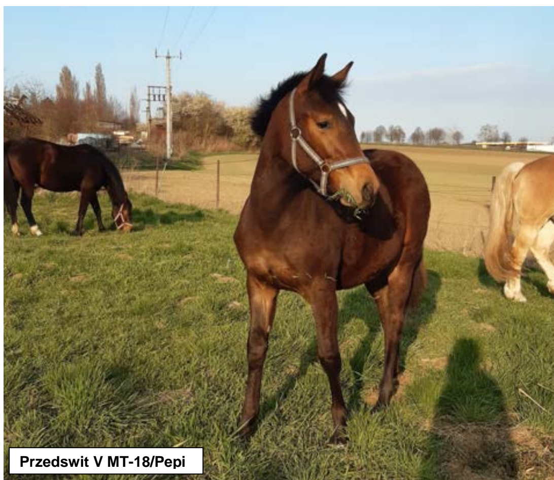
Przedswit V MT-18/Pepi