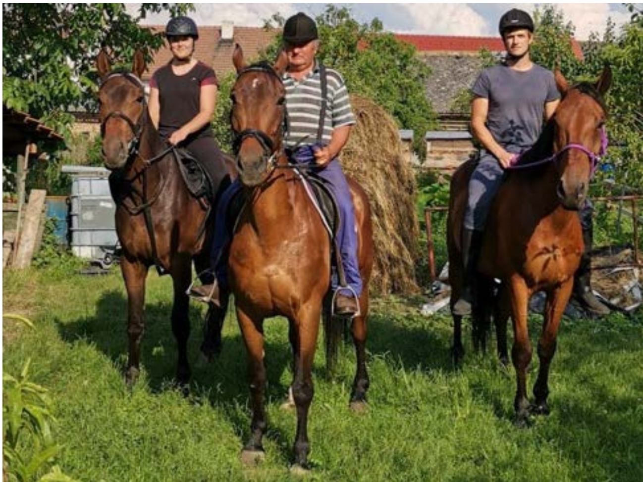
Catalin I MT-14/Grand, 81/15 Korina, Gidran I MT-4/Grand

Moravský teplokrevník, mnohostranný rodinný kůň pro všechny generace. Toto motto je v rodině Konečných naplněno beze zbytku.