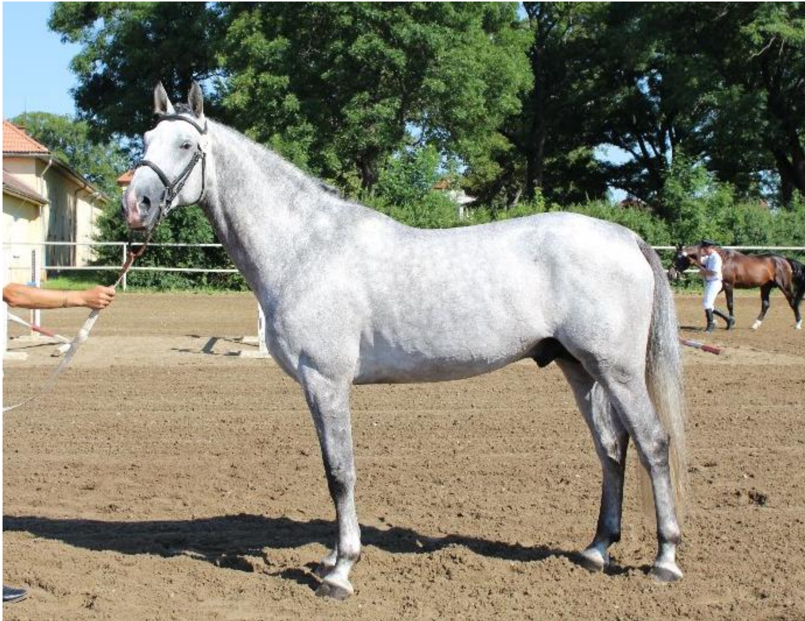
Przedswit XVIII MT/ 2089 Przedswit II MT – 1 / Pares