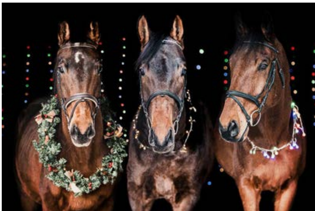
81/15 Korina, Catalin I MT-14/Catalin L, Gidran I MT-4/Grand