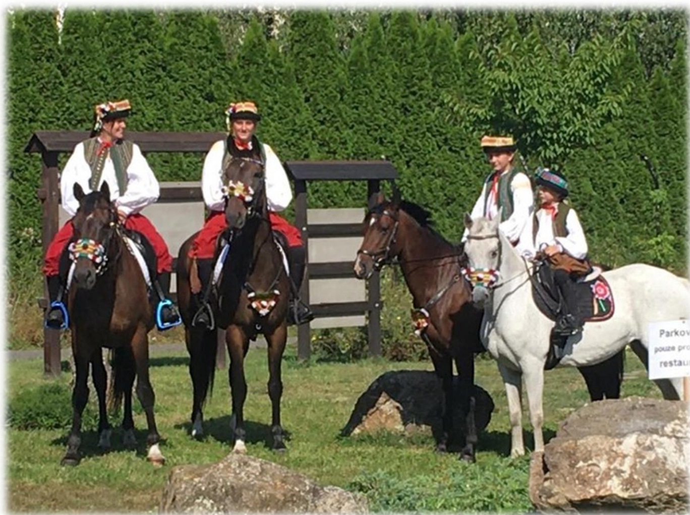
z leva: Regulus MT-1/Renesmé a Furioso VIII MT-2/Fanhally

V neděli dopoledne desítky krojovaných Hanáků na Masarykově náměstí v Kojetíně zahájilo oblíbenou lidovou písničkou velkolepý průvod s Ječmínkovou jízdou králů. Velmi oblíbenou tradici nepřerušil ani koronavirus, a tisíce lidí si ji nenechalo ujít.