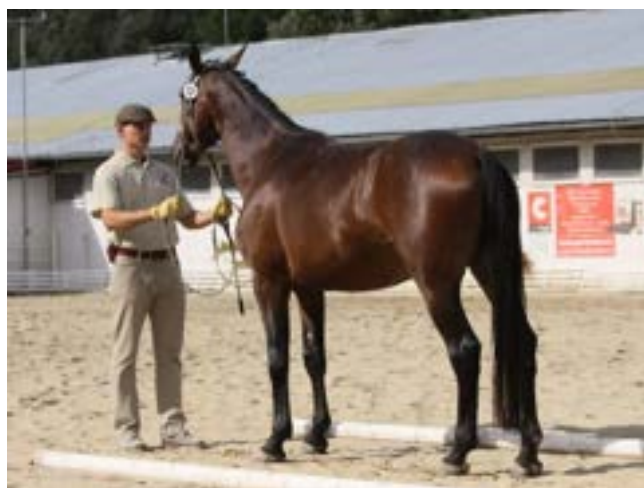
81/144 North Star I MT-2/Nina G