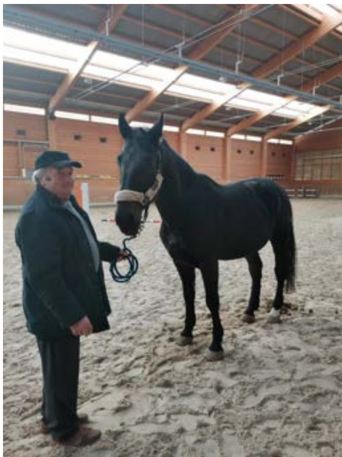
setkání po letech – 81/40 Cavalo