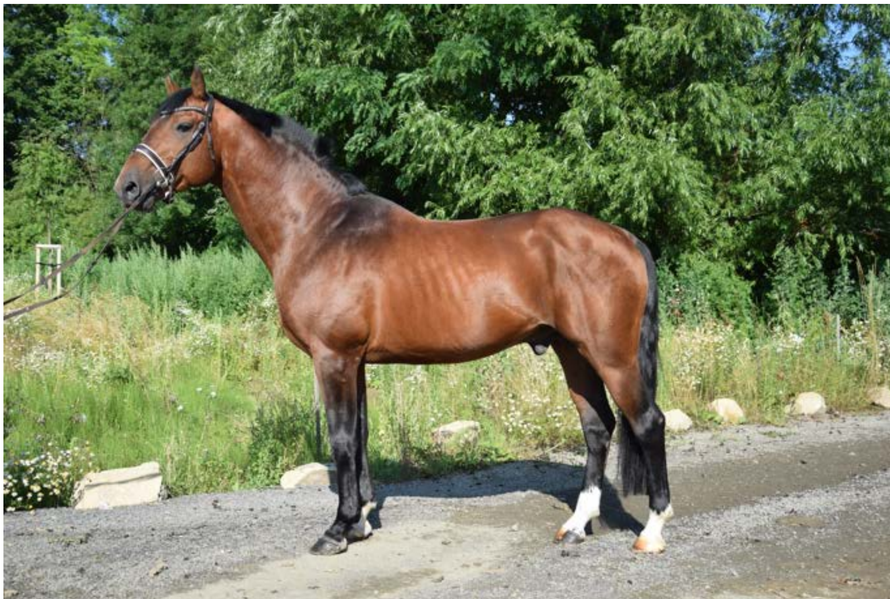
Przedswit XXI MT/2596 Hetik 53/392