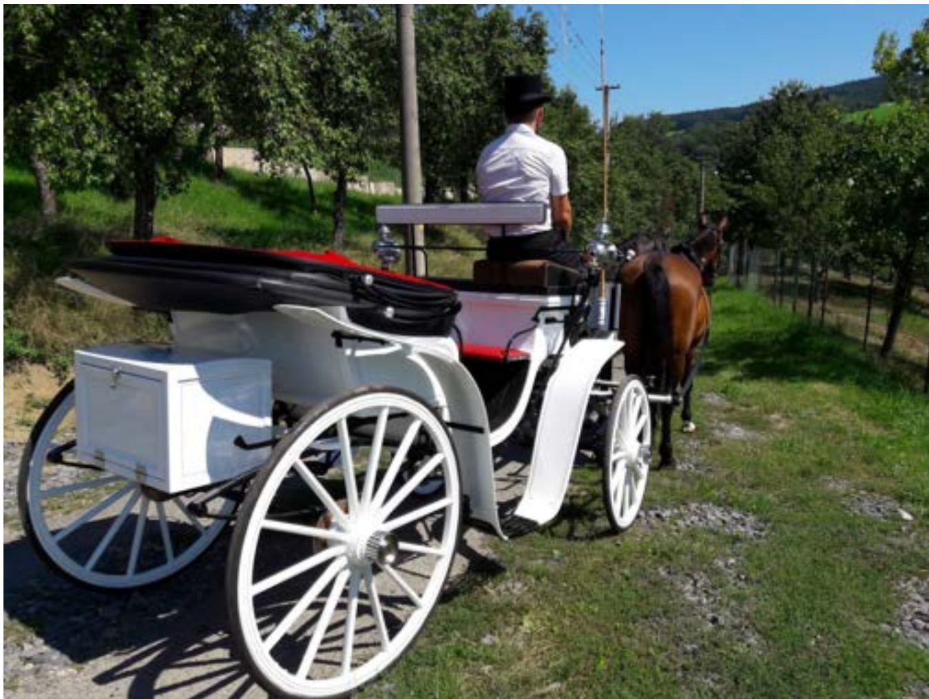
Kočár pro nevěstu