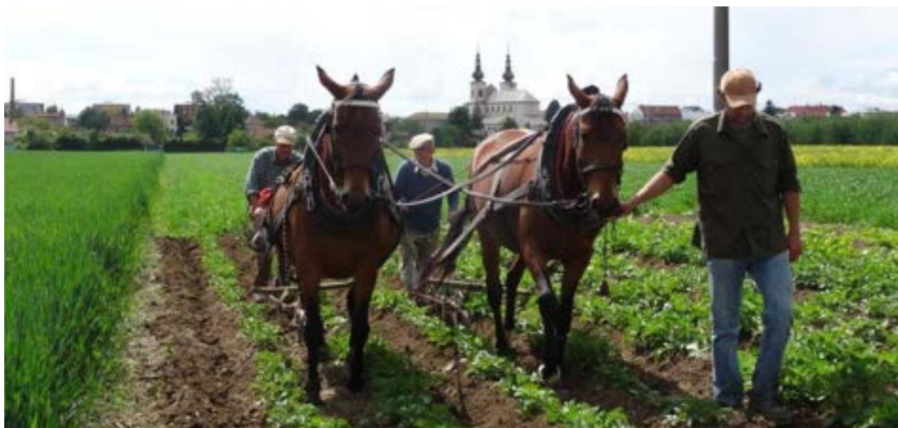
81/4 Frida II (náruční), Furioso VIII MT – 6/Forta (sedlová)