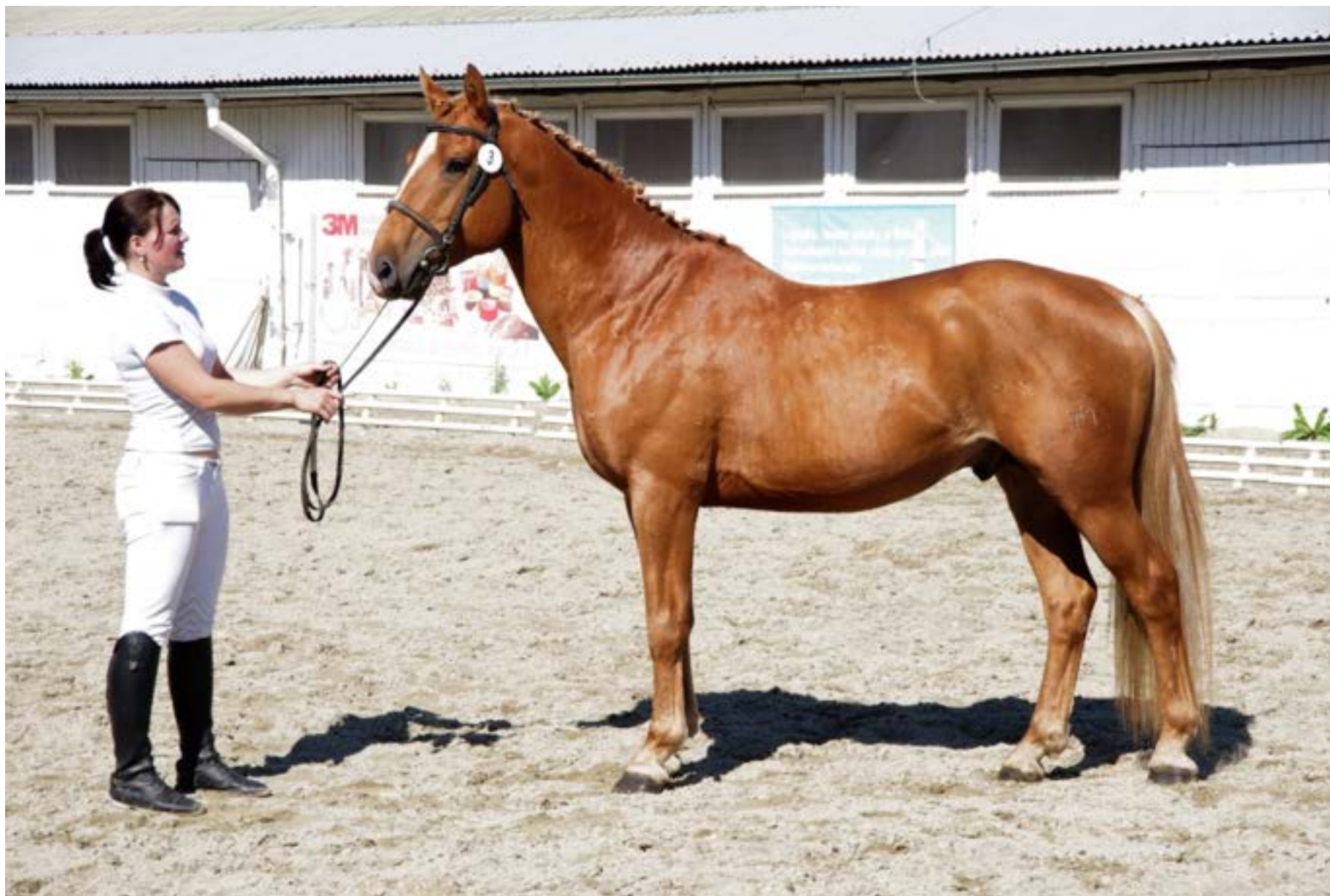
Przedswit XIV MT/2157 Jasta 81/42