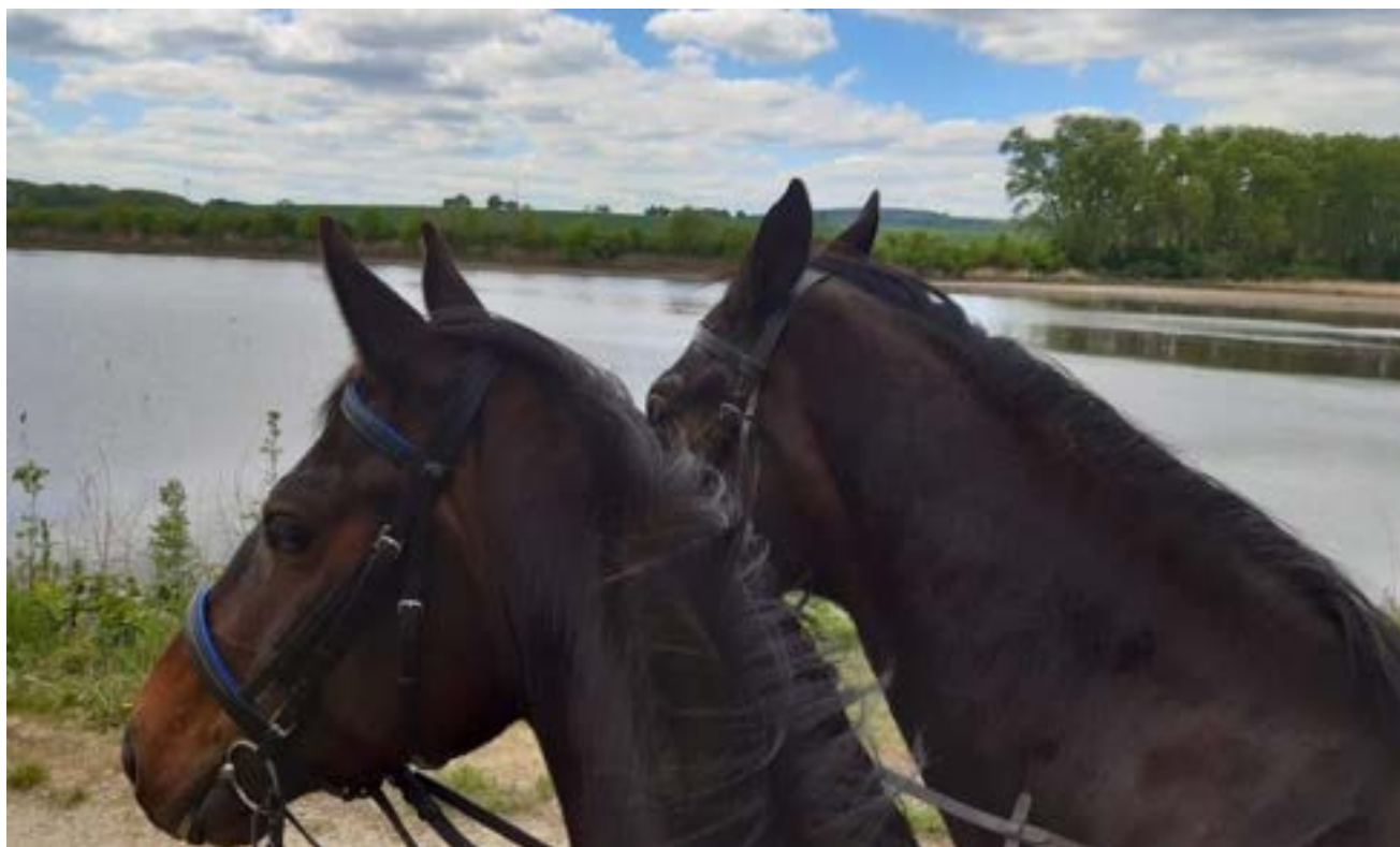
Na vyjíždce u rybníka