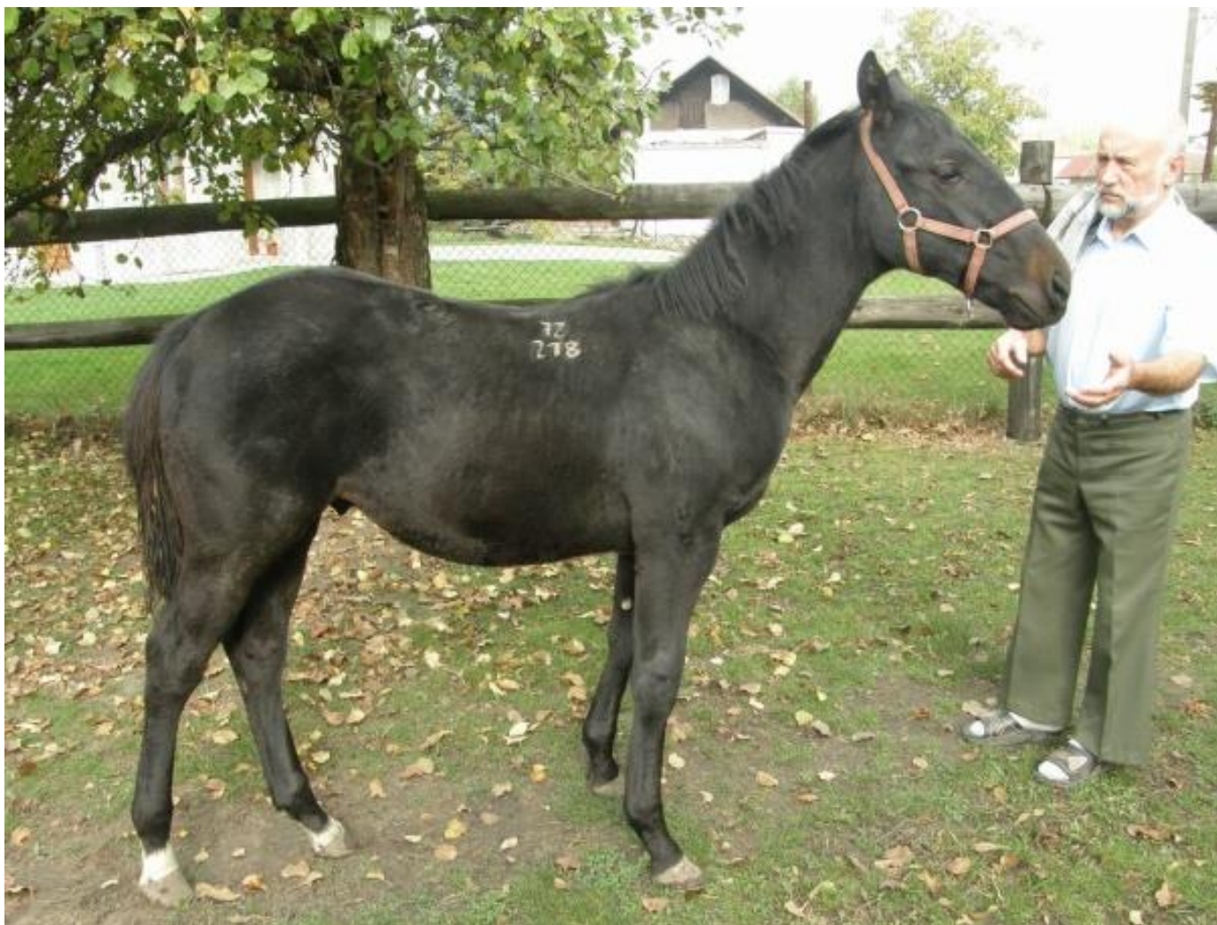
s hřebečkem 72/218 Tir, po Tiznit

Tak jako koně, měl však rád i drobná hospodářská zvířata a v posledních letech se začal znovu věnovat chovu holubů a drůbeže. Byl to nesmírně aktivní, vitální a pracovitý člověk. Neustále něco plánoval, vymýšlel a organizoval. Ani přibývajících roky neutlumily jeho chuť do života, jeho aktivitu, odpočinek mu byl vzdálený.