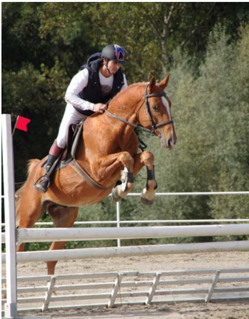
Przedswit XIV MT/Jasta –zkoušky výkonnosti pod testačním jezdcem

Hřebec Przedswit XIV MT/Jasta je souladný ryzák se světlejší hřívou, kulatých tvarů s poněkud hrubší hlavou, dostatečně široký i hluboký, přiměřeného fundamentu v typu spíše mnohostranně užitkovém, přesto však se skokovými vlohami, pracovitý a charakterní. Výkonnostní zkoušky úspěšně složil v roce 2013 s hodnocením za exteriér 7,9 a za ZV 8,2 bodu.