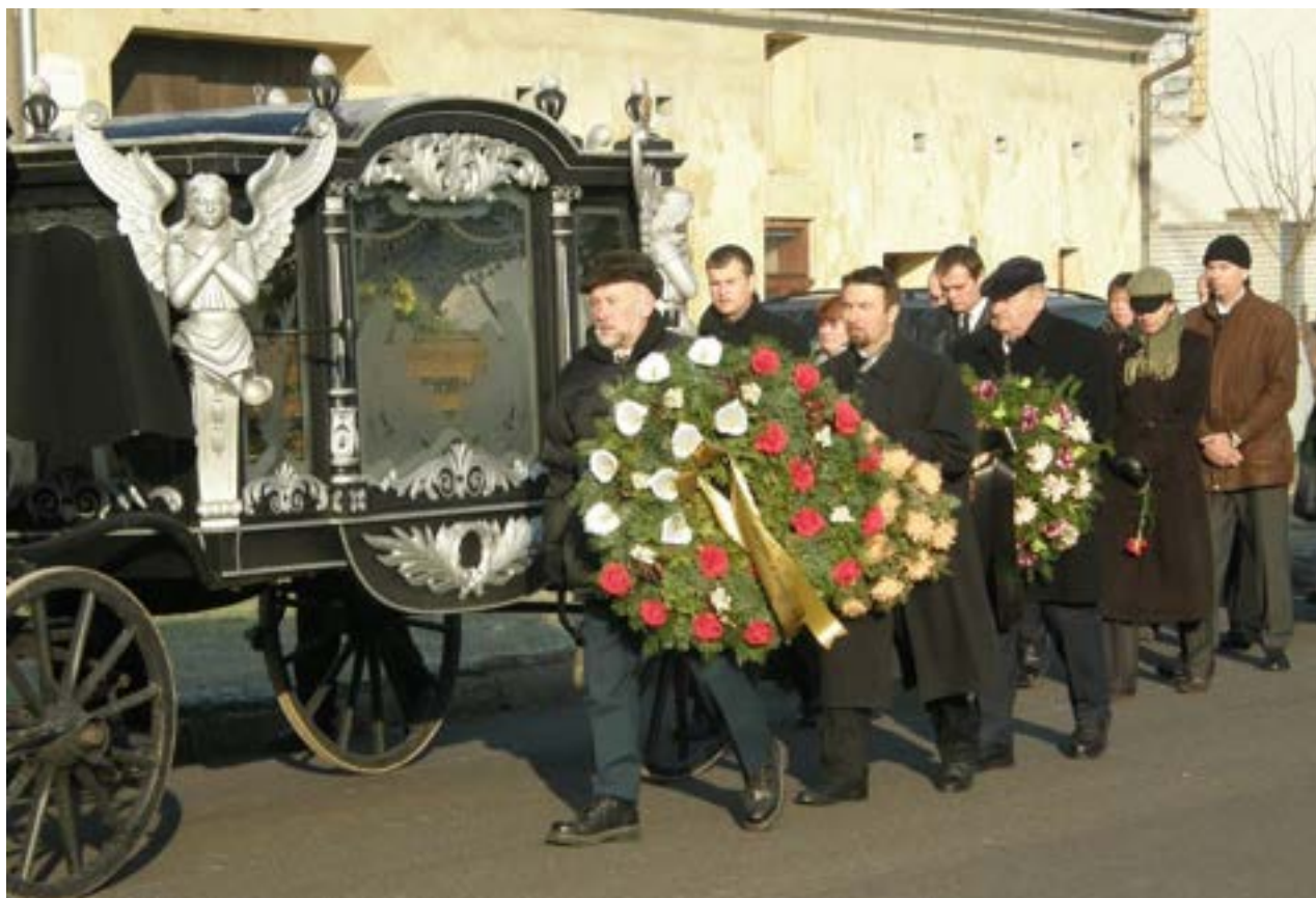
Pohřeb pana Němečka