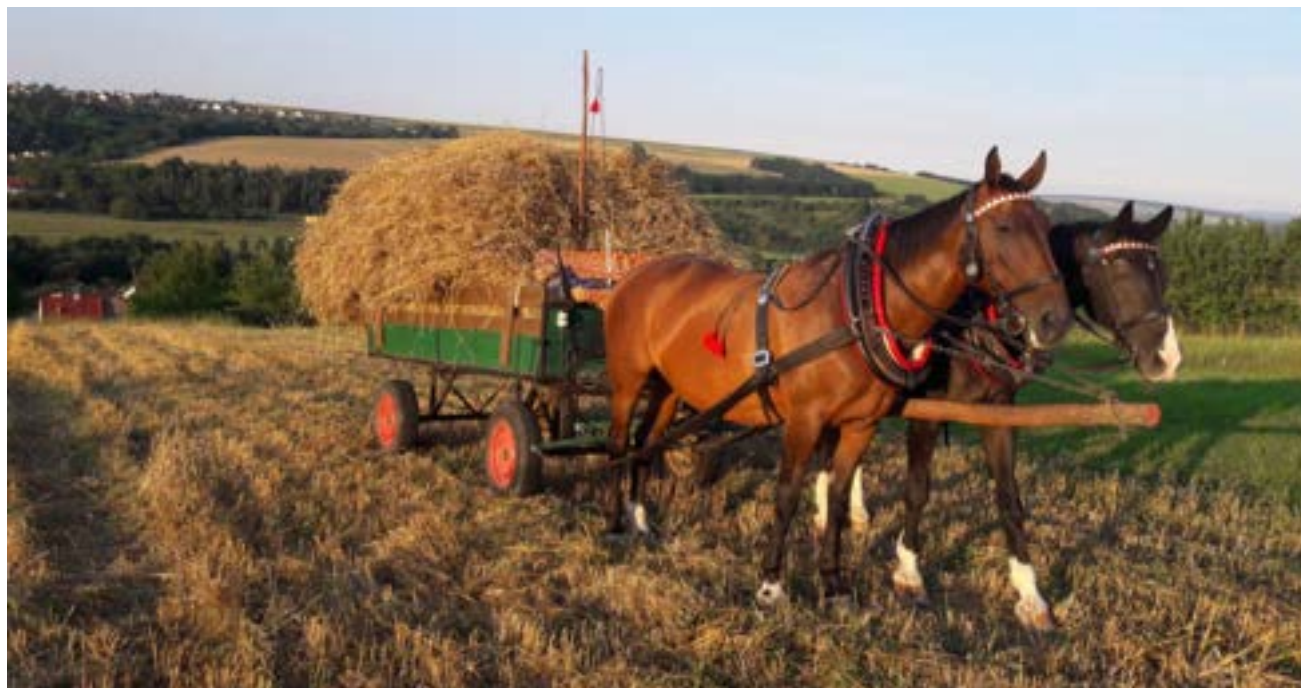
81/31 Axina (náruční) a 53/331 Athos