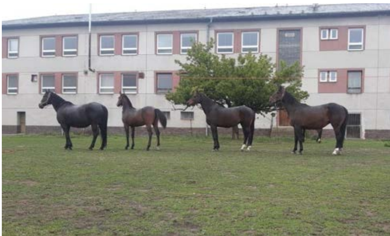
Stádečko koní rodiny Burešovy