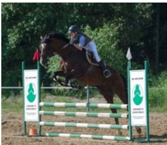
Gidran IV MT / Garnet

Exteriérově je hřebec spíše v typu angloaraba, jemnější v kostře, ale dostatečně široký a hluboký. Zatím se po něm narodila čtyři hříbata. Dcera Gidran IV MT–3/Stella zvítězila v kategorii hříbat na výstavě koní v Olomouci a na výstavě MT v Tlumačově. Všechna hříbata disponují dobrou mechanikou pohybu.