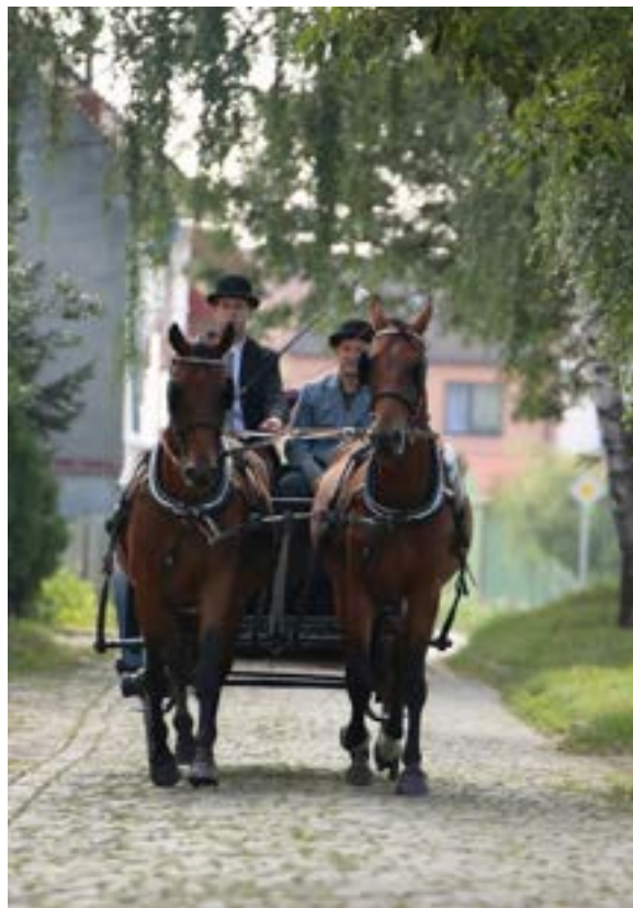
i do kočáru