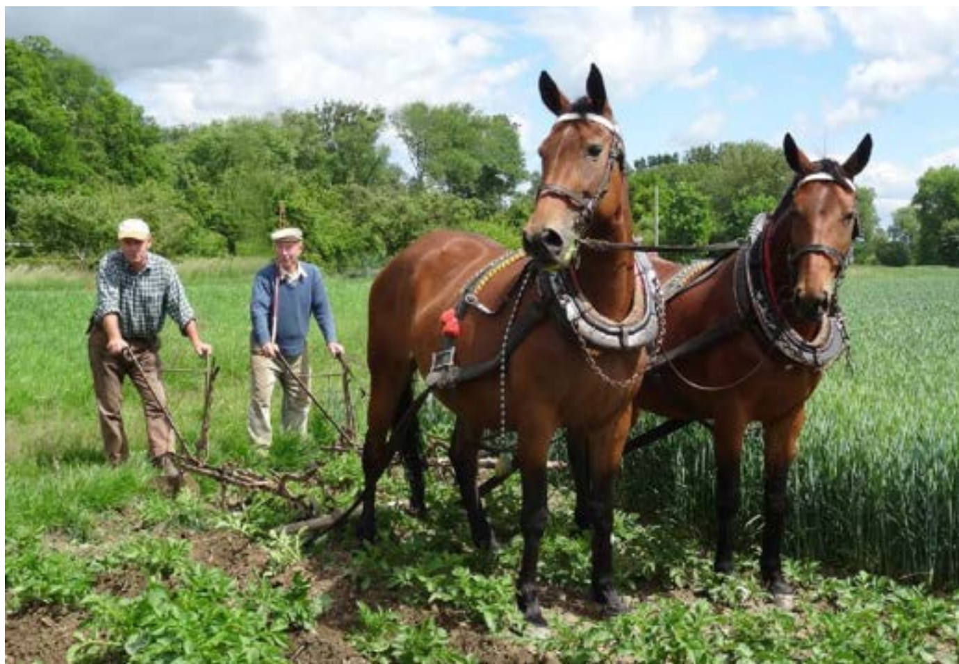
Hospodáři Gardavští – otec a syn