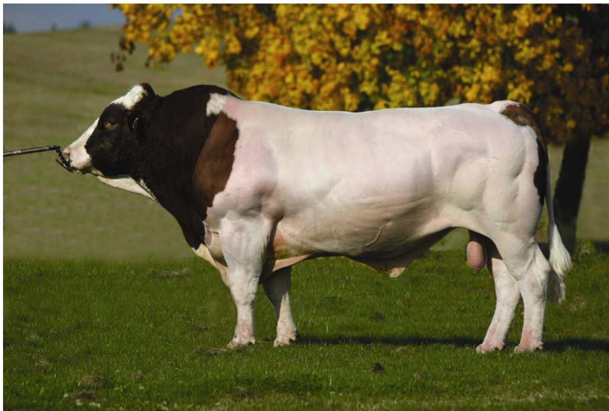
Býk RAD-186, majitel Chovatelské družstvo Impuls, družstvo.