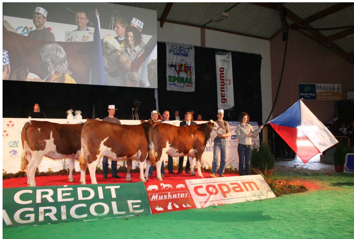
Francie - Epinal 2010, ocenění vítězné skupiny jalovic z ČR.