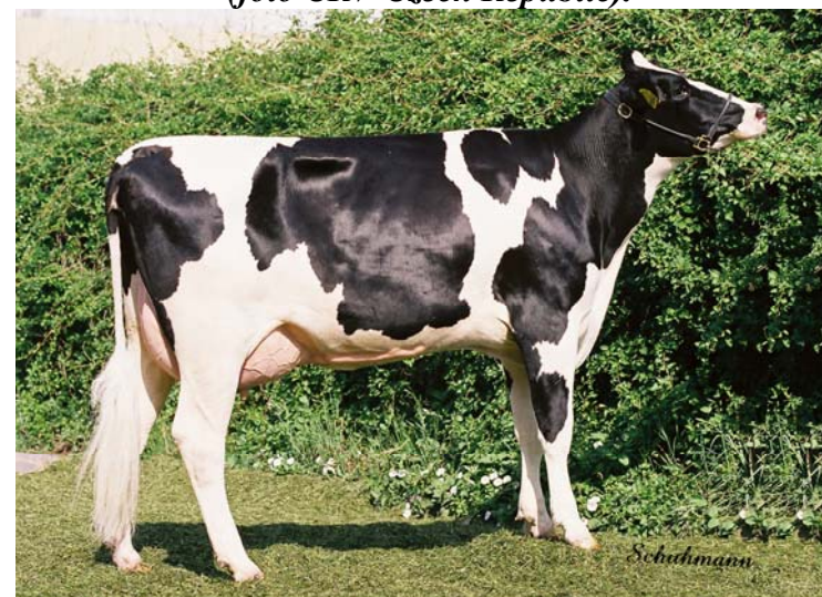
Dcera Allianceho (NXA 353), chovatel ZS Ostřetín, a. s.