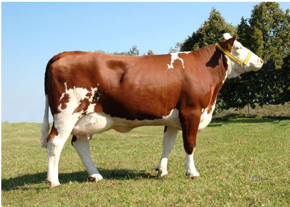
Kráva číslo CZ 001123931, Družstvo Agra Březnice.