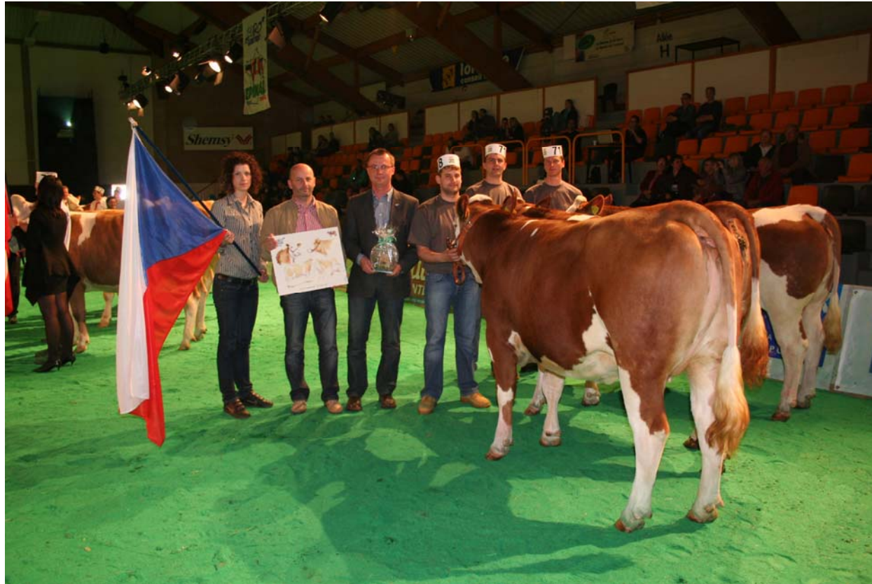
Francie - Epinal 2010, ocenění vítězné skupiny jalovic z ČR.