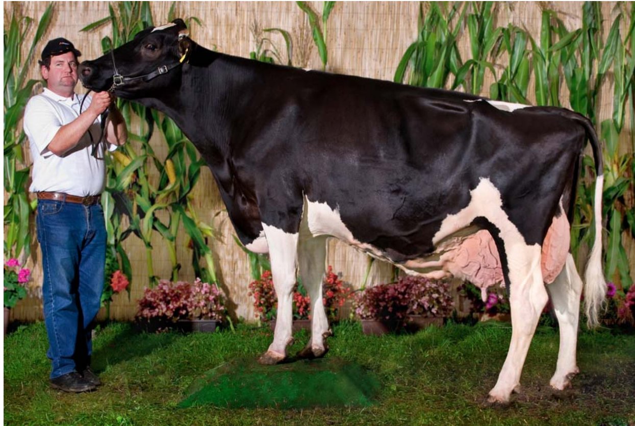
Šampionka z Mrakova 2010 (foto Svaz chovatelů holštýnského skotu ČR).