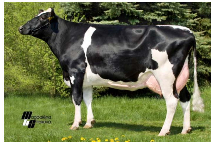
Kráva číslo CZ 255409961, Chovatel Dobrosev, a.s.

PH plemenná kniha holštýnského skotu celkem – results of cows recorded in herdbook of Holstein Cattle (total)