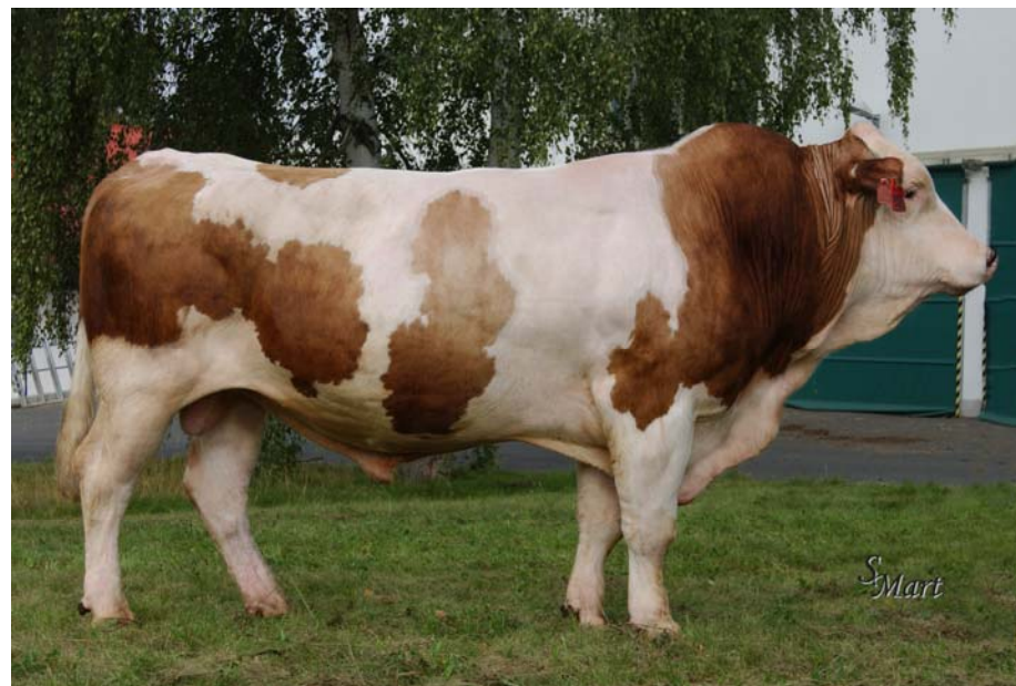
Býk RAD 178, majitel ALA, a.s., (foto CRV Czech Republic).

Pořadí – rank Číslo krávy – number of cow Zemědělský podnik – breeder Stáj – city, farm Středisko – region Plemeno – breed Otec – sire Otec matky – sire of dam Pořadí laktace – lact. record Lakt. dny – days of lactation Mléko kg – milk in kg Tuk % - fat in % Tuk kg – fat in kg Blk % - protein in % Blk kg – protein in kg Souc B+T – protein + fat production Mezidobí – calving interval