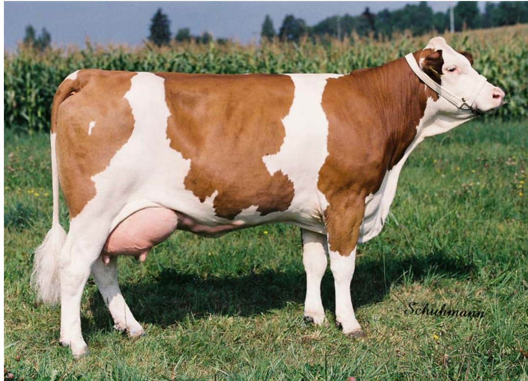
Dcera Ralmesbacha (RAD 158), chovatel ZD Roprachtice.