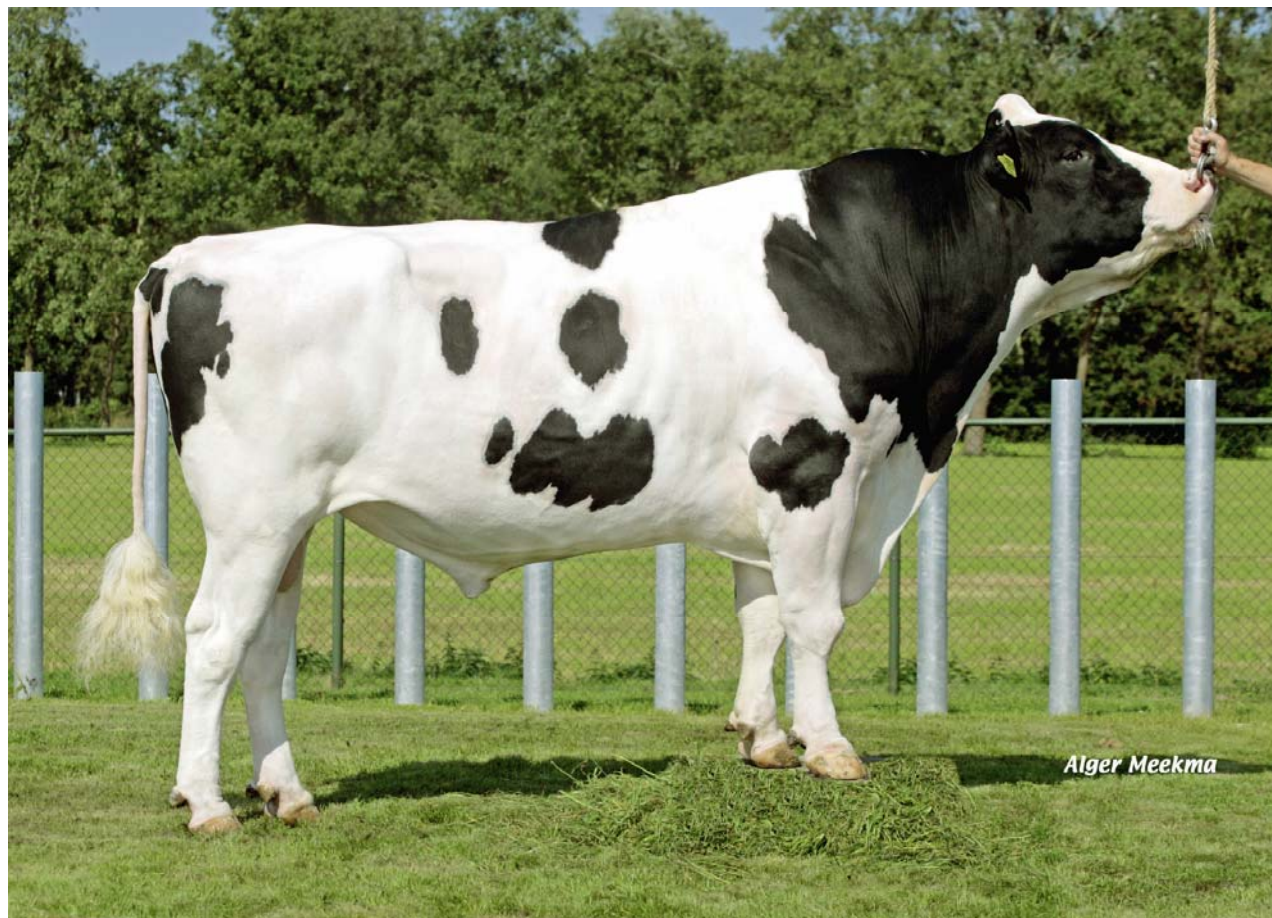
Býk NEA 495, majitel CRV Czech Republic.