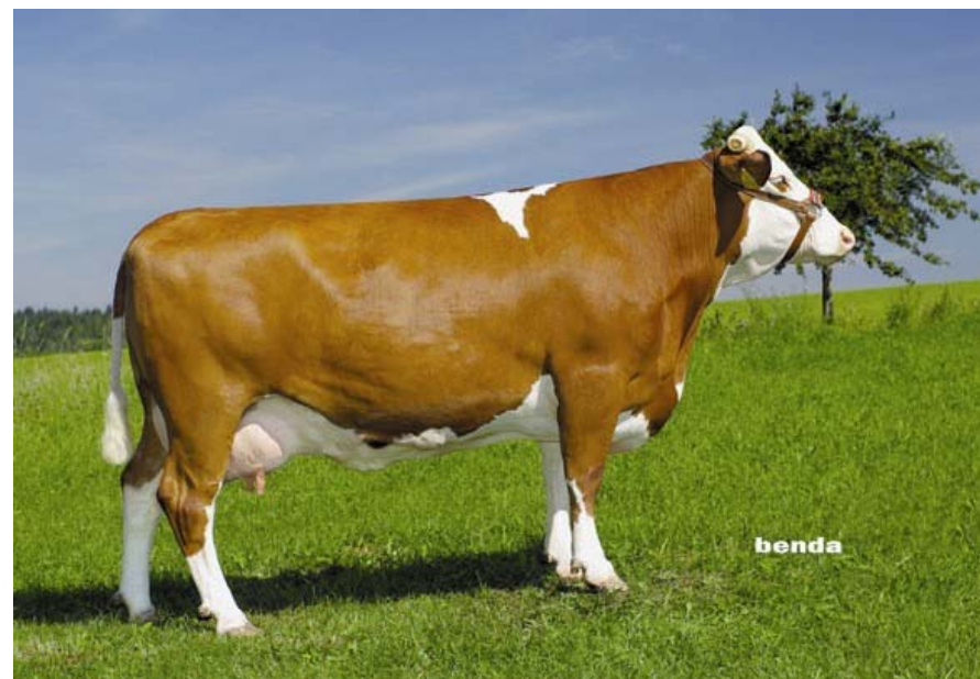
Kráva číslo CZ 221768961, chovatel ZDV Hodiškov.

Český strakatý skot – Czech Spotted Cattle (Czech Fleckvieh) České strakaté 88 % a více, 75-87 %, 51-74 % - the share of blood of Czech Spotted Cattle A více – more than Z toho horská a podhor. oblast – highlands Nížinná oblast – lowlands Holštýnský skot H 100 %– Holstein (without crossbreeds) H 100% Kříženky s podílem 88 %, 75-87 %, 51-74 % - crossbreeds with the share of Holstein blood Červený holštýnský skot – RED Holstein 100 % Kříženky s podílem 88 %, 75-87 %, 51-74 % - crossbreeds with the share of RED Holstein blood Montbeliarde - Montbeliarde Ayrshire - Ayrshire Jersey – Jersey Braunvieh – Braunvieh Normandské 75% a více - Normande Ostatní plemena a kříženky – other breeds and crossbreeds Celkem - total