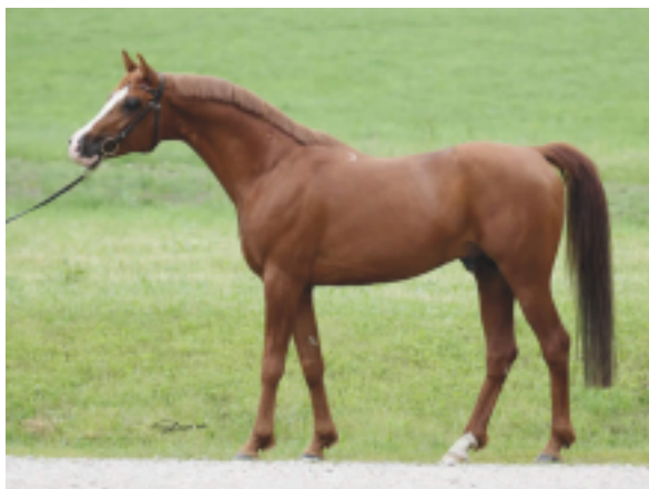
Pagur ox

Pagur je ve výborném typu a má velmi dobrý pohyb a charakter. Disponuje i skokovými schop- nostmi.