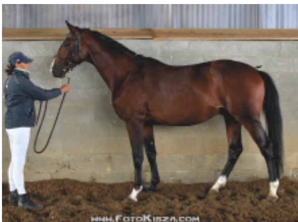
Top Gun