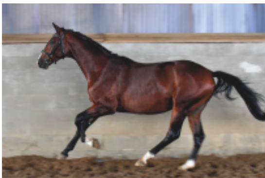
Tříletý Top Gun (Schenkendorf – Panoraam)

Pozornost se vzápětí upřela na vysokého černého hnědáka v krásném trakénském typu – IBROX PARKa (Hirtentanz – Iduna V po Velasquez) . Tento doslova tančící hřebec má neomezené skokové schopnosti do-