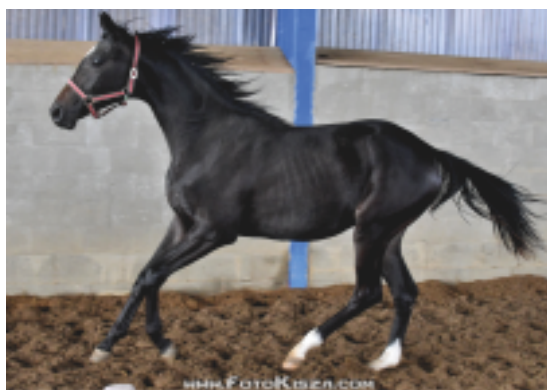
Trischa (Schralling – Triana po Topas-23 (Démon), foto Zenon Kísza

ling. Tato vranka způsobila doslova poprask svým vynikajícím a lehoučkým pohybem a ihned o ní projeví zájem zahraniční chovatelé.