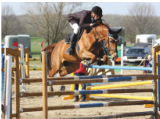
Illusive Queen (Quoniam III – Idyla po Konzulent-30) MVDr. Vít Holý, foto archiv SCHČTrak

Úspěšnost křížení trakénů s ostatními teplokrevníky je u nás doložena v historii i v současnosti. Výborný ruský AKTIV – 2 násobný vítěz Středoevropské ligy Světového Poháru, nebyl za života bohužel vůbec využit. Až později byla jeho krev zachráněna přes zmražené inseminační dávky (Hř. Albertovec a Hř. Amona). I přes minimální počet potomků se v drezuře blýskl Coladas, v military Malcolm a ve skocích Akord. TOPAS se předvedl přes syna Topas - 8, který dal drezurního šampiona Trevisa.