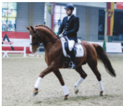
Pagur ox

Pagur je 2 x prochován na hřebce Sport a dokonce 5 x na legendárního plemeníka Priboj. V původu vyniká zejména jeho syn Pomeranec, otec olympijs- kého hřebce Paketa a hřebce století Chokkeje.