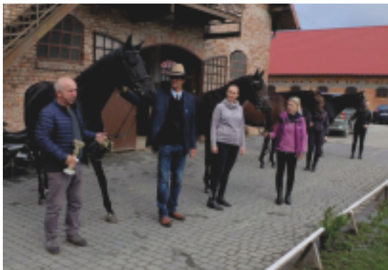
Dekorování nejlepších hřebců testu

Polský trakénský svaz úzce spolupracuje s německým Trakehner Verband a z polského chovu