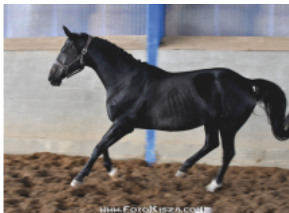
Havanna (Hohenstein – Herzklopfen po Komponist)

mu z ní vychovat několik špičkových militaristů na nejvyšší úrovni. Z plnokrevné rodiny Sophie pocházejí Derby vítězové Symbol, Silver a Silvaner.