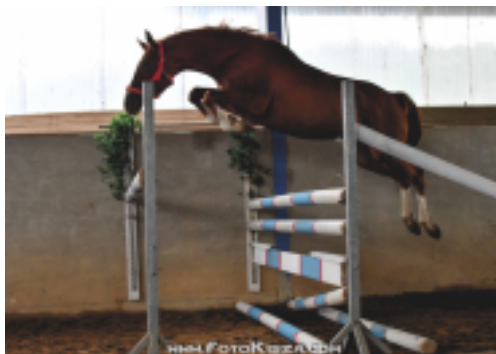
Prostota RVP (Prökelwitz - Parika po Ikar), foto Zenon Kiszka

Letos poprvé uspořádal náš svaz vlastní výkonnostní zkoušky tříletých klisen. Možnosti složení zkoušek v komfortním jezdeckém areálu v Šilheřovicích – Antošovicích využily i některé klisny PK CS. Za účasti 9 klisen se ve velmi dobrém světle předvedla trakénská ryzka PROSTOTA rodiny Prostota), velmi kvalitně před-