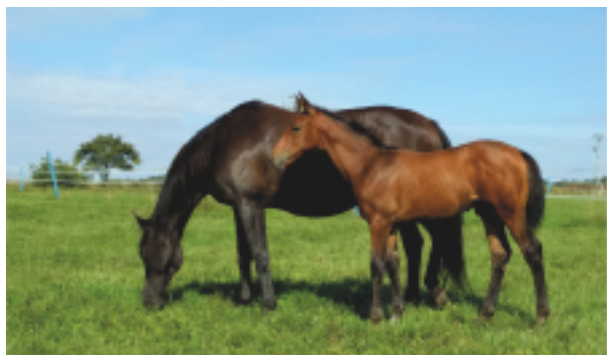
Hřebeček Avion (Aktien – Verena po Lateran), nar. 8.6.2019