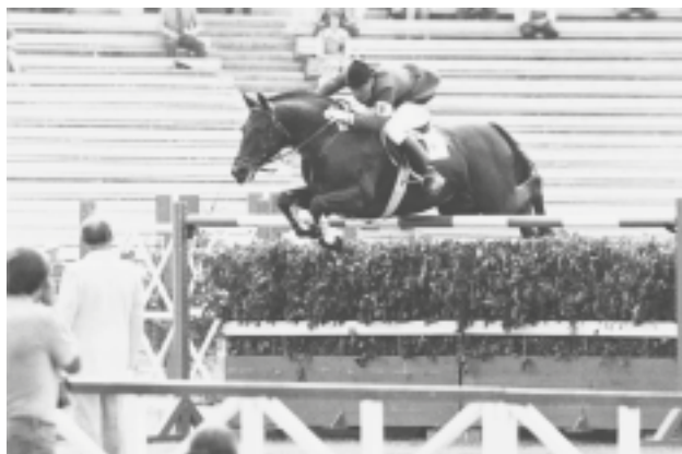
Topkij (Ostrjak – Pomeranec ox)