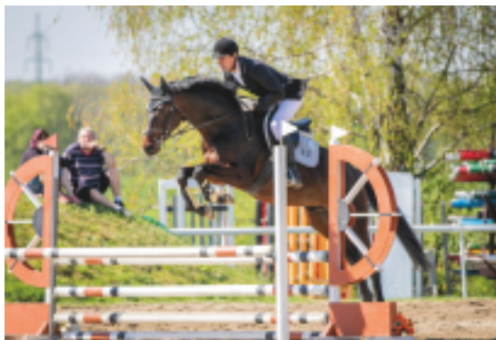
Aktien (Aktiv - Koenigspark xx) MVDr. Vít Holý