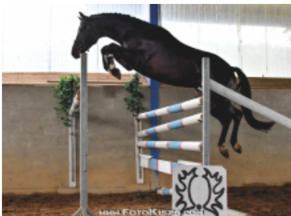
Ibrox Park

IBROX PARK je silný ušlechtilý velký hřebec s výraznou mechanikou pohybu, vynikajícím cvalem a absolutní skokovou schopností. Během německých výběrů 2 letých hřebců v Neumünsteru 2018 patřil k nejlepším skokanům. Do chovu přináší výrazný dvojitý talent pro skok i drezuru. V jeho původu jsou mnohokrát zastoupeni němečtí „Hřebci roku“, GP skokani a drezuristé. V roce 2019 absolvoval test hřebců s hodnocením 7.7 bodu s vysokými známkami za pohyb a skok.