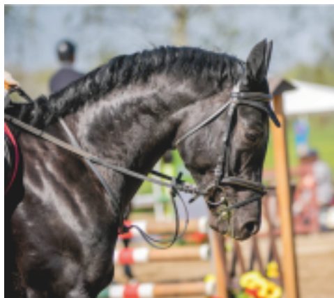
Aktis, foto archiv majitele

Mys xx (Flying Star - Astyanax), pot. skok T