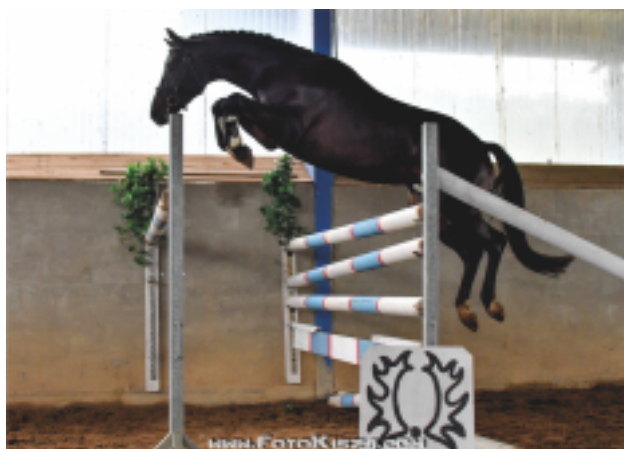
Ibrox Park (Hirtentanz – Velasquez), foto Zenon Kisza