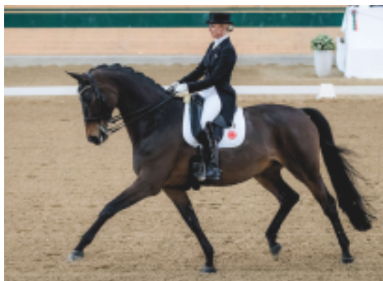
Jessica von Bredow Werndl - TSF Dalera BB (Easy Game – Handryk)

mistrovství Německa (2. místo freestyle a 3. místo GP special), zvítězila v týmech v Poháru národů v Cáchách a byla i členkou vítězného družstva na Mistrovství Evropy v Rotterdamu. Fantastický výkon podala Dalera během Stuttgart Masters na konci sezony, kdy porazila celou elitu v čele se světovou jedničkou I. Werth. V kvalifikaci Světového poháru- freestyle - dosáhla 88,4 %.