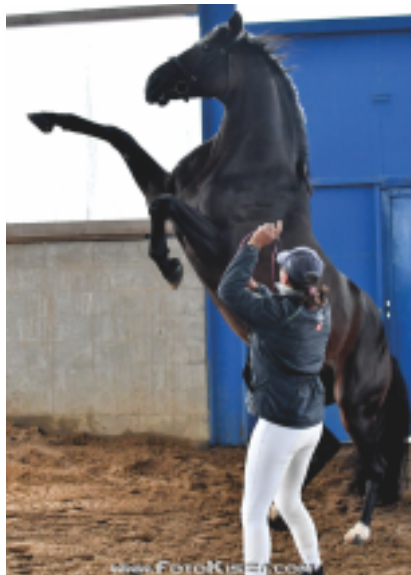
Quintar na přehlídce trakénů v Borové

se o vynikající angloarabskou linii BURNUS AA – Sixtus (Elite Hengst a GP skokan) - AXIS (Elite Hengst, nejlepší skokan körungu a následně olympijský drezurní kůň). Sixtus byl navíc Hřebcem roku Německa v r. 2001. V původu Ibrox Parka se navíc objevují legendární hřebci KOSTOLANY (Hřebec roku Německa 2009 a děd famoziního mistra světa v drezuře Totilase), Hřebec roku Německa 95 Mackensen a angloarabský hřebec Kallistos. Mnohonásobný vítěz těžkých skákání, otec Ibrox Parka Hirtentanz ukončil