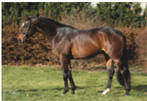
Erste (Esteban xx - Heling)

Erste (Esteban xx – Titania III po Heling), nar. 2007 v Německu (K. H. Schulenburg). Objevoval se ve skokových soutěžích do 115 cm (2 umístění) a v military do st. L* (1 umístění). Tento původově i exteriervě mimořádně zajímavý hřebec začal bohužel se sportovní kariérou pozdě a proto uniká pozornosti chovatelů. Navíc jeho otec dal potomstvo až do olympijské úrovně v military a matka Titania III po Heling je i matkou jednoho z nejlepších militaristů na světě – TABASCO TSF. V roce 2020 se mu konečně narodí první trakénská hříbata.