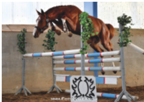
Vítěz výběru dvouletých hřebců 2018 Sargoni Son Sargoni - Plazma po Zakon xx), foto Zenon Kisza

körungu 2018 Sargoni Son LH. Morava má pak nově již 3 stanice. Zemský hřebčinec Tlumačov nabízí původově i exteriervě velmi kvalitního hřebce Erste, v Kyselovicích u Kroměříže bude připouštět osvědčený šampion Quintar. Nově zařazený plnokrevný hřebec Glorioso xx bude působit na stanici Lužice, okr. Hodonín. Stanici Hřebčína AMONA v Bolaticích posílí nově zařazení Ibrox Park a Top Gun, nadále zde zůstávají Aktien a Aktis. Tato stanice má navíc k dispozici množství velmi kvalitních světových hřebců ve zmražených ID.