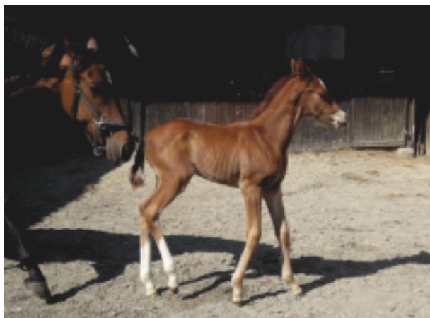
Klisnička Caroline (Topas – 14 – Carben po Balisto Z), nar. 26.3.2019