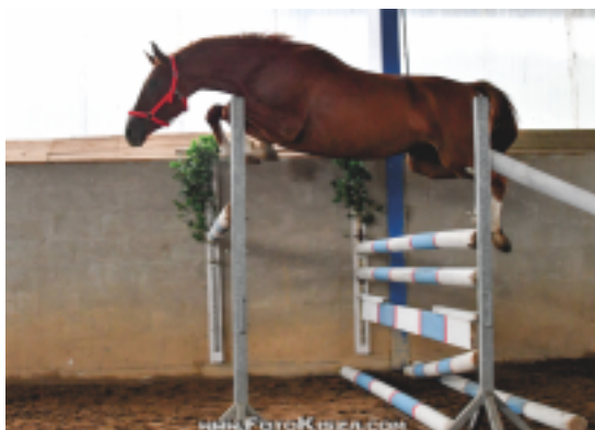
Tříletá Prostota RVP (Prökelwitz – Parika po Lateran)

tomu nejlepšímu v československém chovu. Je smutnou skutečností, že vyhynutí této linie dopustily domácí chovatelské svazy. Následovali plemeničí AKTIS (Aktiv – Kachetia po Chalif 5) a AKTIEN (Aktiv – Schlodien II po Königspark xx) . Tito 4letí plemeničí jsou již testováni ve sportu a absolvovali 7, respektive 14 bezchybných parkurů. Aktien má již narozené první potomky ve velmi dobrém typu. Hřebci jsou v majetku MVDr. H. Holé- Hřebčín Amona.