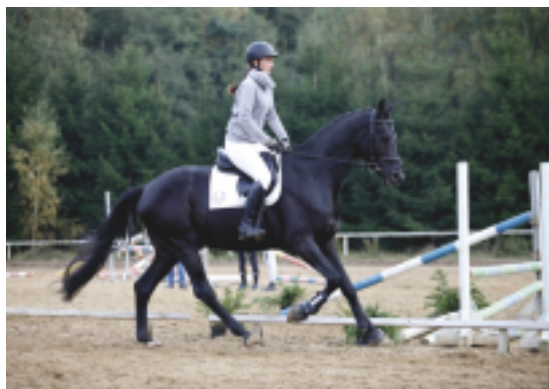
Veritas Victis (Hektoras - Heleris)

úspěšně působí v Německu hřebci Adorator, Kros a Avatar. V polském chovu je zas patrný silný vliv litevských trakénů, zejména linie Heleris či plnokrevný Gluosnis xx.