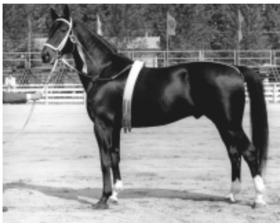
Quoniam II

Dnešní doba neomezených možností příliš nenahrává dlouhodobé poctivé chovatelské práci. Je snadnější si hotového koně koupit a nepodstupovat dlouhý