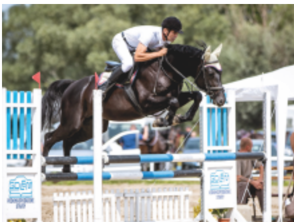
Aktis, foto archiv majitele