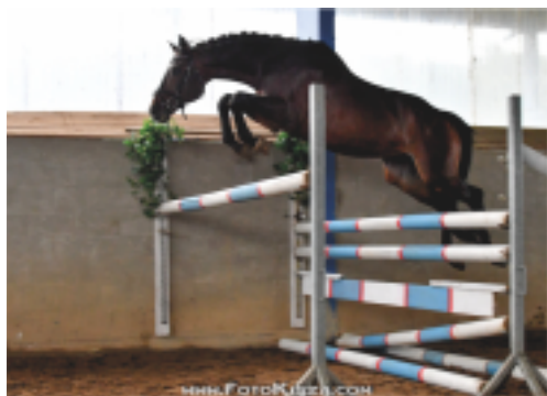
Erste, foto Zenon Kiszka

RVP (Prökelwitz – Parika po Ikar, z albertovské vedená Ivetou Ruzzovou – Červenkovou). S dosaženými 8,5 body se stala vítězkou zkoušek.