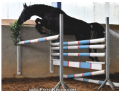
Aktis (Aktiv - Chalif 5), foto Zenon Kisza

skoku ve volnosti bylo předvedeno 10 koní, kteří podali velmi dobré výkony a sklidili zasloužený potlesk diváků. Výstavu zahájil kapitální, již prověřený hřebec QUINTAR (Quintet – Stella po Saint Tropez). Mohutný, exteriérově vydařený hřebec vynikl v pohybu i ve skoku. Svůj mimořádný charakter předává i na potomstvo. Quintar je již posledním žijícím čistokrevným zástupcem linie Quoniam, která patřila k