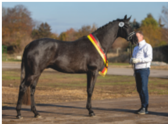
Vítěz körungu Ferrari Forever (Helium – Impetus)

Letošní světové výběry byly termínově posunuty až na začátek listopadu, na 8. až 10. 11. Počasí se však vydařilo a tak jsme mohli zase po roce shlédnout světovou trakénskou elitu. Ze 40ti mladých hřebců bylo nakonec vybráno 14. Vítězství si odnesl rakouský FERRARI FOREVER, (Helium po Millennium z matky For Ever po Impetus). Mohutný hnědák s velmi dobrým pohybem a slušným skokovým projevem pochází z rodiny drezurních šampionů (Fellini, Fleur), plemeníka Fairmont Hill a T skokanů Pikeur Formidable, Fabienne, Faraday, Flieder či Flambeau. 1. rezervní vítěz TARYK (Lücke – Tarya po Hirtentanz) kombinuje výraznou skokovou krev, je pravým bratrem