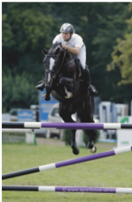
Hirtentanz (Axis – Kostolany)

Z drezurních hvězd vzpomeňme kromě famozní DALERY TSF ještě ERLANTANZE (Latimer), umístěného s Charlotte Dujardin na CHIO Aachen 2019, HEUBERGERa (Imperio), GRIMANIho (Gribaldi), GOLDMONDa (Imperio – Latimer), EDBERGa (Connery – Kaiser Wilhelm), ASTON MARTINa (Monteverdi – Sixtus), KRISTJANA (Polarion – Napoleon Quatre), HAMILTONa (Distelzar), SHAPIRa (In Petto – Biotop), HOFGLANZE (Hoftänzer) nebo BOURANIho (Fairmont Hill).