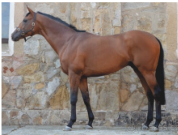
Glorioso xx

Otec AREION je mnohonásobným šampion - plemník Německa v letech 2004, 10, 12, 13, 15 a 17. Ze 16ti startů vytěžil 5 vítězství a 4 umístění a startoval převážně v Grupových a Listed dostizích nejvyšší úrovně. Zvítězil i v dostihu Gr. II. Je otcem 22 Grupových vítězů. Na dotacích získal 575 tis DM.