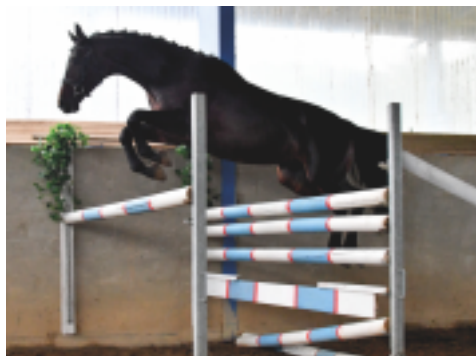
Aktien (Aktiv - Koenigspark xx)