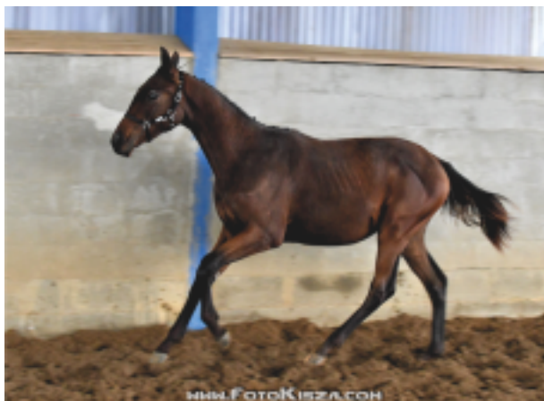
Hřebeček Schampus (Schralling – Chanelle po Quintet)