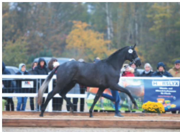
Ferrari Forever