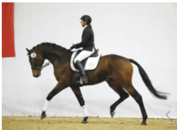
Sargoni Son LH