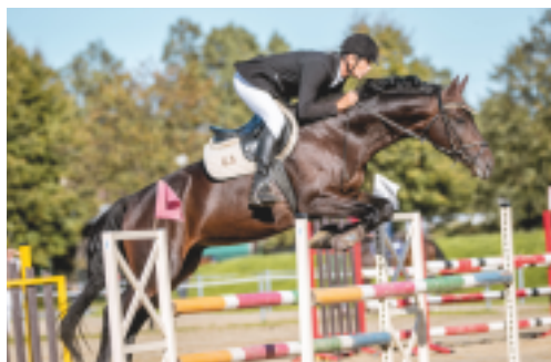
Aktien - MVDr. Vít Holý

Celkem 13 narozených hříbat bylo letos po hřebcích AKTIEN (4 x), SPECIAL MEMORIES (4 x), QUINTAR (4 x) a TOPAS – 14 (1 x). Posílili jsme tak linii Aktiv – Pepel – Piligrim – Pythagoras, Abdullah – Pregel – Hyperion – Dampffross, Quoniam – Quido – Pythagoras – Dampffross, a Schwalbenzug – Humboldt – Ararad – Jagdheld – Perfectionist xx. Narodilo se 6 hřebečků a 6 klisniček a tak máme od r. 2013 již 65 hříbat trakénského chovu.