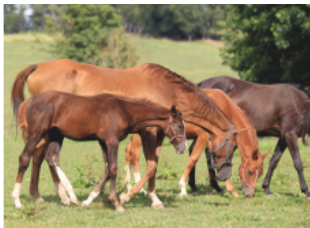
Klisnička Daisy (po Quintar), nar. 24.4.2019 s matkou Gója (Obvod – Goa xx po Monseigneur (USA)