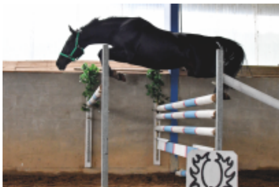
Irlanda (Grand – Ikarie po Ikar (Lateran)

A pak už diváci netrpělivě očekávali oba účastníky 80ti denního testu. Jako první vstoupil do předváděště TOP GUN (Schenkendorf – Evita Peroni po Panoraam). Elegantní, mimořádně charakterní hnědák s výborným