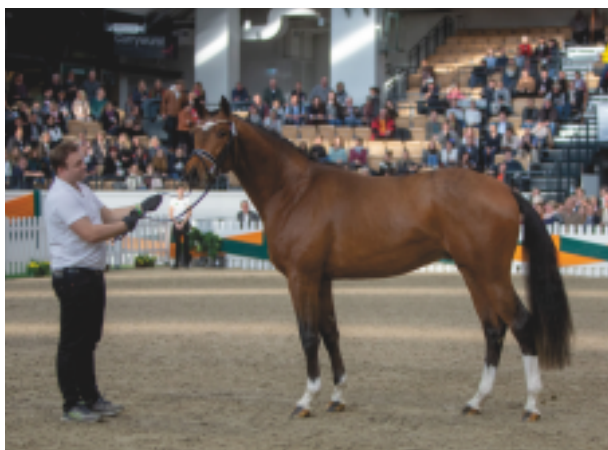
Rezervní vítěz Taryk (Lücke – Hirtentanz)