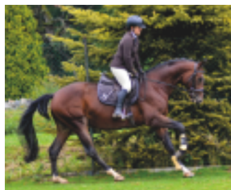
Top Gun

a umístil se na 4. místě v jednotlivcích. Pochází z linie Ostrjak – Ossian – Pilger, v kombinaci s linií Pomeranec (otec olympijského Almoxx Printse). Schenkendorfova matka Schlodien II je po plnokrevném Königspark a dala celkem 5 plemeniků a potomstvo výkonné až do st T. V Hřebčíně Amona působí její syn AKTIEN (Aktiv).