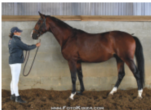
Tříletý Top Gun (Schenkendorf - Panoraam)

Trakénští hřebci v ČR budou v sezoně 2020 rozmístěni již na šesti stanicích. V Čechách bude v Makotřasech u Prahy působit výborný Plesant – drezurní šampion a Kůň roku, který je zcela neprávem stále málo využit. V Sedmpanech bude stát velmi nadějný vítěz