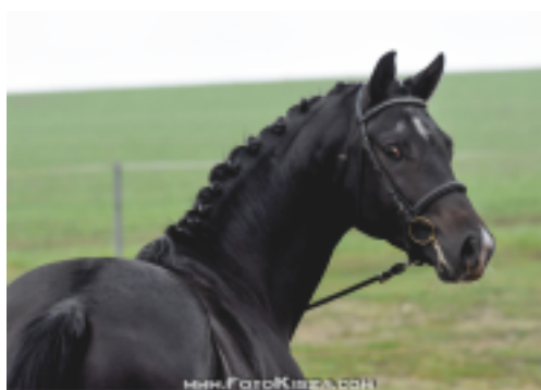
Ibrox Park