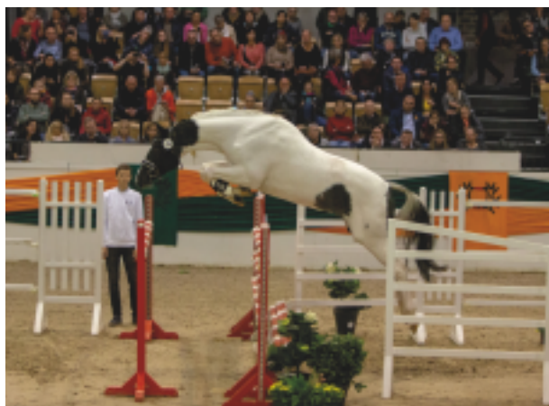
Grenoble (Marseille – Brioni)