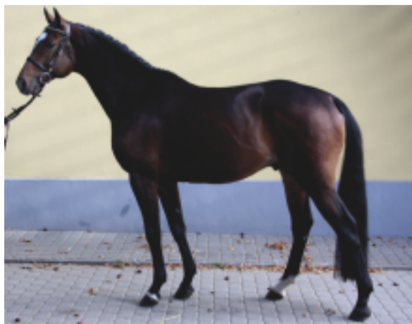
Erste, foto archiv ZCHKs