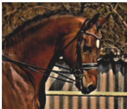
Heidekrug

dědem špičkových plemenků First Flight (GP skoky), First Flight Spirit nebo First Flight Aliance. Z Mistrovství Evropy v military si přinesla stříbro jeho vnučka First Flight Beauty. Plnokrevný T skokan BEG xx dal řadu špičkových plemenků a T skokanů a drezuristů v čele s olympijským Paul Vom Gäu.