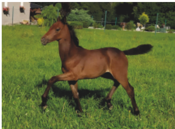
Klisnička Savoir Vivre (Aktien – Sirael po Sargoni), nar. 22.7.2019