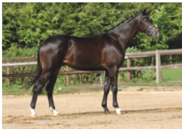
Ibrox Park jako dvouletý před körungem v německém Neumünsteru