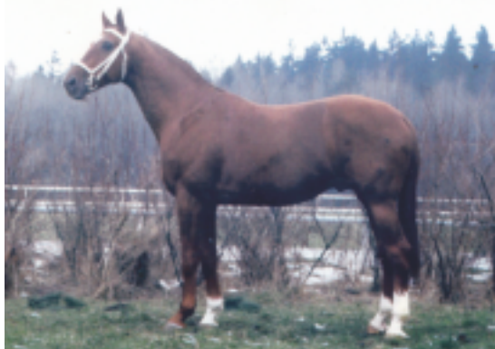
Quoniam III, foto archiv SCHČTrak

Náš trakénský svaz se snaží zvrátit tuto historickou situaci zařazováním kvalitních charakterních hřebců s dvojitým talentem. Schopnost pro skok i drezuru a potažmo všestrannost považujeme u zařazování zejména mladých hřebců za zásadní. Dnešní rozdělení na skokové a drezurní sekce nepovažujeme za chovatelský pokrok, ale jen další posun ke komercializaci chovu. Zejména u drezurních koní je dobré připomenout, že schopnost oslnit diváky extrémním klusem ve 2 letech je jen slabý předpoklad pro kvalitního drezurního plemeníka. Situaci, kdy některé zahraniční svazy dokonce odstranily i gymnastickou řadu při předvedení 2-letých na körungu, nemůžeme už vůbec komentovat.