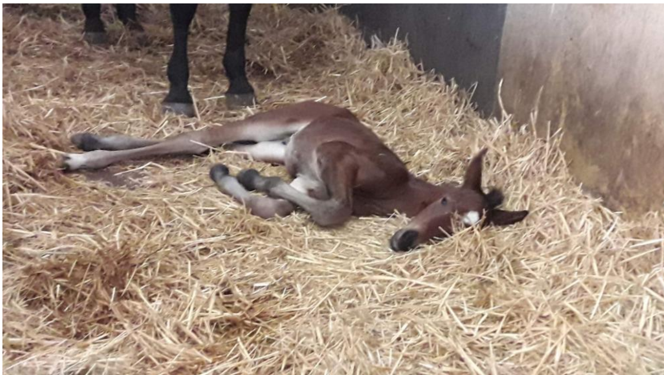
Przedswit V MT-18 /Pepi