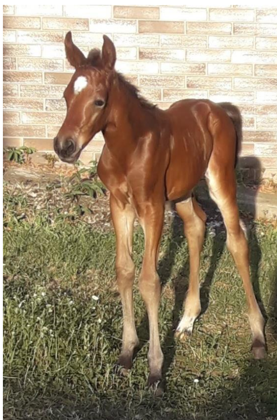
Przedswit V MT-18 /Pepi s matkou 57/694 Petty