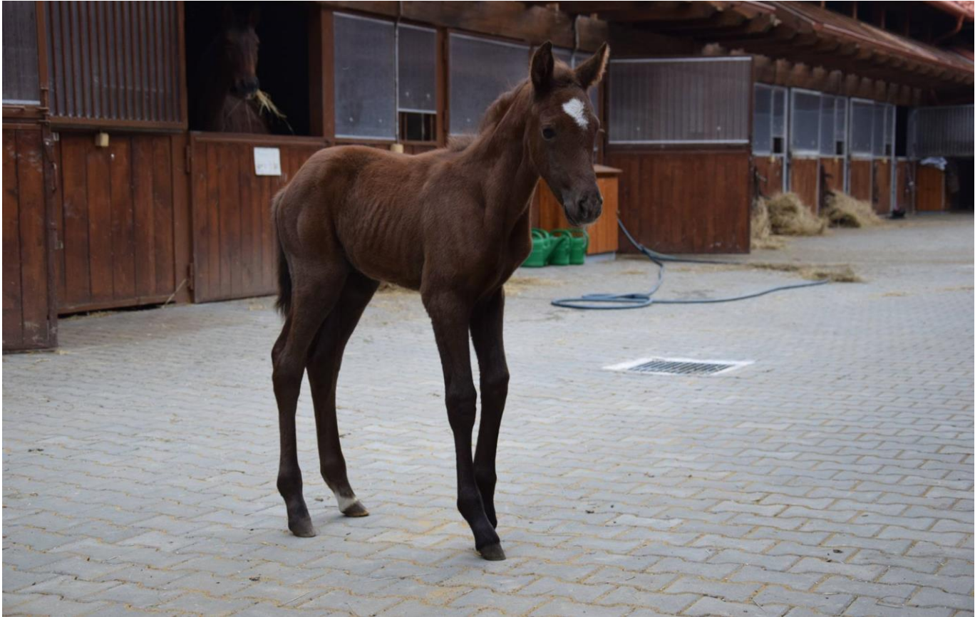
Przedswit V MT-9/ Rebelka G