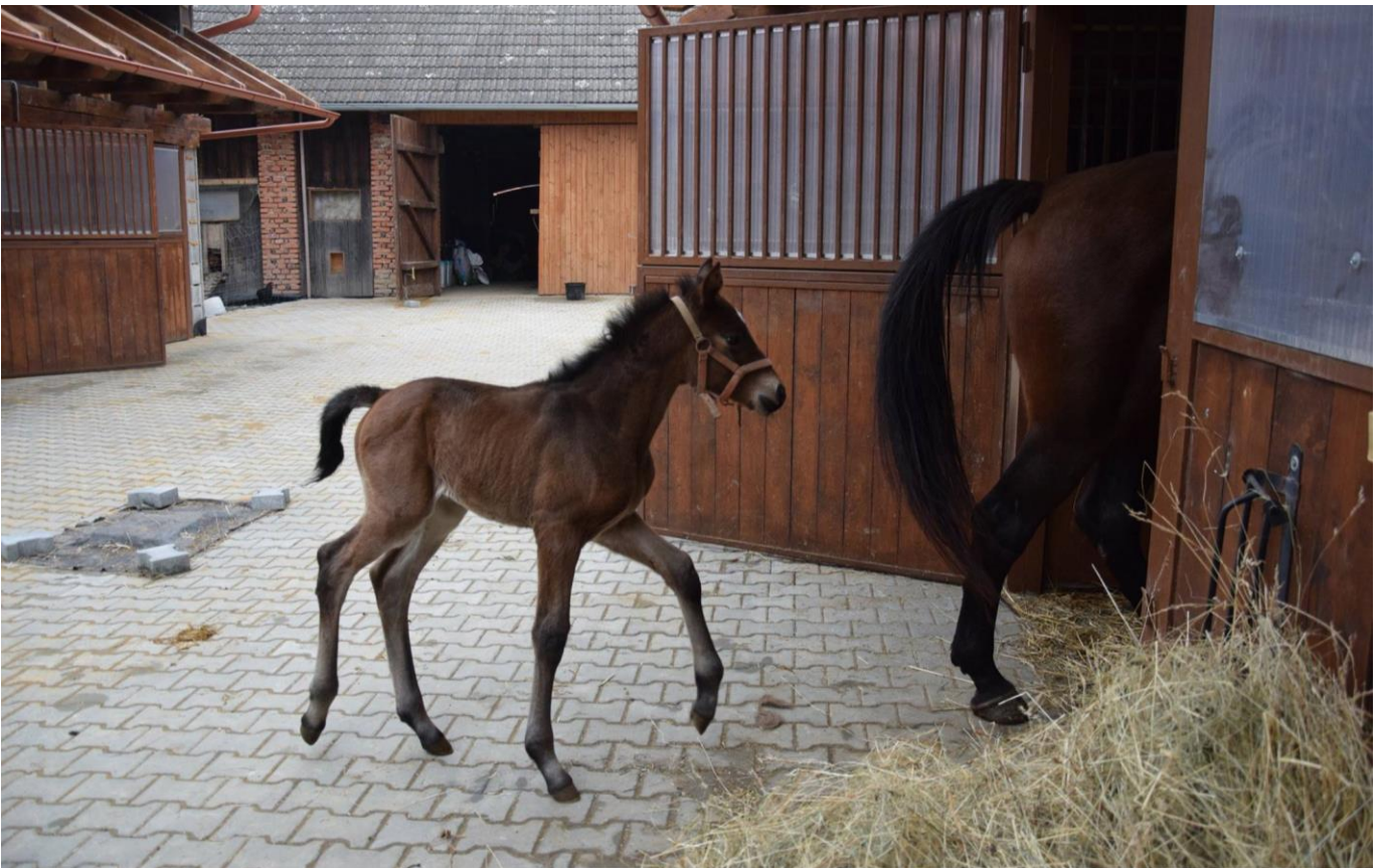
Przedswit VIII MT-10/Narden G