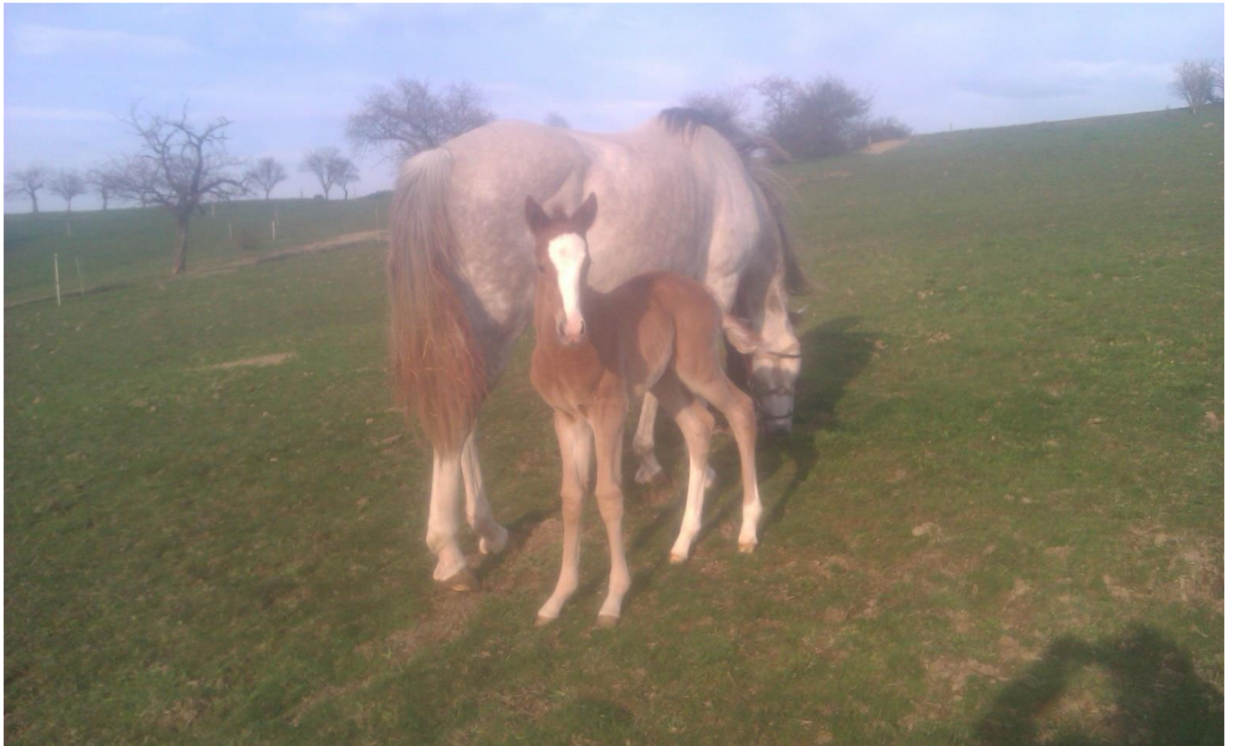
Gidran IV MT-3/Stella s matkou Sahib I MT-3/Sachmet