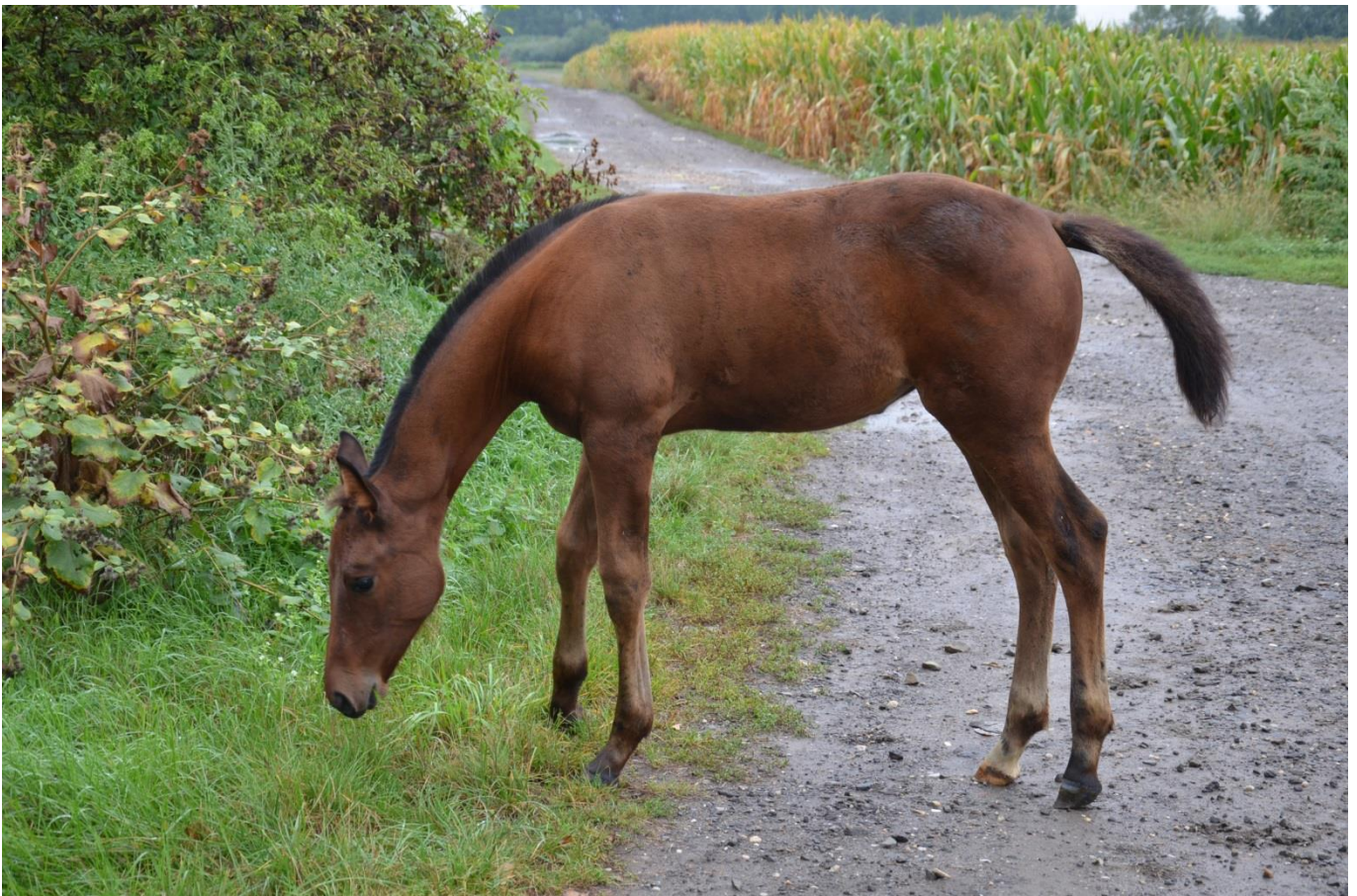
81/302 North Star I MT – 9/ Nefrit