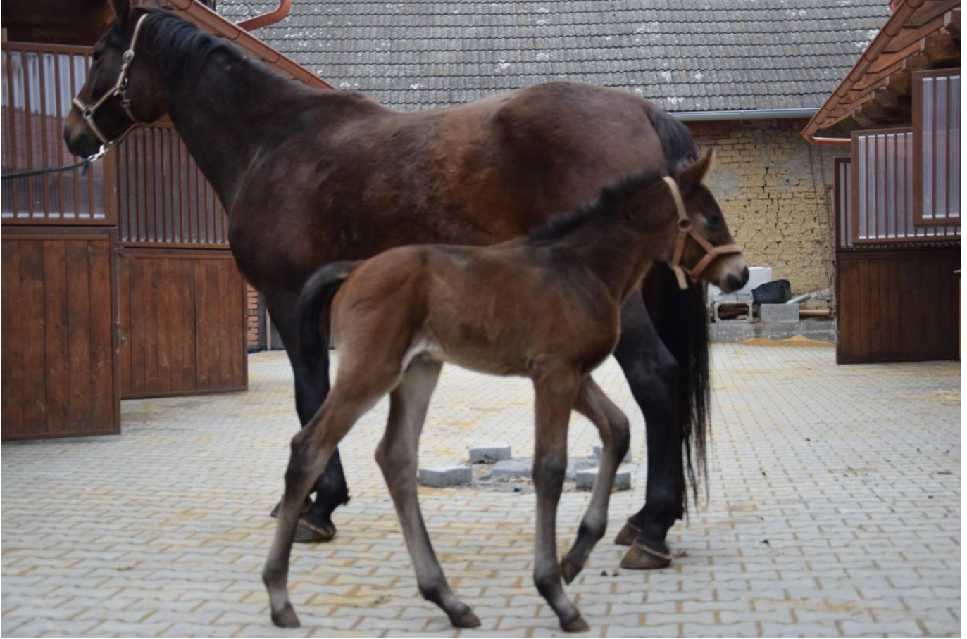
Przedswit VIII MT-10/Narden G