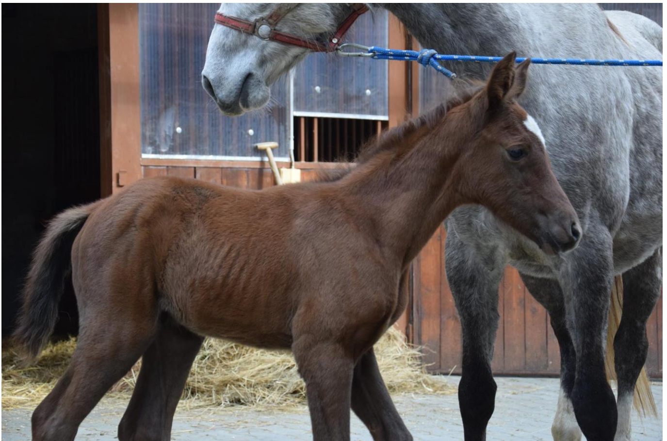
Przedswit V MT-9/Rebelka G