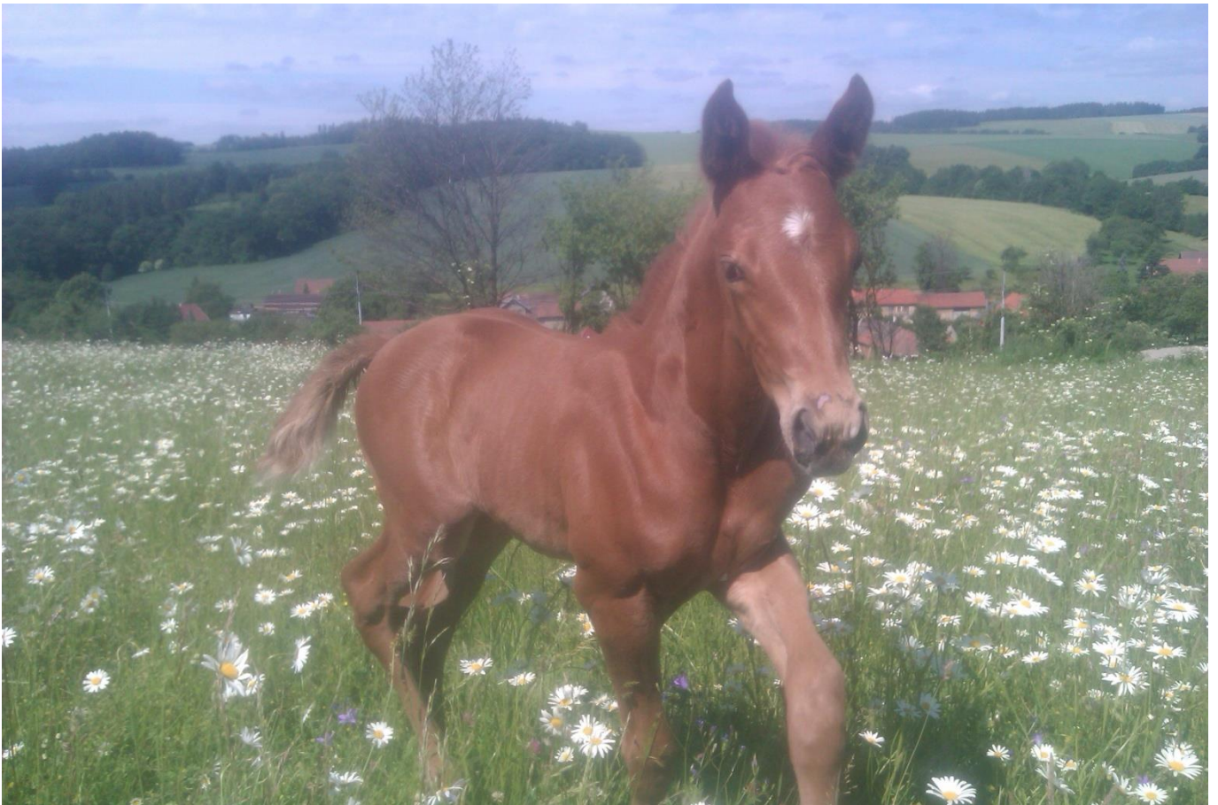
Gidran IV MT-4/Scarlett