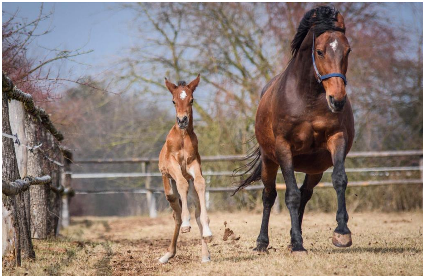
Dahoman I MT-5 Ithildin s matkou Prémia