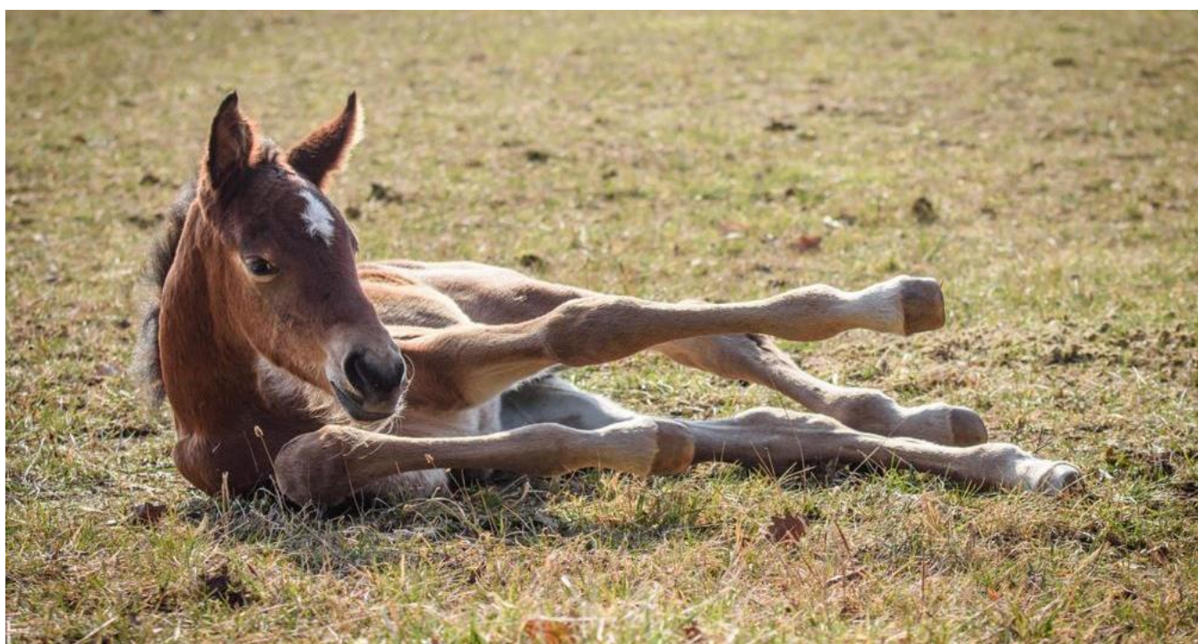
Dahoman I MT-5 Ithildin