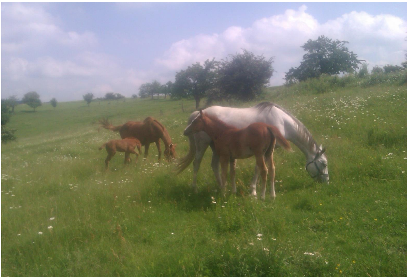
G IV MT-3/Stella a G IV MT-4 Scarlett s matkou Sotea A 1/1