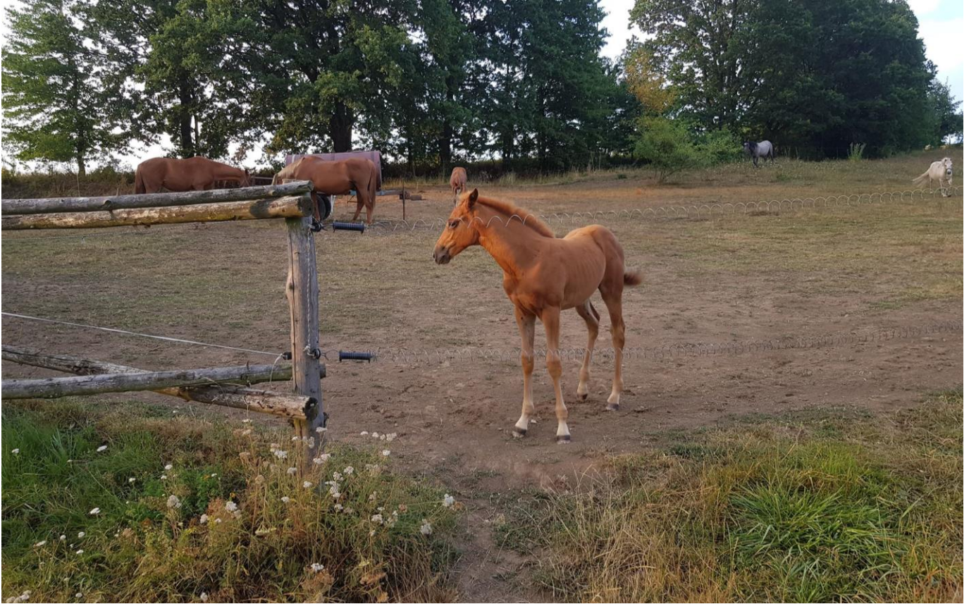
Gidran IV MT-4/Scarlett