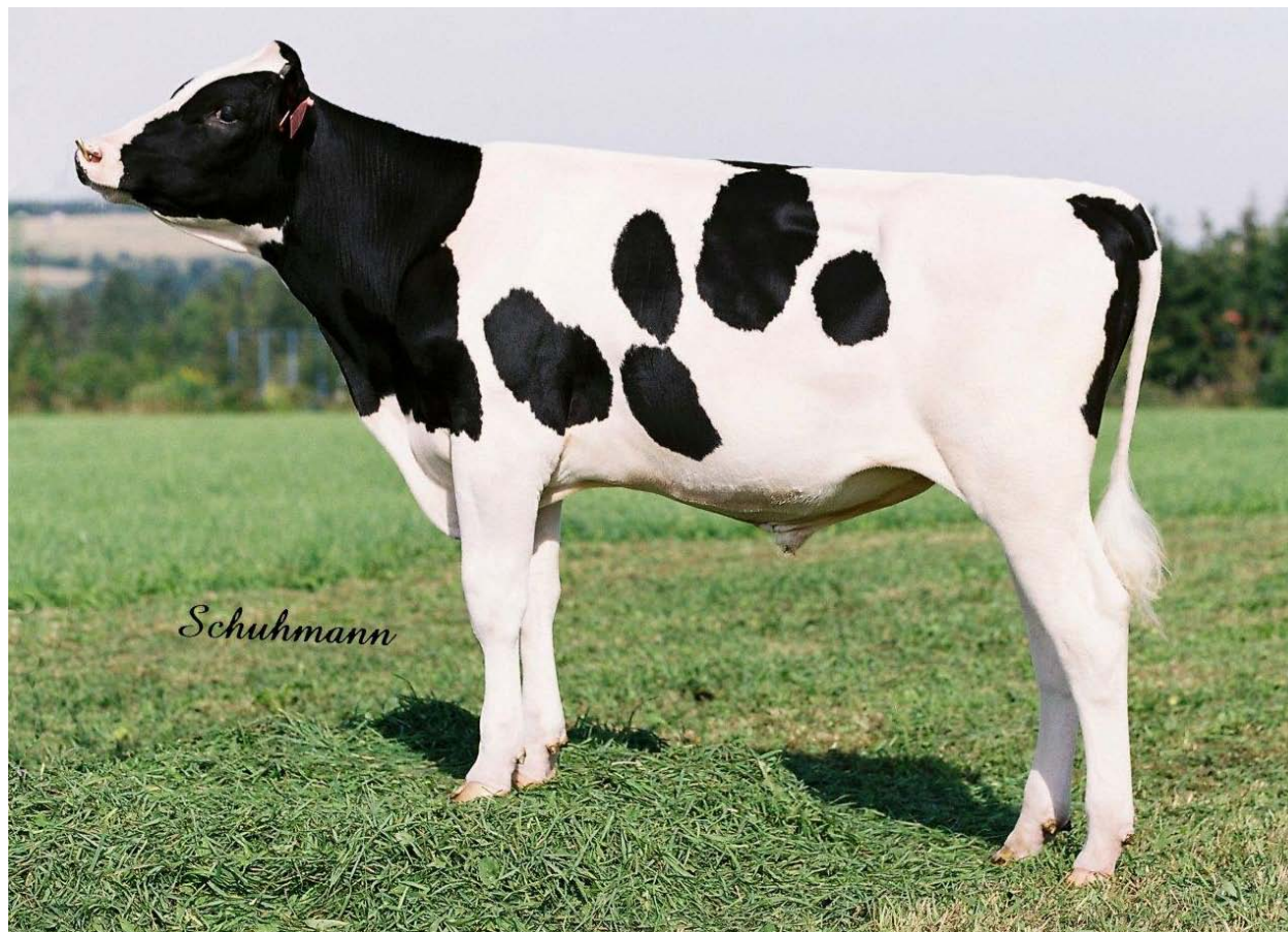
Losteden NEA 782.