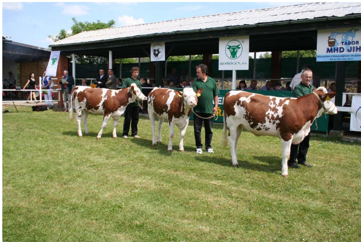
Opařany 2011.