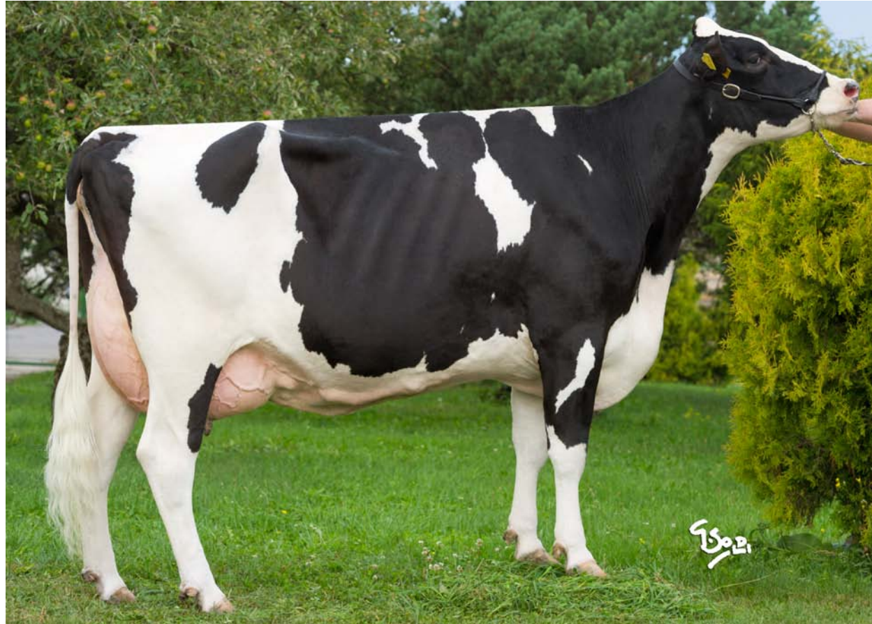
Dcera Kolta Ostřetín Marketa 10 CZ171584953, chov.: Zemědělská společnost Ostřetín, a. s.