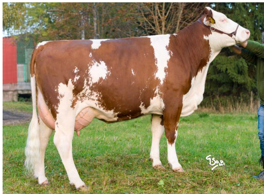
Dcera Girolda CZ 401563961, chov.: Agro Zvole.

printed variety (e.g. if the discovered out representation of breeds in stable is C46H43R09, H52C46 will be printed). If both varieties H and R are disregarded, but their sum reaches at least 12%, the prevailing variety is printed while the proportional representation of the sum of both varieties is provided.