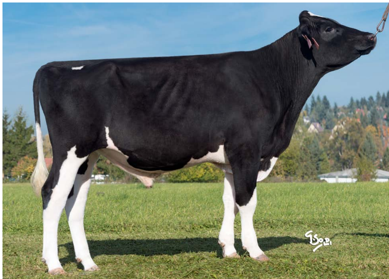
Ostretin Polledstar, dcera býka P NEO 267.