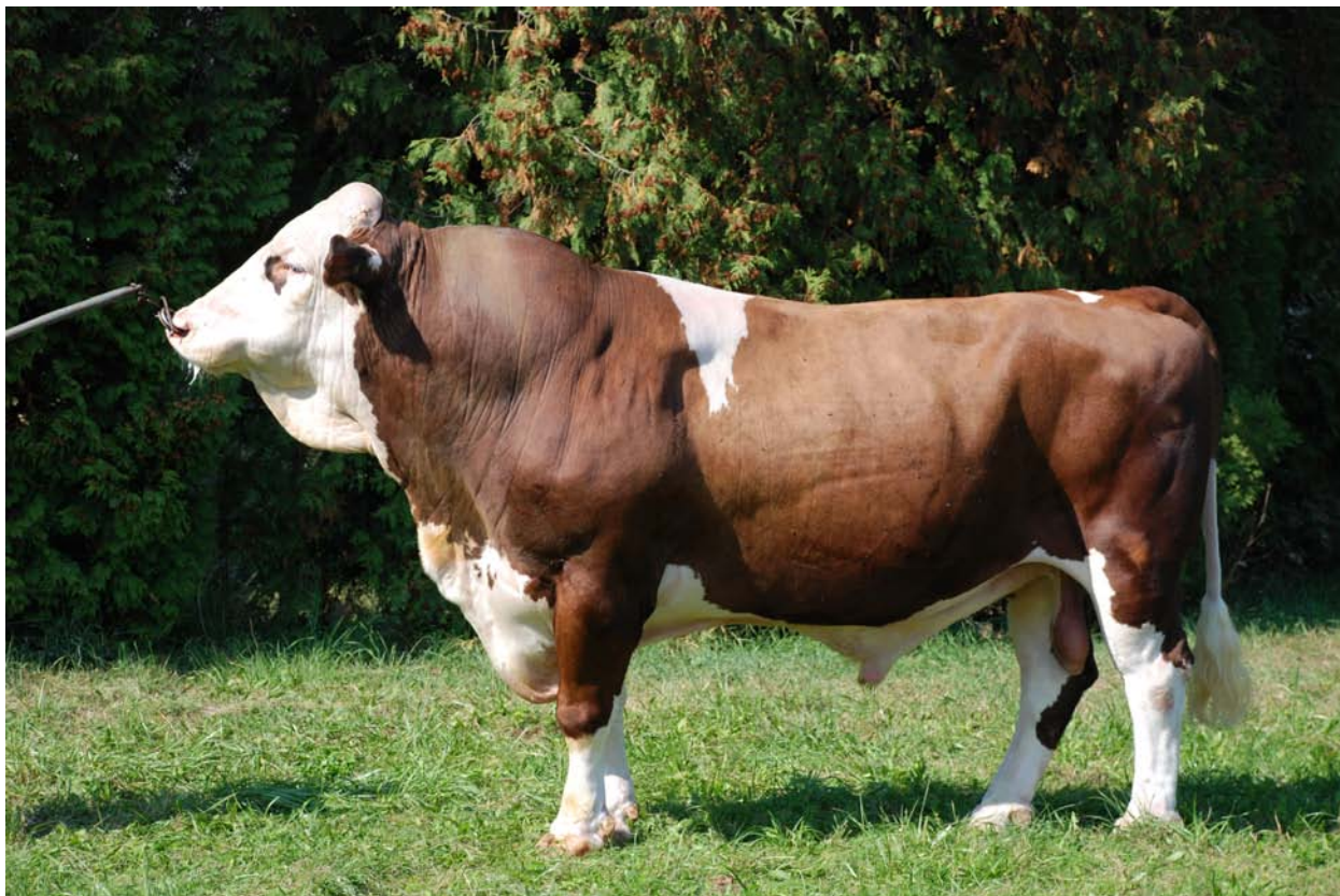
Býk RAD-257 (foto Plemo, a. s.).