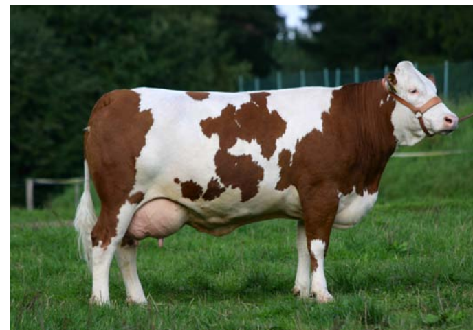
Kráva číslo CZ 170508953, Proagro Radešínská Svratka.