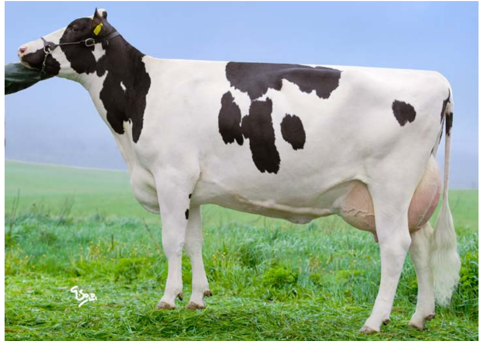
Kráva číslo CZ 166049981.

Pořadí – rank Číslo krávy – number of cow Zemědělský podnik – breeder Stáj – city, farm Středisko – region Plemeno – breed Otec – sire Otec matky – sire of dam Pořadí laktace – lact. record Lakt. dny – days of lactation Mléko kg – milk in kg Tuk % - fat in % Tuk kg – fat in kg Blk % - protein in % Blk kg – protein in kg Souc B+T – protein + fat production Mezidobí – calving interval