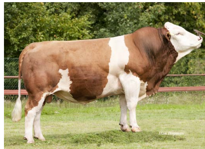
Býk HG 297.