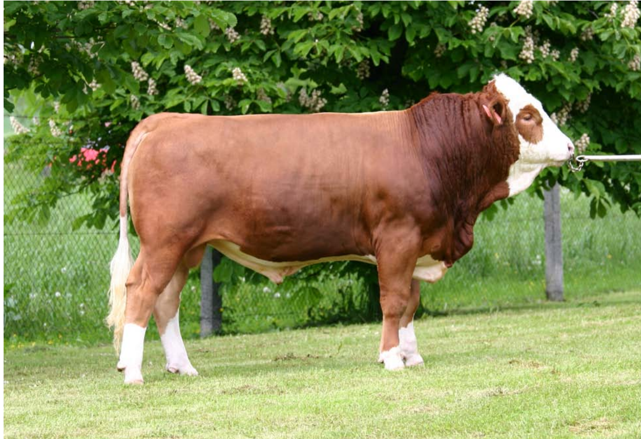
RAD-372, (foto Chovatelské družstvo Impuls, družstvo).