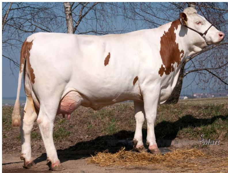
Kráva po býku AMT-048 ze ZD Mostek.

Českomoravská společnost chovatelů, a.s. Czech Moravian Breeders' Corporation, Inc.