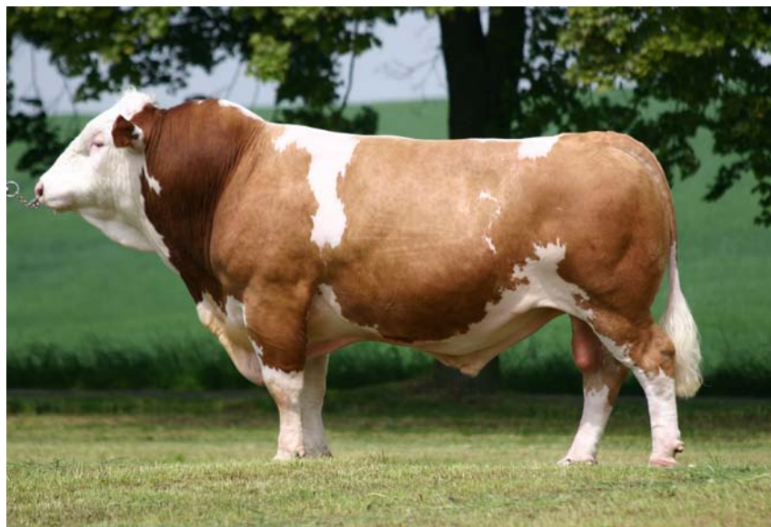
Býk HG-213 (foto Chovatelské družstvo Impuls, družstvo).

PH plemenná kniha holštýnského skotu celkem – results of cows recorded in herdbook of Holstein Cattle (total)