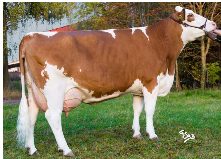
Dcera Gropa BO 858, CZ 373773961, chovatel: Agro Zvole.

Český strakatý skot – Czech Spotted Cattle (Czech Fleckvieh) České strakaté 88 % a více, 75-87 %, 51-74 % - the share of blood of Czech Spotted Cattle A více – more than Z toho horská a podhor. oblast – highlands Nížinná oblast – lowlands Holštýnský skot H 100 % – Holstein (without crossbreeds) H 100% Kříženky s podílem 88 %, 75-87 %, 51-74 % - crossbreeds with the share of Holstein blood Červený holštýnský skot – RED Holstein 100 % Kříženky s podílem 88 %, 75-87 %, 51-74 % - crossbreeds with the share of RED Holstein blood Montbeliarde - Montbeliarde Ayrshire - Ayrshire Jersey – Jersey Braunvieh – Braunvieh Normanské 75% a více - Normande Ostatní plemena a kříženky – other breeds and crossbreeds Celkem - total