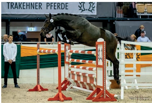
Limao (Ostinato xx), foto Jutta Bauernschmitt