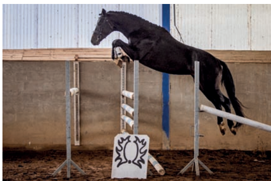
Ibrox Park