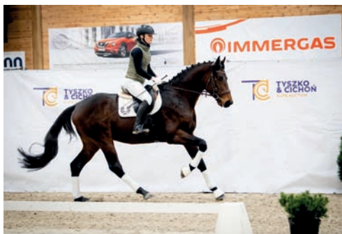
Vítěz šampionátu ALL NIGHT (Asagao xx – Alana po Agar)

Po testu mladých klisen proběhl ještě šampionát, kterého se zúčastnily další 4 klisny, 2 dcery Rakoczyho (Sixtus), jedna dcera litevského Emise a ještě jedna dcera místního