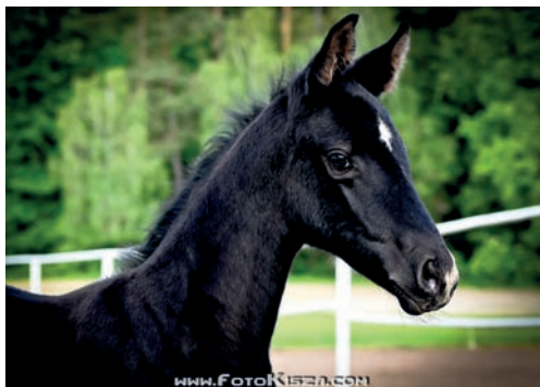
Klisnička Sabrina (Quintar – Sophie po Quinten), foto Zenon Kiszka

V Berlíně (Gestüt Elchniederung) působí AKTIS (Aktiv), na této stanici působil do konce roku 2020 i PAGUR