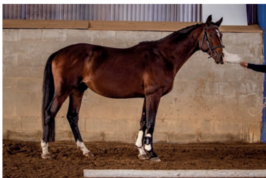
Top Gun (Schenkendorf – Evita Peroni po Peron)

telka rodiny Chunchuzka je pravou sestrou hřebce století Chokeye, matka Bura byla vítězkou finále KMK 6tiletých v sedle s olympionikem Jiřím Pecháčkem. Charisma sama dosáhla úctyhodné výkonnosti ST** (140 cm) ve skákání a Svatý Jiří (ST) v drezuře. První hříbě porodila až ve svých 20ti letech !! A právě tato její dcera CHIARA již letos úspěšně absolvovala zkoušky 3letých klisen ve Frenštátě