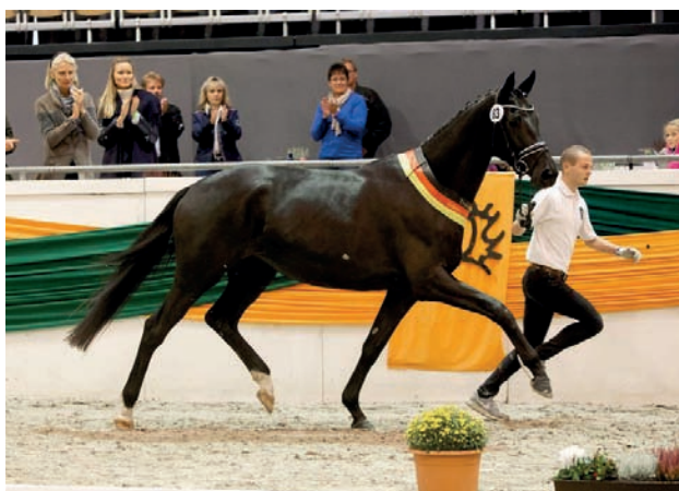
Premiovaná klisna Helene (Helium)