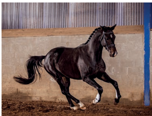
Plemeník Ibrox Park (Hirtentanz – Iduna V po Velasquez)