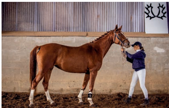
Prostota RVP (Prökelwitz – Parika po Lateran)

hříbě čeká tato odchovankyně Mirky Mácové a Oldřicha Máci po hřebci IBROX PARK. V příštích letech uvažujeme o přípuštění Top Gunem, vznikla by tak zajímavá příbuzenská plemenitba na Topkije.