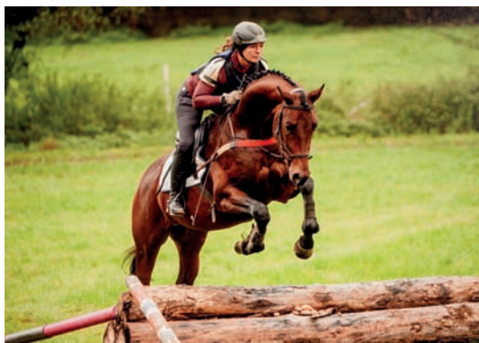
Cornut (Cheops – Corinthe po Inster Graditz)