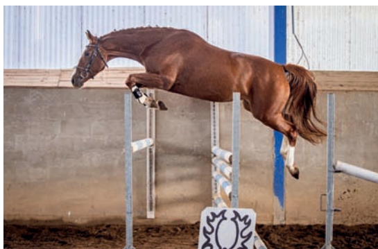
Prostota RVP

S trochou nostalgie byla předvedena vranka TRIANA (Topas - 23 – Toleda po Quoniam VIII). 24 let stará někdejší vítězka KMK čtyřletých dala již několik výborných hříbat do stupně ST** (140 cm) a bude jí věnován samostatný