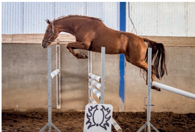
Kasia (Grand – Kasiopea po Landor S)