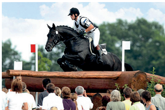
Grafenstolz (Polarion – Gipsy Lady po Camelot)

Bezesporu tím největším je 1. místo plemeníka GRAFENSTOLZe (Polarion – Gipsy Lady po Camelot ) v žebříčku WBFSh ve všestrannosti ( jako otec military koní). V sedle s olympionikem Michaellem Jungem se jako 6ti letý kvalifikoval do všech kategorií Bundesšampionátu (!) a ve všestrannosti zvítězil. V téže roce se stal i mistrem světa mladých koní ve všestrannosti (Le Lion d' Angers – Francie).