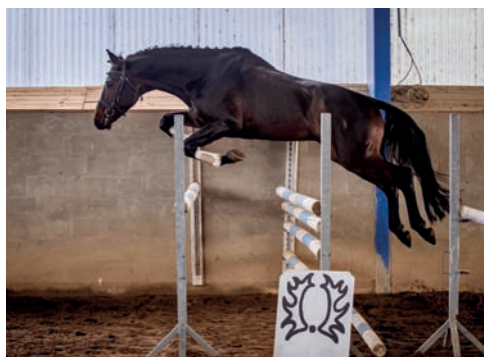
Atraktiv (Aktiv – Sanditten po Lowelas)