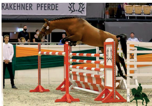
Ostewunder (Pagur ox)

Hřebcem roku se v sezoně 2020 stal drezurní HIBISKUS (Latimer – Hohenstein – Kostolany). Impozantní vraník stojí v Hauptgestüt Schwaiganger – Bayern (jezdkyňě Nicole Raili). Jeho potomstvo již soutěží v těžkých drezurách.