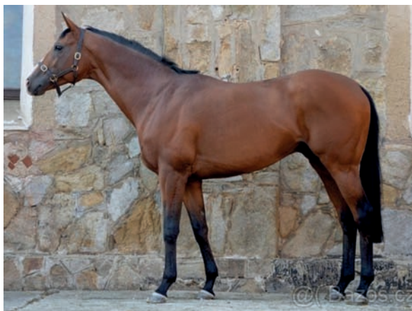
Glorioso xx

Otec AREION je mnohonásobným šampion - plemník Německa v letech 2004, 10, 12, 13, 15 a 17. Ze 16ti startů vytěžil 5 vítězství a 4 umístění a startoval převážně v Grupových a Listed dostizích nejvyšší úrovně. Zvítězil i v dostihu Gr. II. Je otcem 22 Grupových vítězů. Na dotacích získal 575 tis DM.