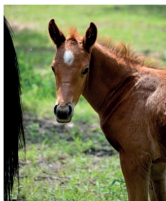
Hřebeček Odin