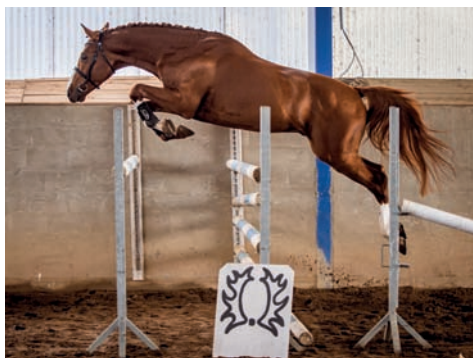
Sargoni Son LH (Sargoni – Plazma po Zakon xx)

vidění nejdříve koně ve skákání ve volnosti. Výběru 2letých se zúčastnil hřebec SCHAMPUS (Schralling – Channele po Quintet). Schampus je v odpovídajícím růstovém standardu, je ale narozený až 28. 10. 2018 a tak působí ještě příliš hříběcím dojmem. Během skokového testu projevil velký charakter, psychickou vyrovnanost a dobré pohybové a skokové schopnosti. Za charakter získal dokonce známku 9 od