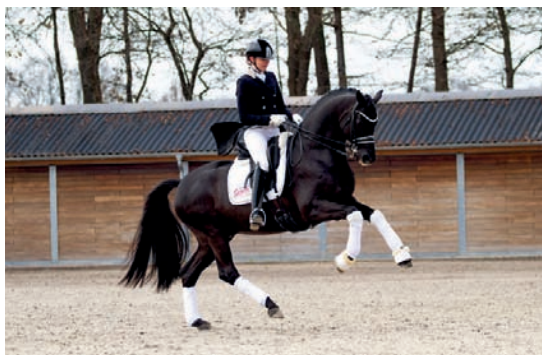
Millenium (Easy Game – Merle po Ravel)

Liniově patří všichni tito úspěšní účastníci k linii GRIBALDI (Kostolany). Gribaldi byl Koněm roku v Německu 2008, Kostolany v roce 2009. Tento elitní původ v sobě nese i současná vedoucí drezurního Světového poháru klišna DALERA TSF. Tato dnes nejslavnější trakénská linie začala u plnokrevného hřebce PASTEUR xx, pokračovatele našla v jeho synech Michelangelo, Marlon a hlavně MAHAGONI. Do USA se dostala přes jeho syny Mahon, Inspekteur, Royal Ransom, Peron, Donaufürst a zejména ENRICO CARUSO, který je právě otcem famozního KOSTOLANYho.