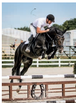
Ibrox Park - MVDr. Vít Holý

Matka Ibrox Parka IDUNA V je dcerou výborného skokana VELASQUEZ po Hřebci roku 95 MACKENSEN. Původ doplňuje angloarabský KALLISTOS.