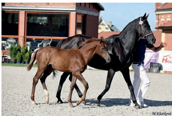
Hřebeček Odin (Obvod – Amálka xx po Glowing xx), foto Martina Kůstková