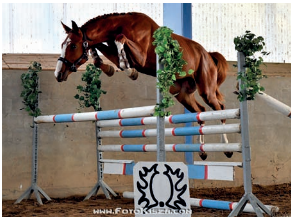
Sargoni Son LH