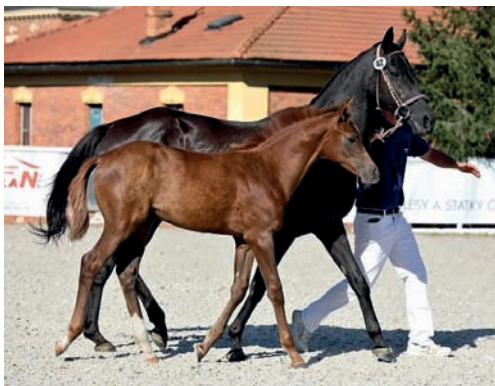
Hřebeček Odin (Obvod – Amálka xx po Glowing xx)

K využití jsou v nabídce i zmražené dávky velmi zajímavých plemeníků, jejich seznam je v závěru ročenky. Další možnosti získání dávek nejlépe přes MVDr. Víta Holého v Hřebčíně Amona Bolatice.