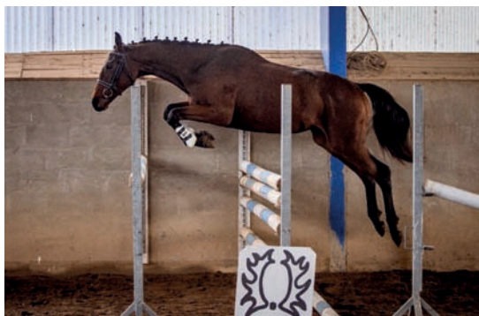
Schampus (Schralling – Channele po Quintet)

Sedmý ročník přehlídky trakénů a zároveň testu hřebců se uskutečnilo opět v areálu Hřebčína Amona v Bolaticích – Borové. Předvedeno bylo celkem 24 koní, vzhledem k epidemiologické situaci bohužel bez diváků. I tak to byla zajímavá kolekce, největší zajímavostí byl v testu zařazený hřebec SARGONI SON LH a pak již 4letí importovaní plemenci TOP GUN a IBROX PARK. Jako už tradičně byli k