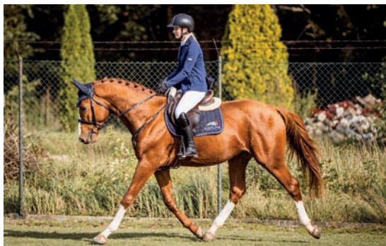
Sargoni Son LH

nosti hodnocen známku 8.25, na parkuru známku 7.5. Celkově absolvoval test s hodnocením 7.7 bodu a bude dále působit v plemenitbě, k dispozici bude na stanici u majitele a v inseminaci zmrazeným spermatem.