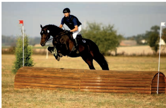
Kros (Ajbek – Sword xx)