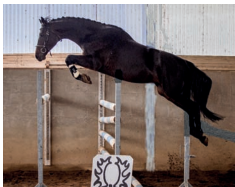
Aktien (Aktiv – Schlodien II po Königspark xx)

Po Quintar je i letošní dcera další předváděné plemenné klisny