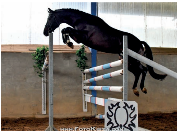
Ibrox Park

Matka Ibrox Parka IDUNA V je dcerou výborného skokana VELASQUEZ po Hřebci roku 95 MACKENSEN. Původ doplňuje angloarabský KALLISTOS.