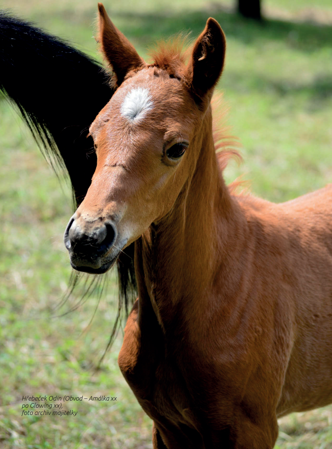
Hřebeček Odin (Obvod – Amálka xx po Glowing xx)