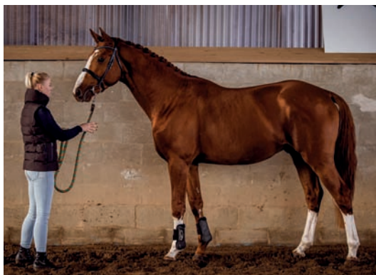
Plemeník Sargoni Son LH (Sargoni – Plazma po Zakon xx)