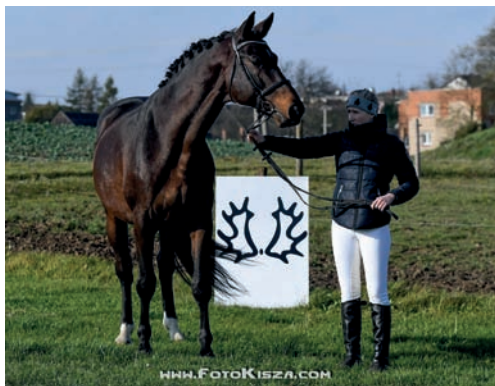
Plemeník Quintar (Quintet – Stella po Saint Tropez)

Ve sportovních soutěžích jsme registrovali 18 koní napříč všemi jezdeckými disciplinami.