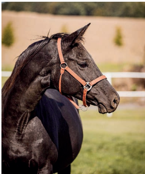
Plemenná klisna Chelsea (Aktiv – Chaira po Cherson)