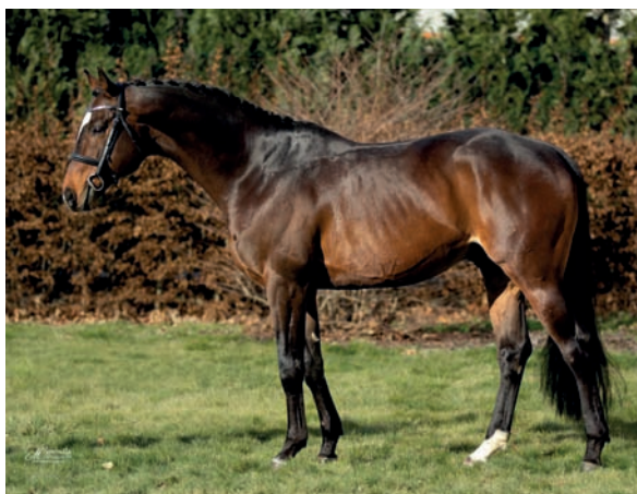
Erste (Esteban xx - Heling)

Prabába TERTIA III je premiovaná klisna a je matkou plemeníka Timber (skok 130).