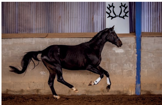
Ibrox Park (Hirtentanz – Iduna V po Velasquez)

Ve skoku ve volnosti zaujaly hlavně čtyřleté klisny, PROSTOTA RVP (Prökelwitz – Parika po Ikar) a KASIA.