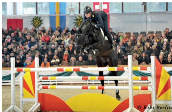
Abendtanz (Hirtentanz – Kostolany)

Nejúspěšnějším současným producentem skokových tračků je hřebec ABENDTANZ (Hirtentanz – Kostolany).