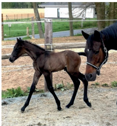
Hřebeček Scooby Doo (Special Memories – Sanditten po Lowelas)