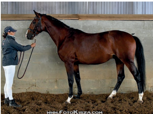
Top Gun

otek SCHENKENDORF byl testován až do stupně T ve skákání (GB), v testu 3letých hřebců byl hodnocen mezi nejlepšími skokany (Prussendorf ). Jeho otec TOPKIJ je vítězem OH Moskva v družstvech a umístil se na 4. místě v jednotlivcích. Pochází z linie Ostrjak – Ossian – Pilger, v kombinaci s linií Pomeranec (otec olympijského Almox Printse). Schenkendorfova matka Schlodien II je po plnokrevném Königspark a dala celkem 5 plemeniků a potomstvo výkonné až do st. T. V Hřebčíně Amona působí její syn AKTIEN (Aktiv).