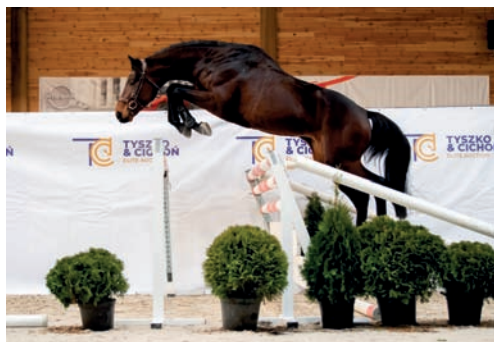
Vítěz šampionátu ALL NIGHT

Na 2. místě skončila rovněž dcera Artemora DEJZI (z Dumy po Skaleň