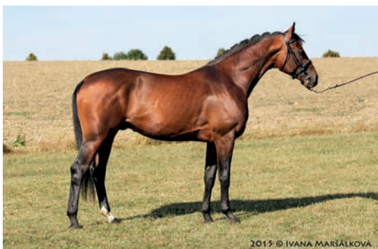
Otec Prostoty RVP, plemeník Prökelwitz (Chokkej – Pillau po Apogej), foto Ivana Maršálková