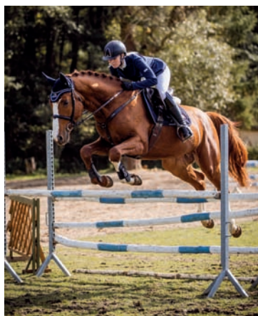
Sargoni Son LH, foto Vendula Molinová

SARGONI SON LH (Sargoni – Plazma po Zakon xx) je již licencovaný plemeník po velmi zdařilém předvedení na 2letých výběrech. Letos byl ve skoku ve vol-