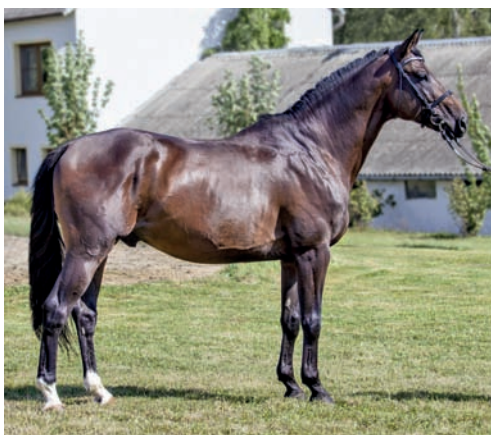
Quintar

Quintarova matka Stella je dcerou premiováného hřebce Saint Tropez, syna vítěze německého körungungu Tolstoie. Tolstoi je synem legendy trak. chovu Kostolanyho (děd hřebce století Totilase). Původ na straně matky pak oživují angloarabský Cacir a plnokrevný Bandoliero xx.