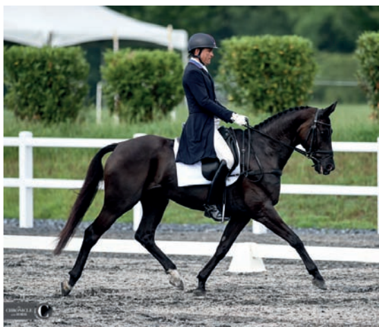
Tsetserleg TSF – Boyd Martin