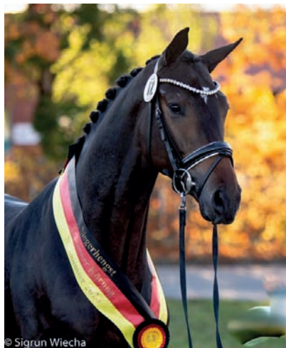
Rezervní vítěz výběrů Tanzkönig (Fairmont Hill - Herbstkönig)

Už tradičně se v původech hřebců nejčastěji objevoval legendární Gribaldi. Jeho syn Easy Game zde měl 1 syna, slavný Millennium po Easy Game dva potomky a pak přišla velká skupina hřebců po Millenniových synech (Freiherr von Stein, His Moment, Ivanhoe, Helium). Celkem k linii Gribaldiho patřilo 18 předváděných potencialních plemeníků!