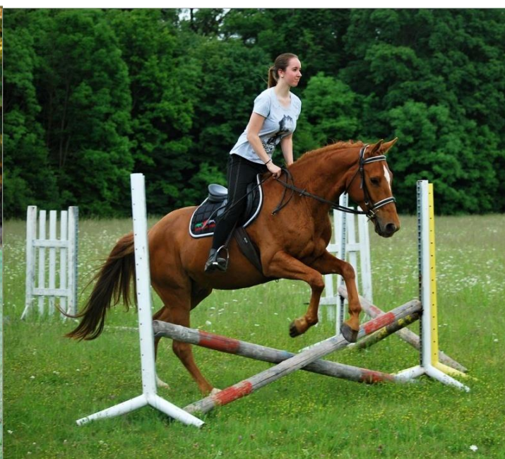
Začínáme s Harýskem sportovat