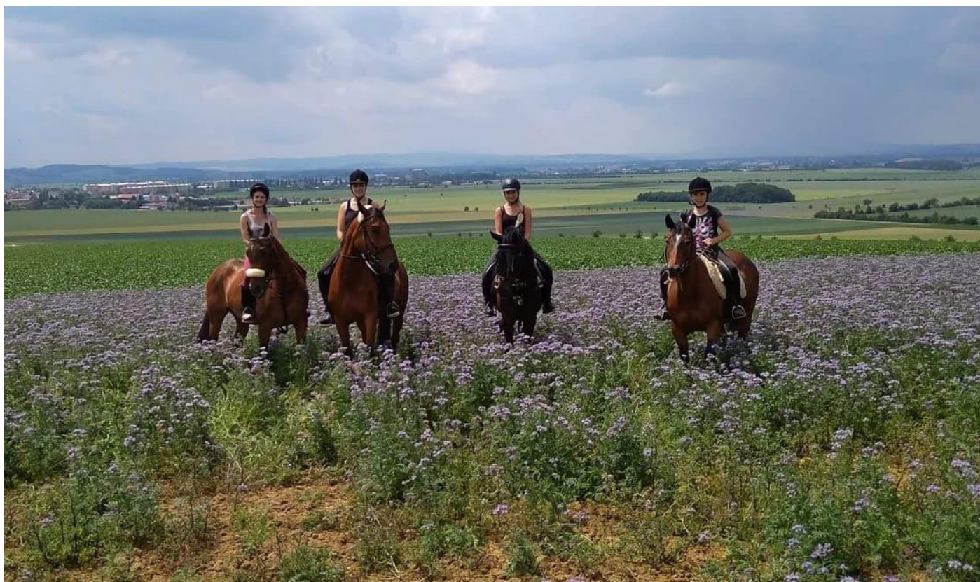
Letní vyjížďka, zleva Korina a Grand