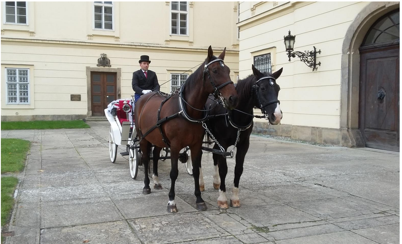
Svatební kočár u zámku v Napajedlích (náruční 81/31 Axina)