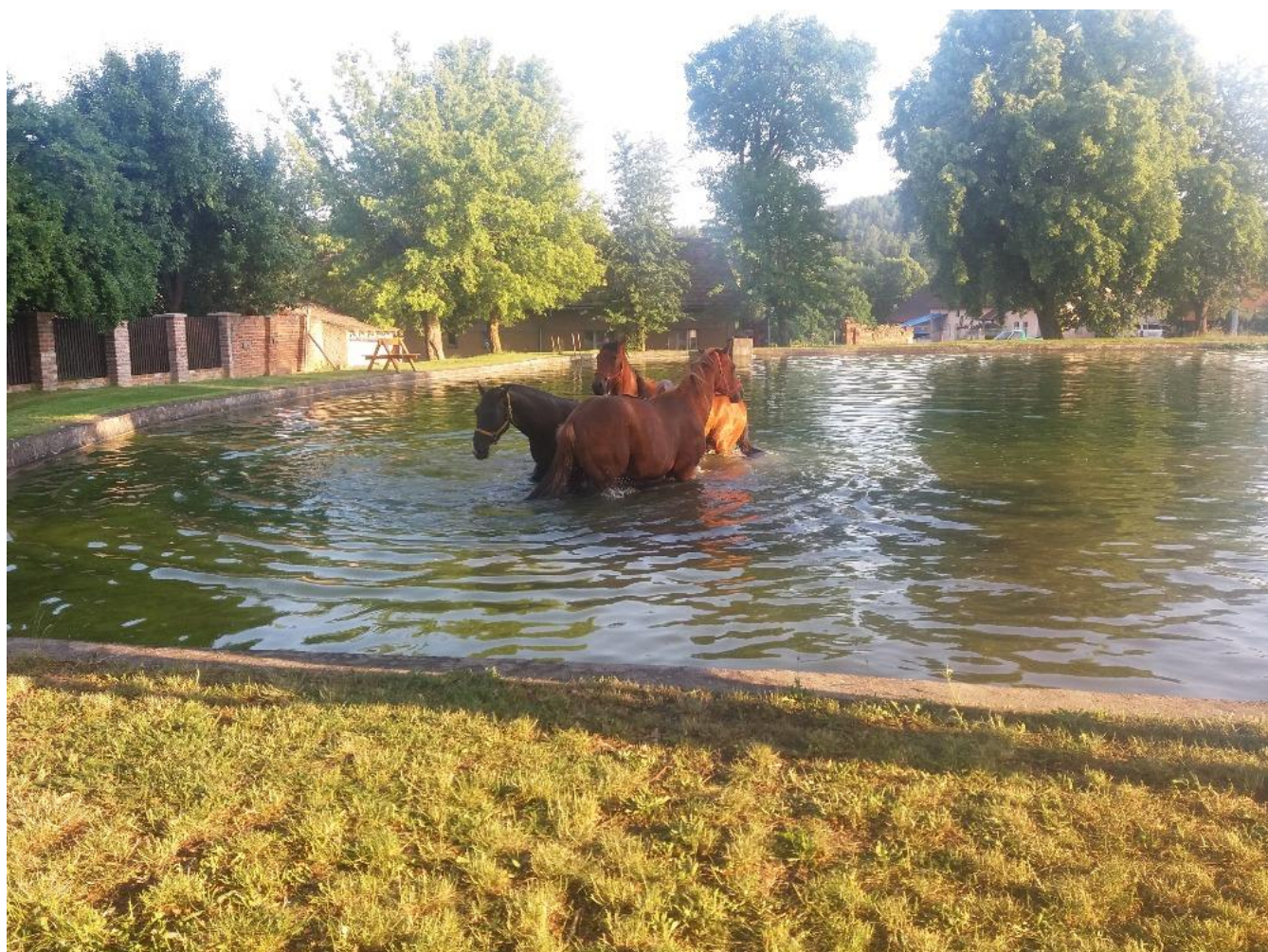
Furioso VIII MT – 1/Forhamy a 52/262 Fazola a 52/123 Sáva Zasloužený odpočinek po práci, no není to „žůžo labůžo“