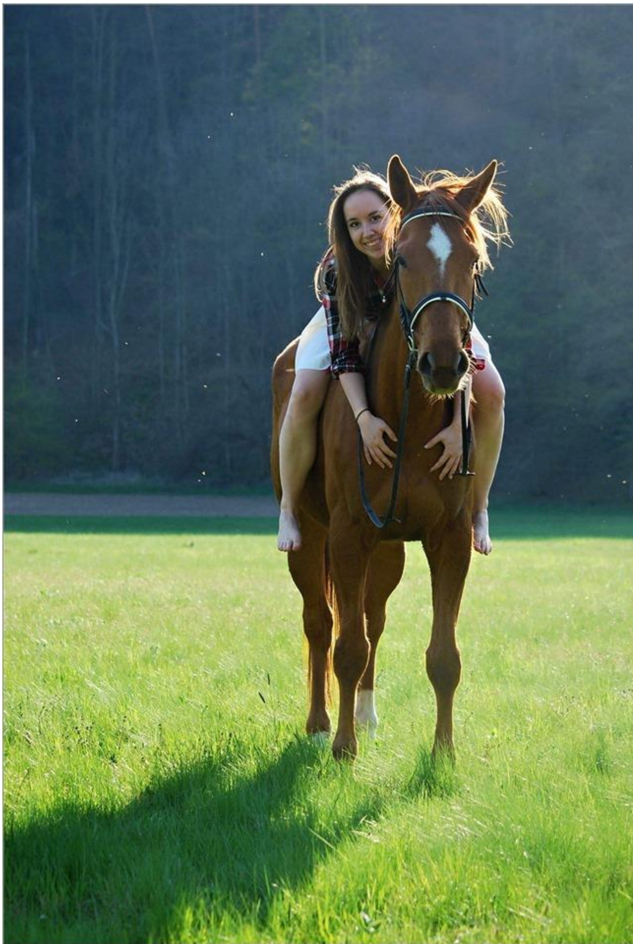
Miláček z nejmilejších