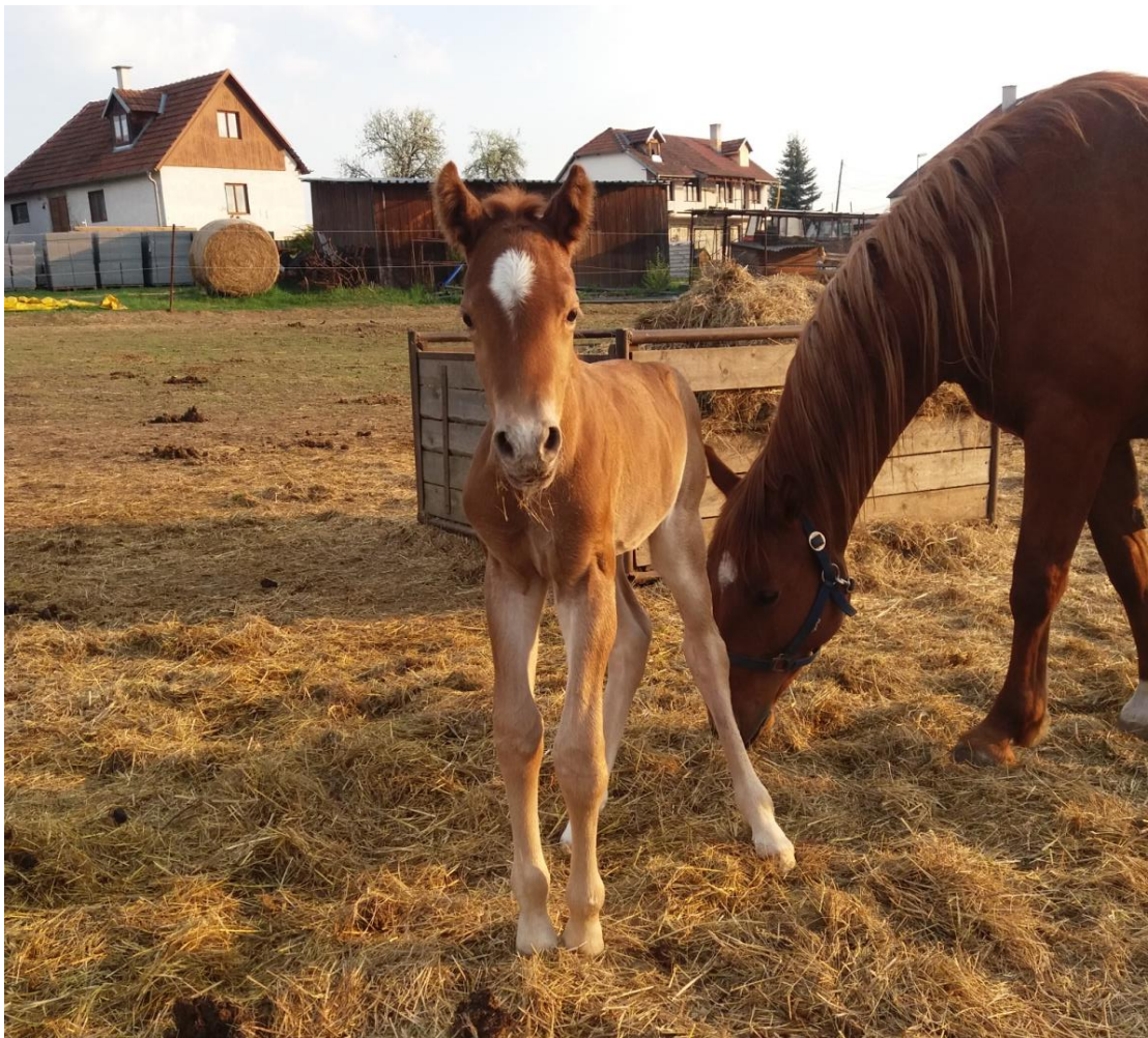
52/123 s klisničkou Przedswit XIV MT-1/Surry