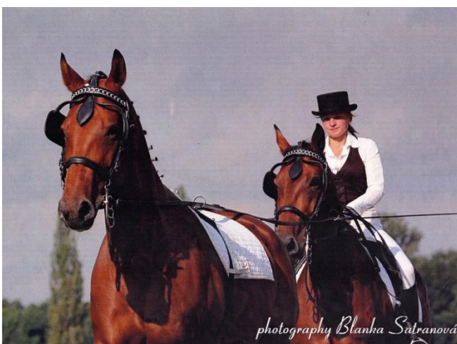
photography Blanka Šatranová