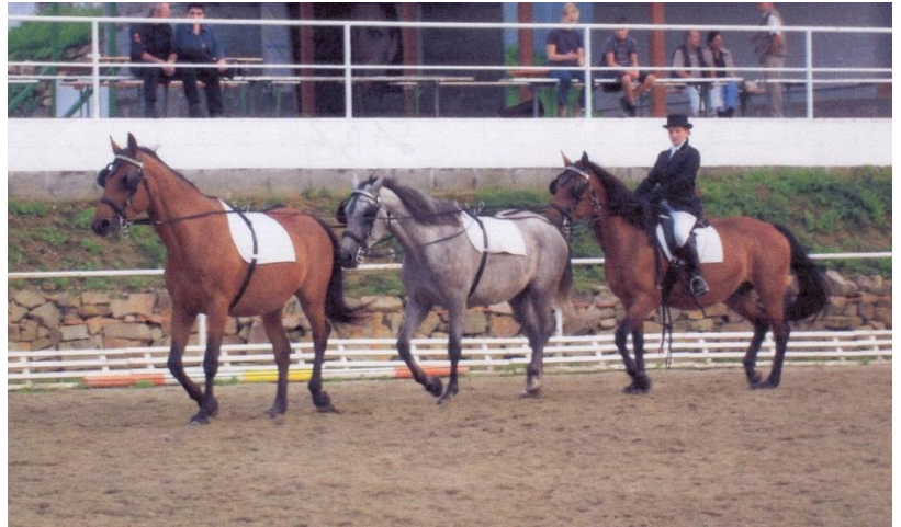
Sabéna, Sambery a Sába

Sábu využíváme hlavně na Hipoterapii a na základní výcvik dětí, se kterými pak složila i ZZVJ.