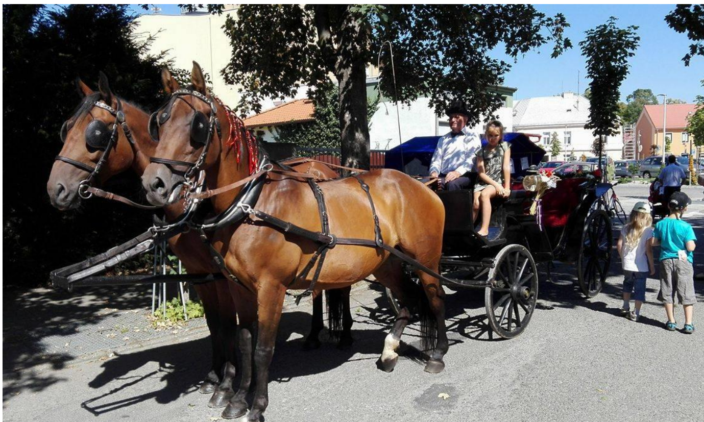
Dožínky v Holešově 81/15 Korina (podsední) a Grand