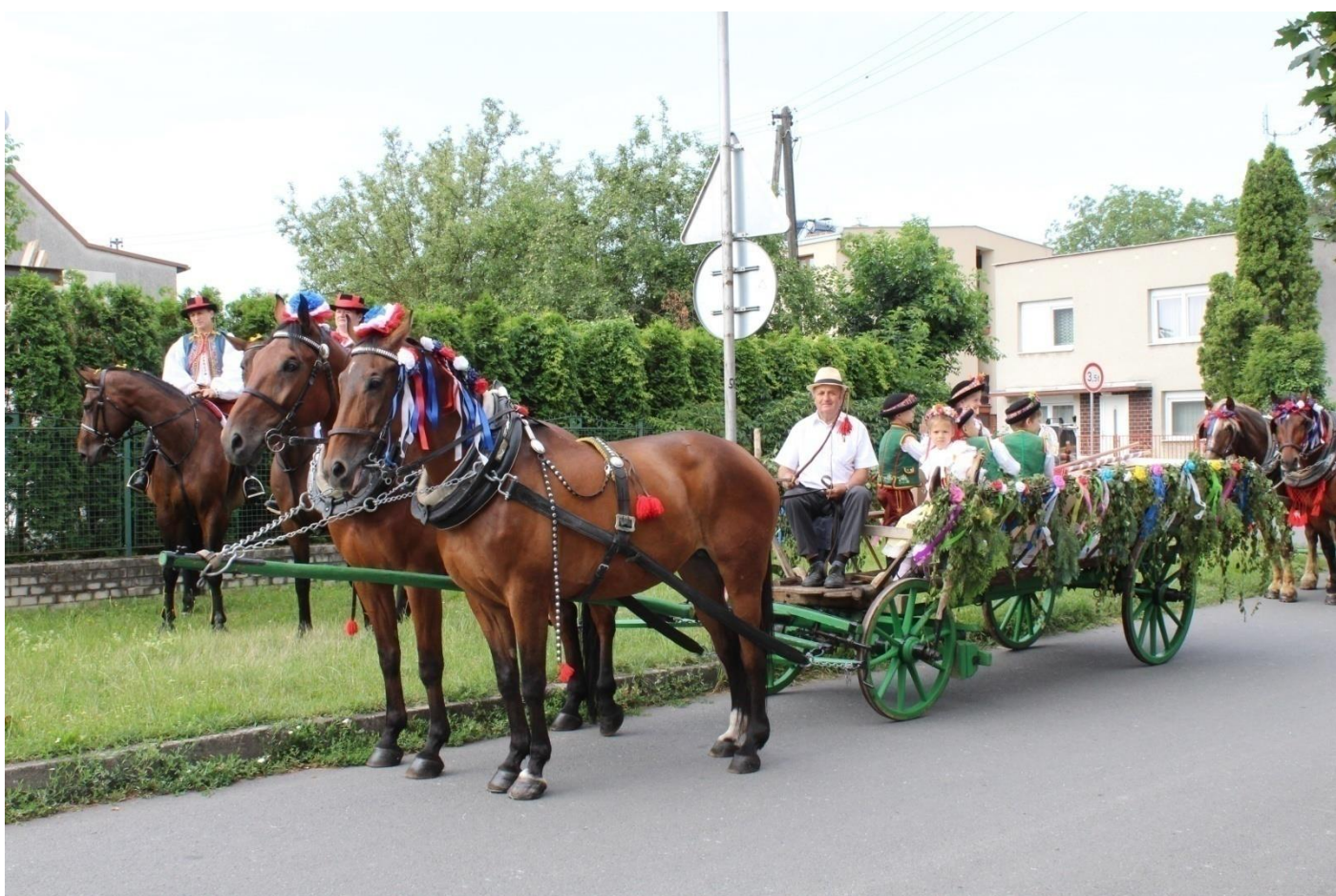
Hanácké právo – Všetuly