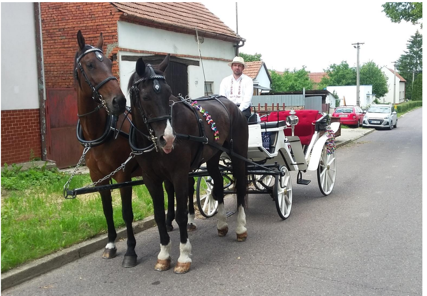
Jízda králů – Vičnov