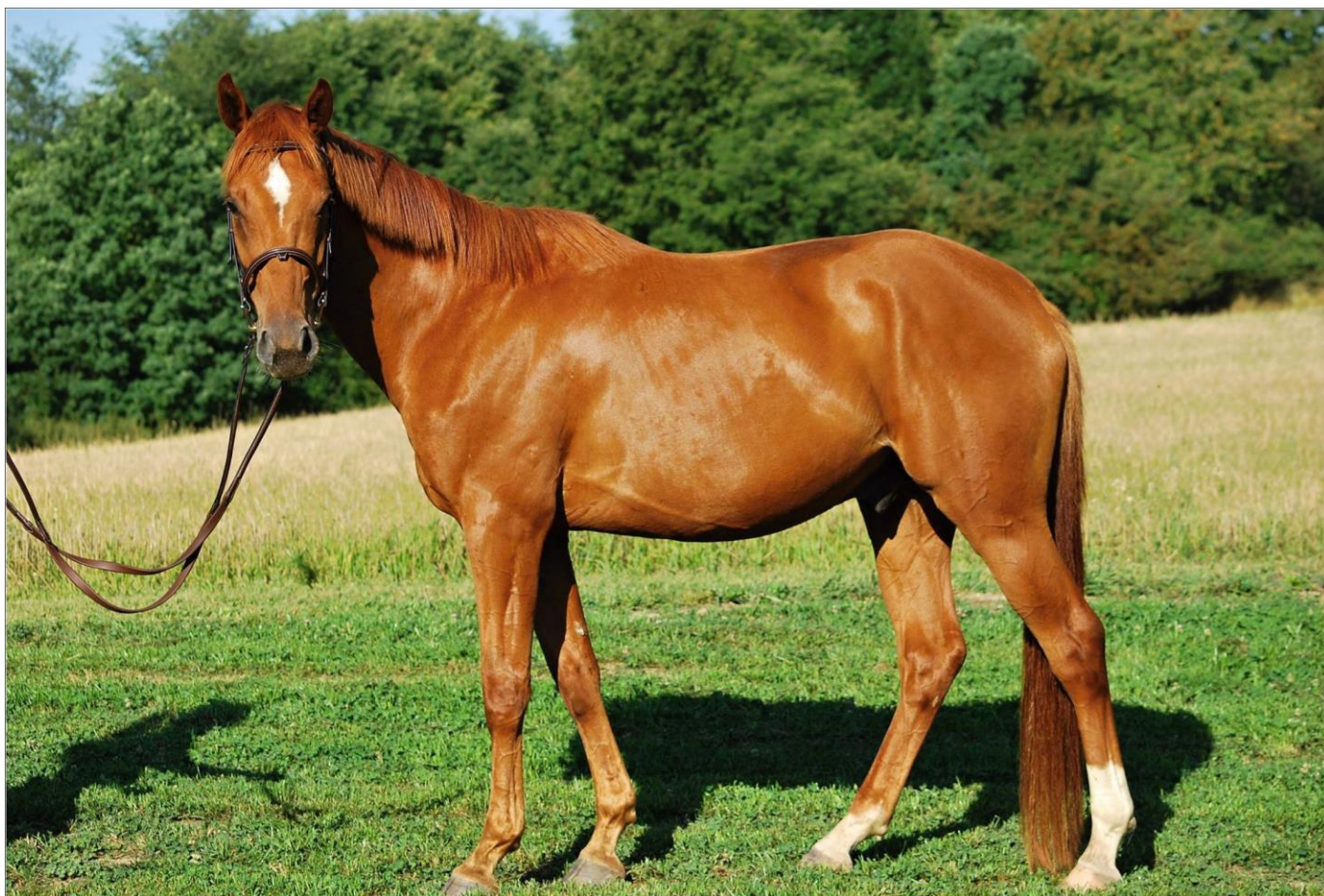
Przedswit V MT-5/Hattori Hanzó

A tak to vypadá, když se rozhodnete koupit si svého prvního vlastního koně.