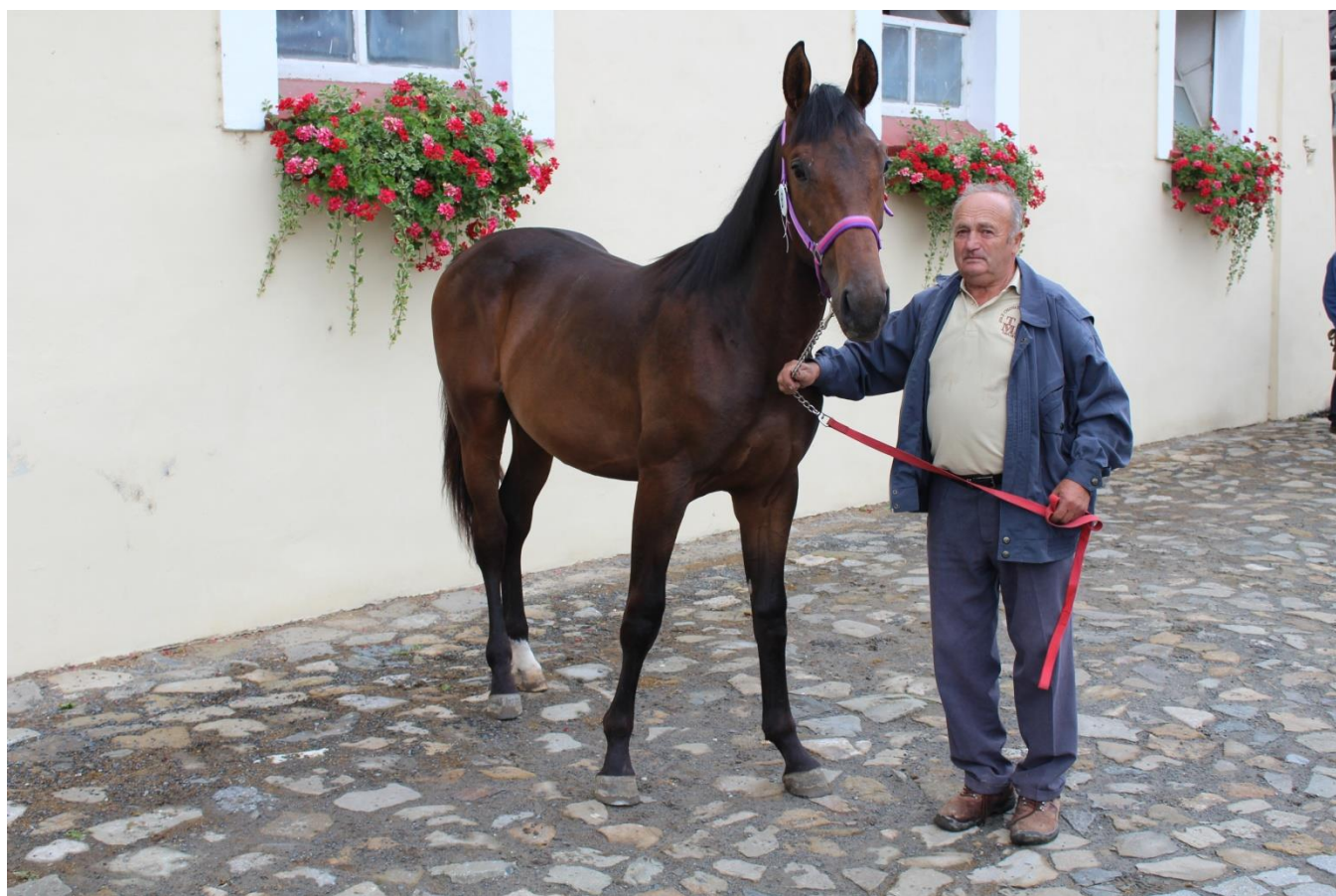
Z výstavy v Tlumačově - Catalin I MT-14/Catalin L