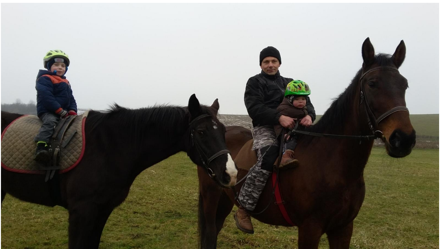
na procházce s dětmi