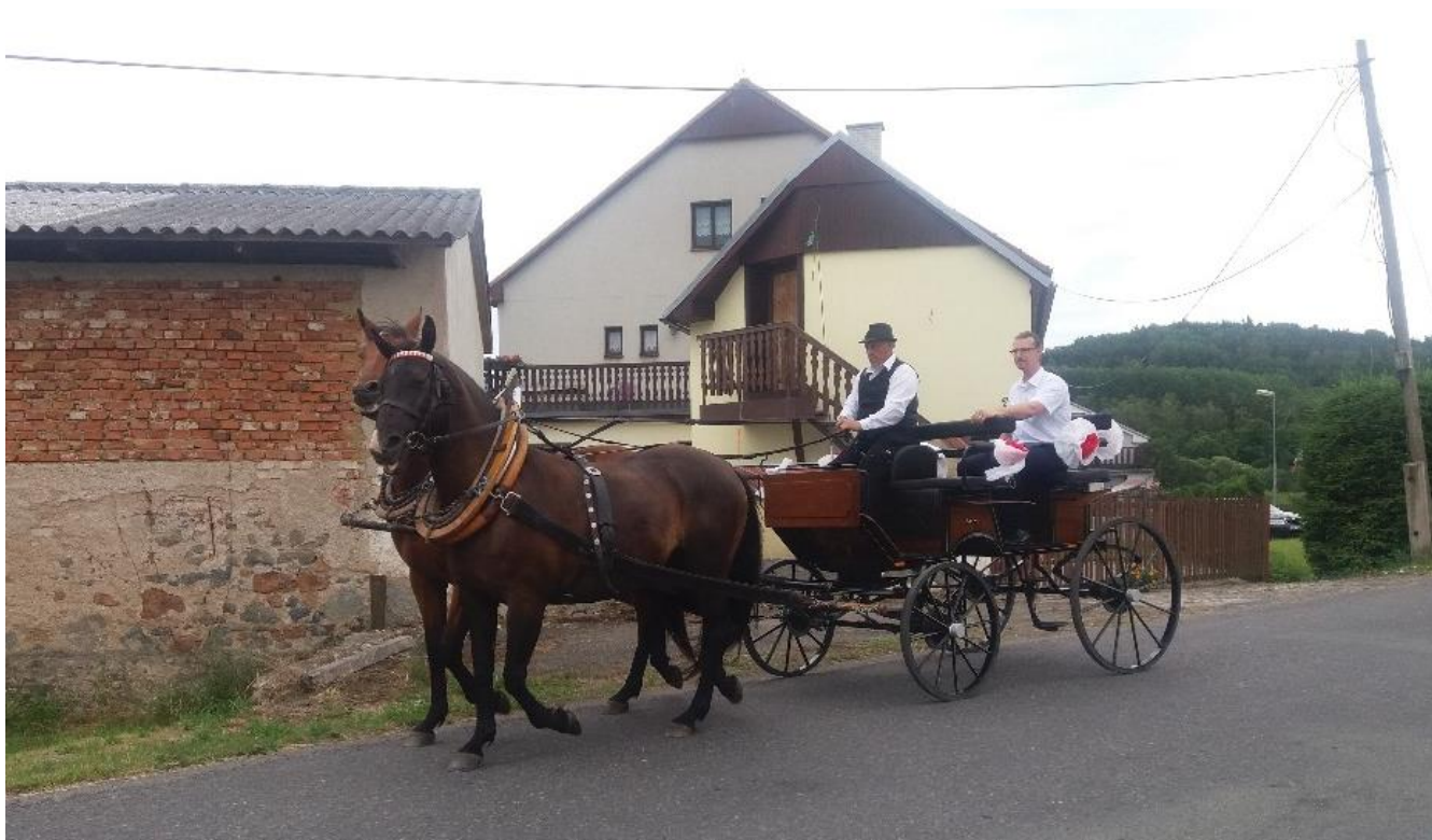
Furioso VIII MT – 1/Forhamy a 52/262 Fazola (podsední)