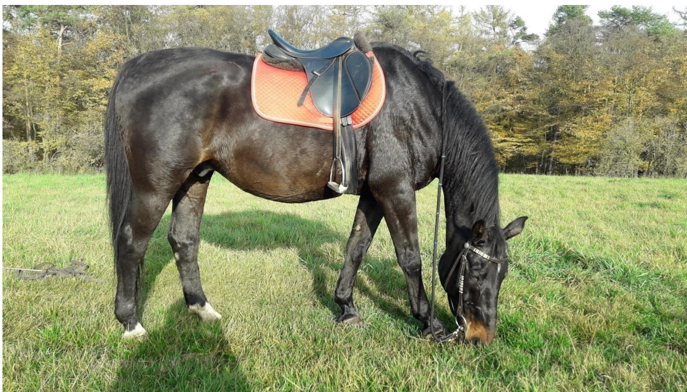
Že by ji stratil?