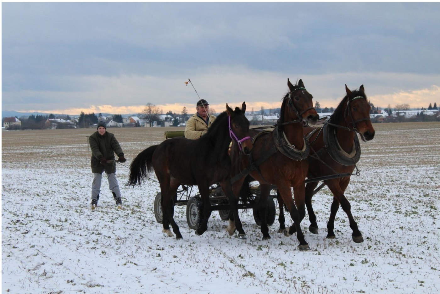
Zimní radovánky – zleva Catalin I MT-14/Catalin L, 81/15 Korina a Grand