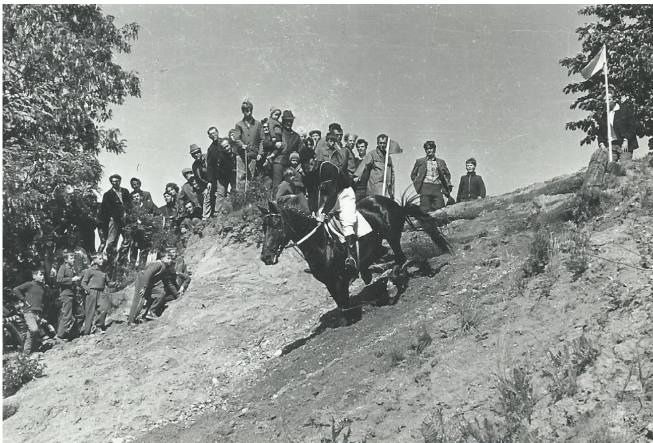
Albertovec – sjezd do pískovny

Něco málo z archivu Jana Binka, když ještě soutěžil ve všestrannosti