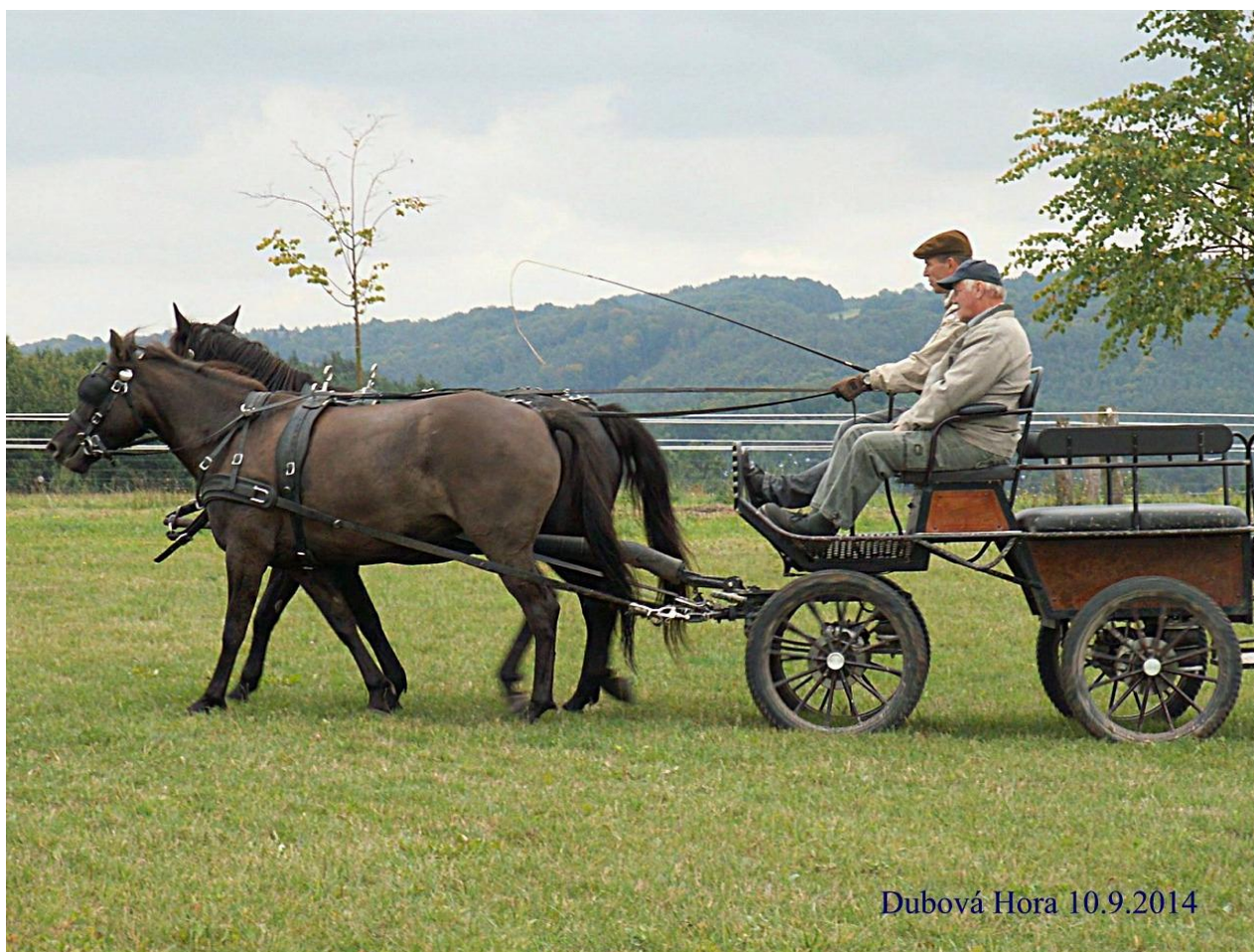
Dubová Hora 10.9.2014

Několik záběrů z výkonnostních zkoušek typu „A“ přináší následující snímky: