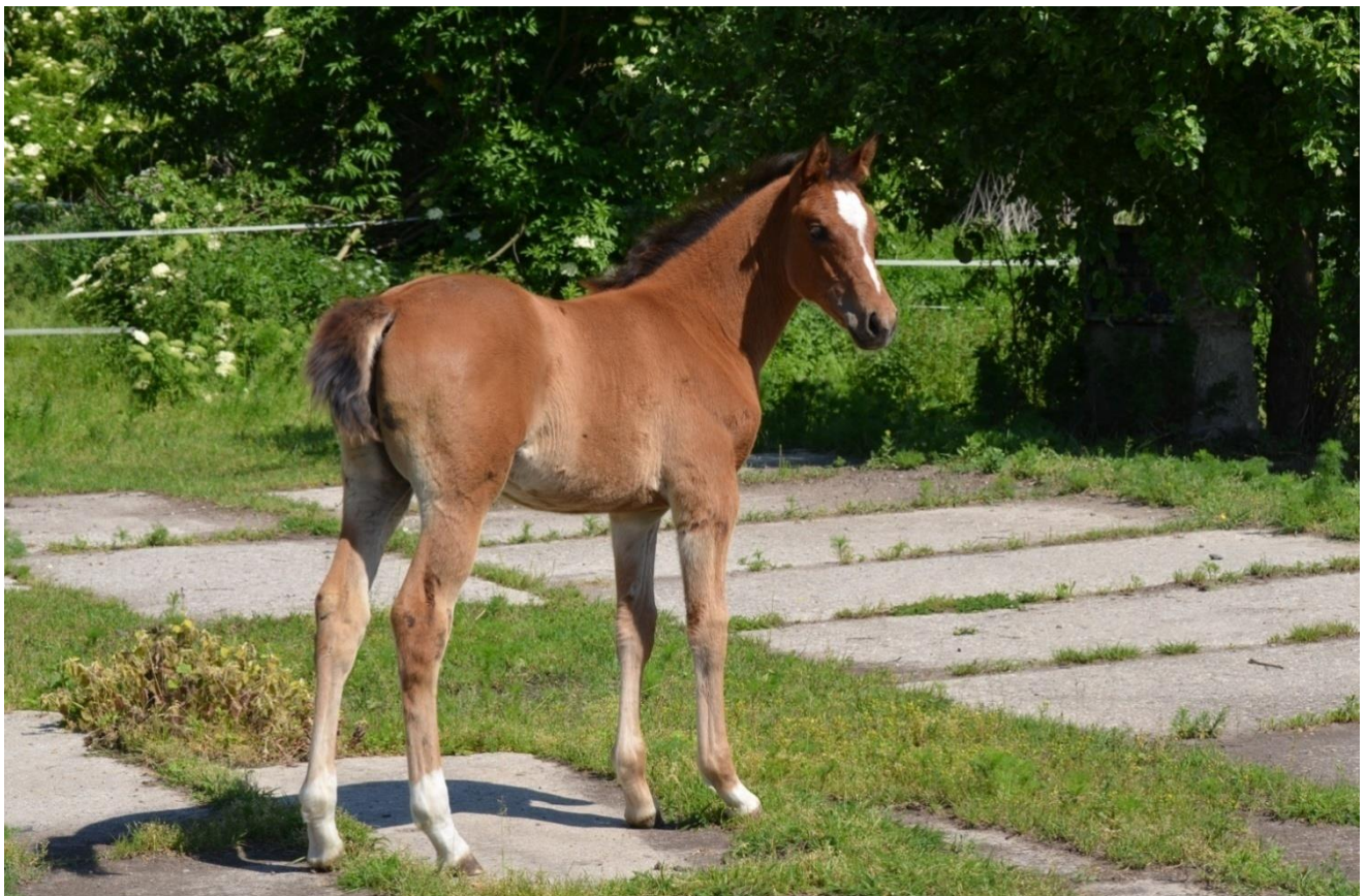
klisnička Sahib I MT – 5/ Rensia