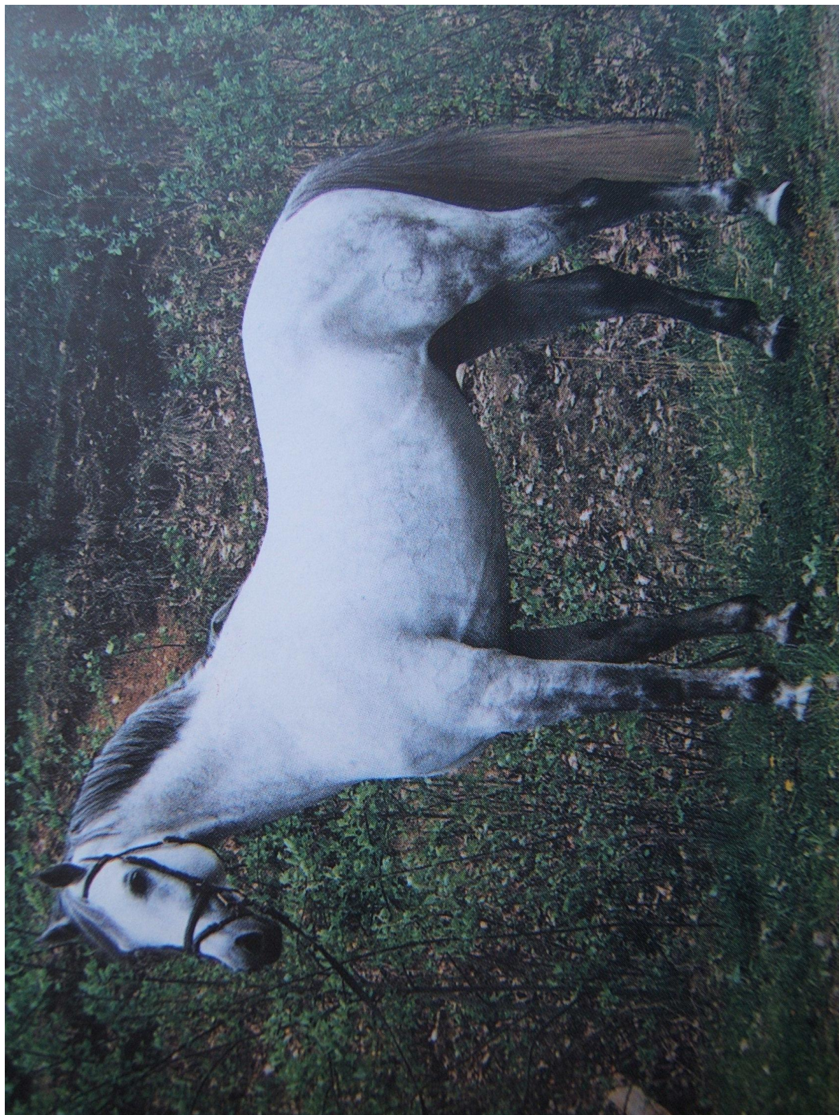
Sahib I MT / 2626 Sahib Kubišta