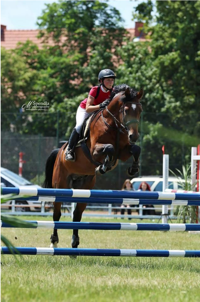
Sahib II MT / Sahib Silver G