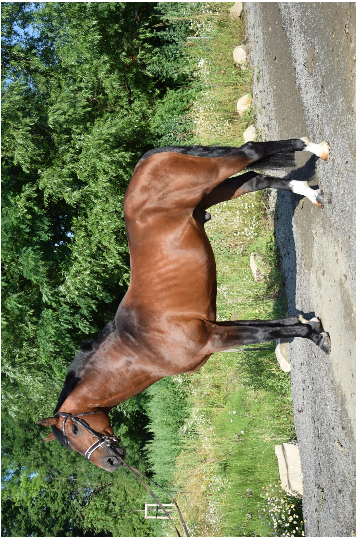
Przedswit XXI MT/2596 Hetik 53/392