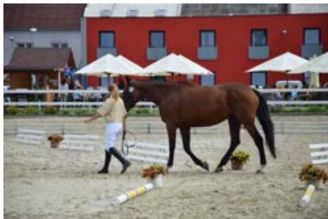
Przedswit IV MT-4/Galie