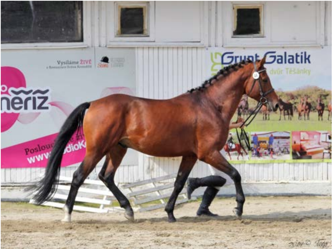
Sahib II MT / Sahib Silver G