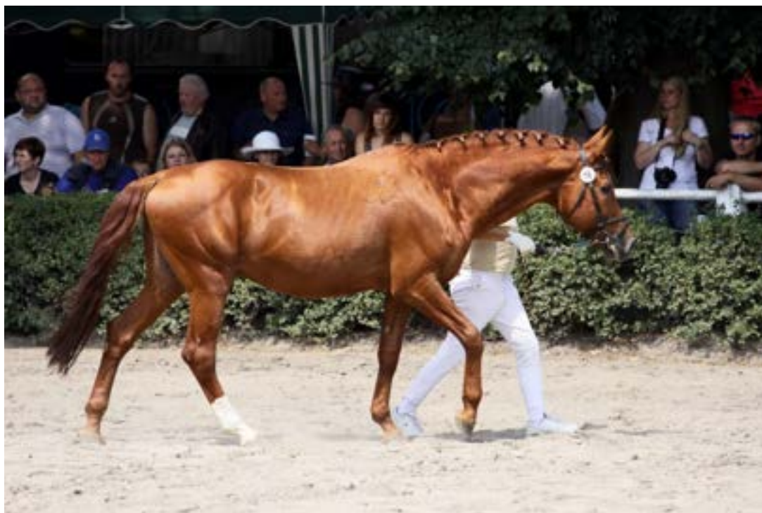
Przedswit V MT / 1485 Hary

Hřebec je typickým představitelem linie Przedswit III - K, elegantní, ušlechtilý, mírně delšího rámce, kulatých tvarů a přiměřeného fundamentu. Potomstvo se jeví ušlechtilé, v typu ryzé linie Przedswitů. V roce 2016 úspěšně absolvoval výkonnostní zkoušky hřebec Przedswit V MT – 1 /Jáchym G s hodnocením 8,19 bodů.