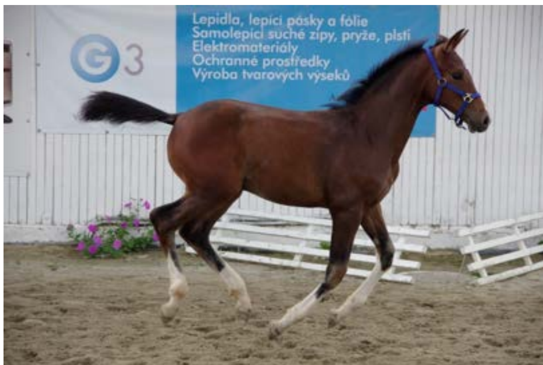
hřebček Przedswit V MT – 3 / Silvio G