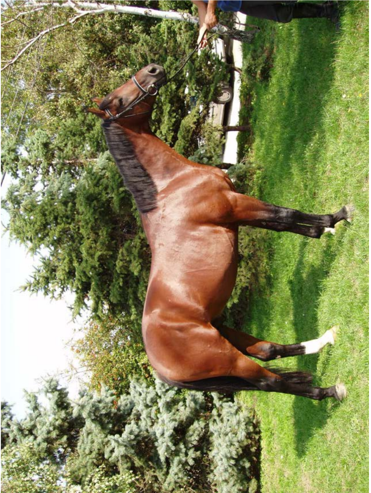
North Star I MT / North Star XIII SK / 1542 North Star X – 7 / Jenisej