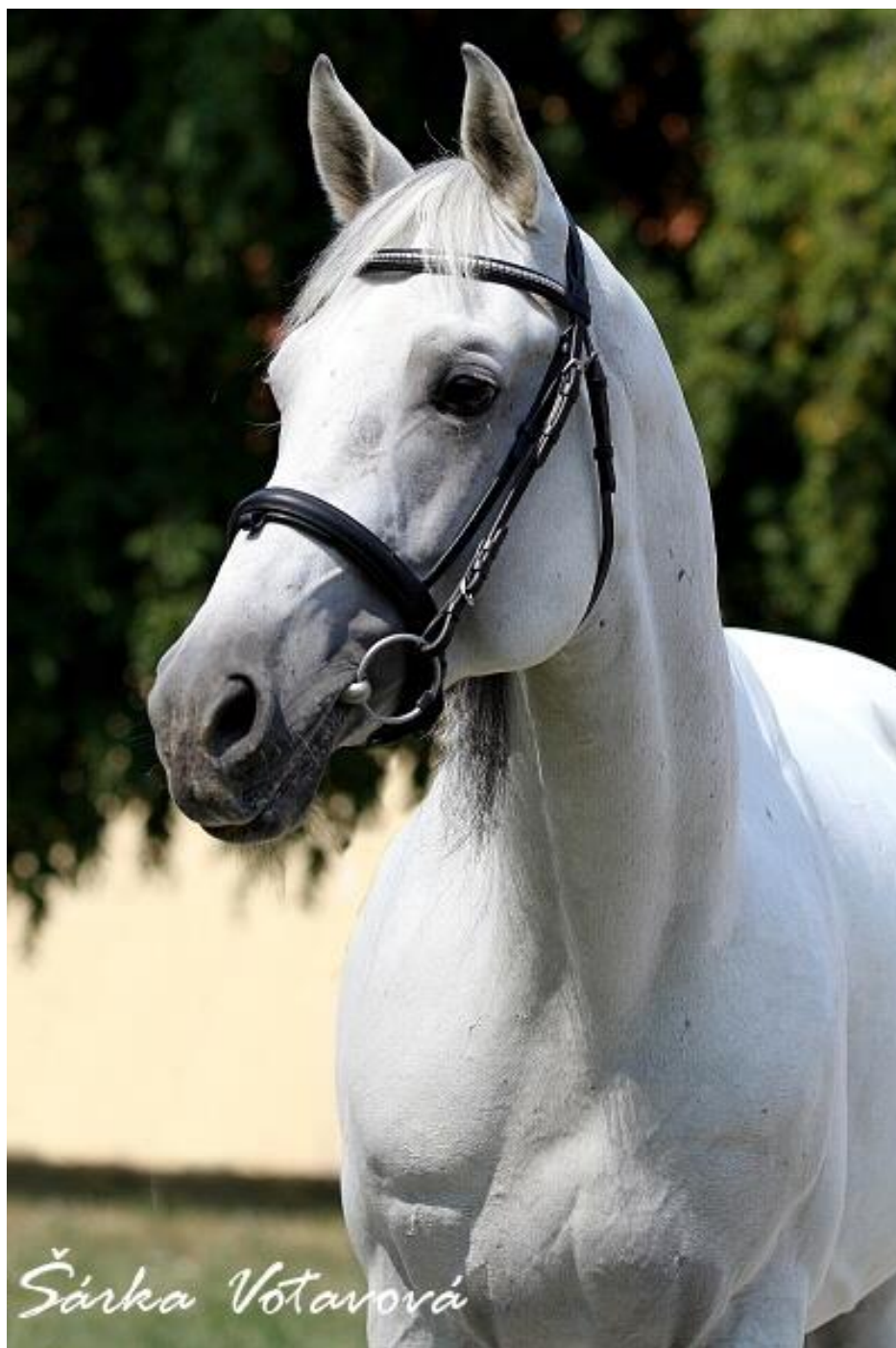
Dahoman I MT / 2943 Dahoman IV – CZ (Tamarix)

Výsledný počet bodů 8,99 jej zařadil do třídy E.