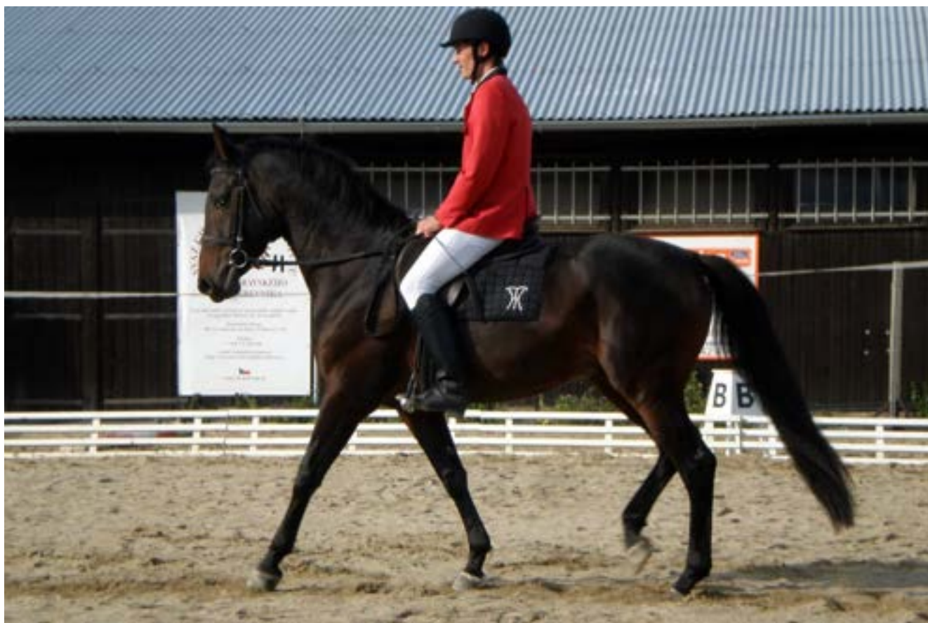
Furioso XII MT / 1897 Furioso R – 4 na výkonnostních zkouškách

Je korektního exteriéru s dobrou horní linií, výraznými hloubkovými a šířkovými rozměry a štíhlejšího fundamentu.