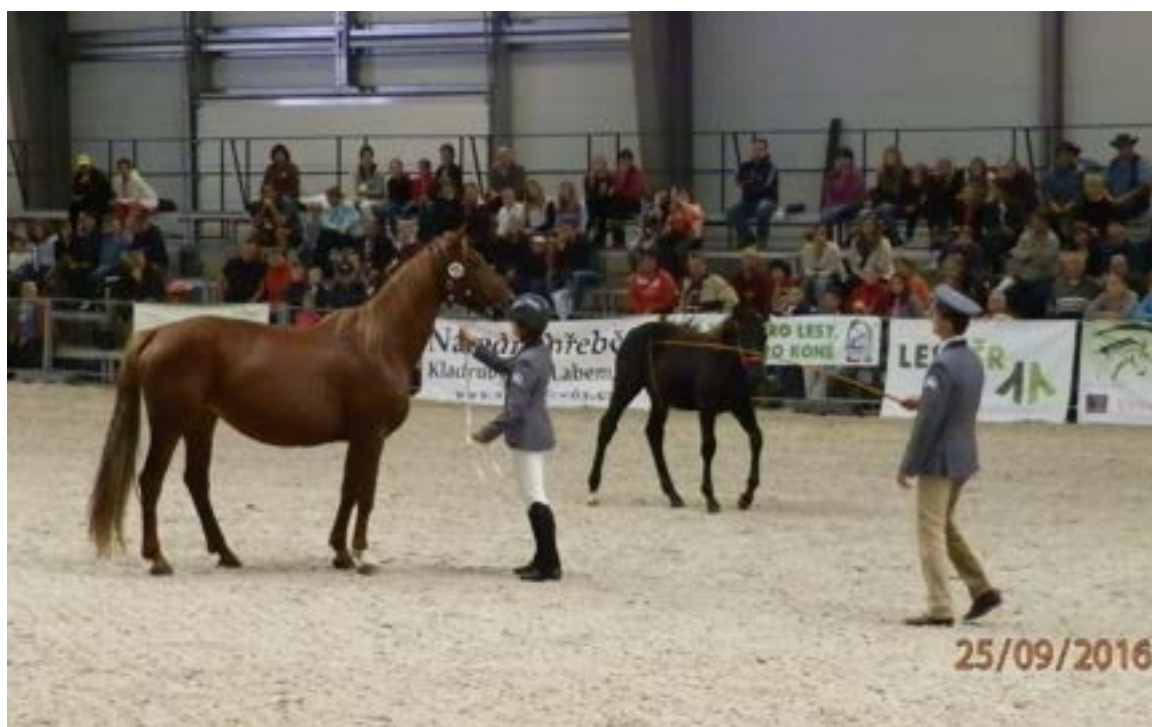
52/123 Sáva s hřebečkem po Catalin I MT