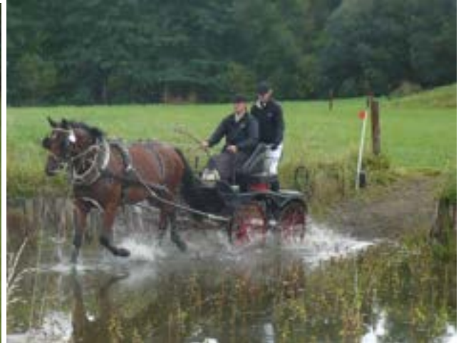
81/154 North Star I MT-5 / Cilie G