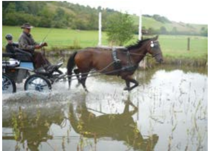
Catalin XII-2 SK/ Catahara