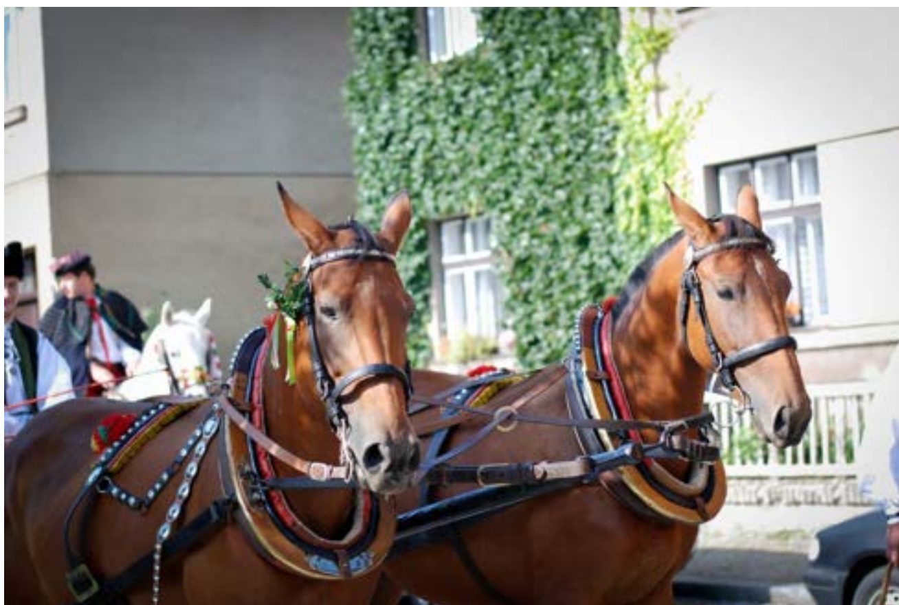
klisny v zápřeži 81/4 Frida II. a 81/193 Furioso VIII MT – 6/Fora