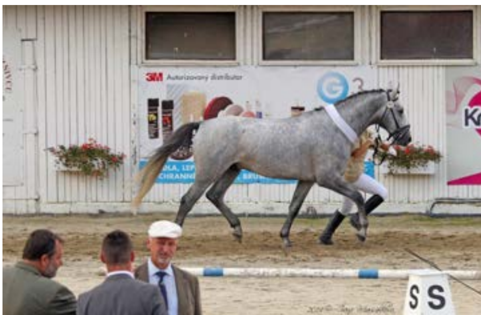
Šampion výstavy MT v Těšánkách Przedswit XVIII MT / 2089 Przedswit II MT - 1 / Pares

Przedswit XVIII MT / Pares, ač bělouš, je představitelem hnědé, mohutné linie Przedswitů, tedy linie Przedswit VIII Pib. 1913. Otec matky Przedswit I MT je představitelem ušlechtilejší linie Przedswitů, to však u Parese zásadní vliv nemá neboť Przedswit Čelech. je rovněž zástupce linie Przedswit VIII a z otcovy strany jsou rovněž zastoupeny geny Przedswita VIII přes Przedswita II K v původu Furiosa XI Mot. v 3x4 generaci. V Paresově původu jsou mohutní předci silně zastoupeni, tedy dá se očekávat, že bude přenášet mohutnost i na své potomstvo. Jedná se o kostnatého hřebce, delšího rámce s hrubší hlavou, delším krkem, dobrou horní linií, korektním fundamentem přitom však dostatečně ušlechtilého. Vyniká prostorným krokem i klusem a kulatým cvalem. Od hříběte se prezentuje přátelskou povahou a velmi dobrým charakterem. V současné době sportuje ve všestrannosti, kde dosáhl výkonnosti „L“. Zúčastnil se na výstavách nejen v České republice ale i v Maďarsku a na Slovensku s velmi dobrým hodnocením, 3x získal titul Šampion výstavy.