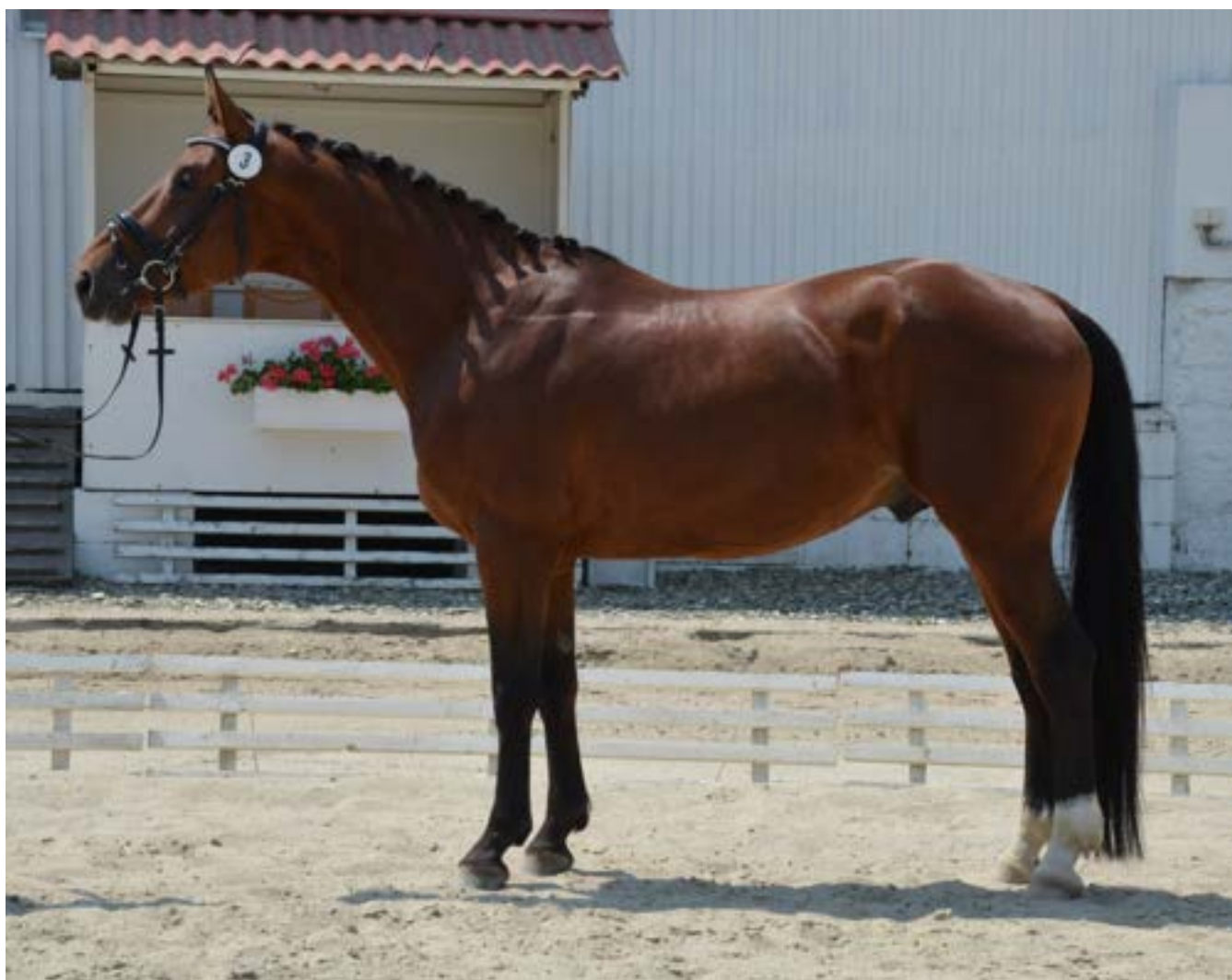
Catalin I MT – 7/Sebastian G

Do PK MT po něm bylo zatím zařazeno 7 dcer a syn Catalin I MT – 7/Sebastian G, který v loňském roce absolvoval výkonnostní zkoušky s hodnocením 8,4 bodu a v současné době je testován ve sportu.