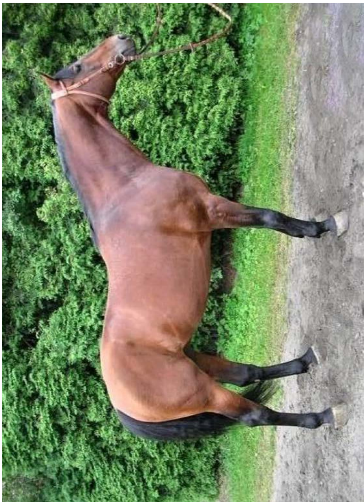
Przedswit IX MT / 1867 Przedswit Jung / v POL 2448 Jung