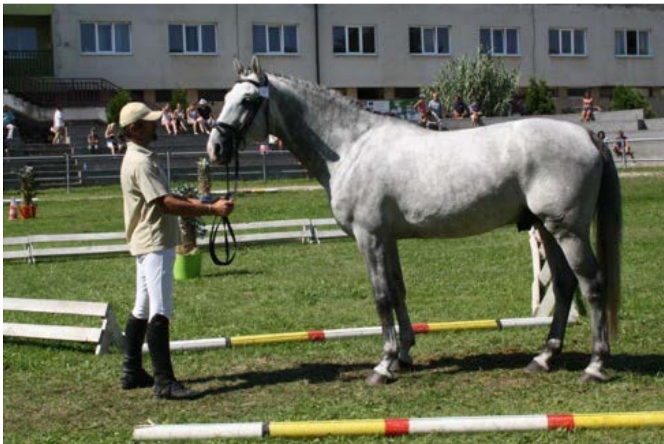
2089 Przedswit XVIII MT Pares