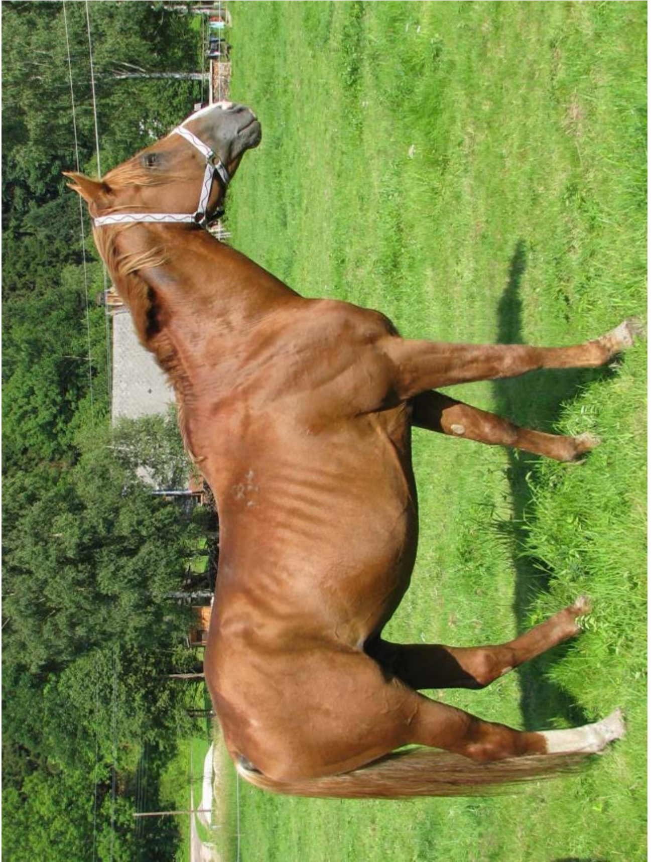
Przedswit IV MT / 2975 Przedswit Lukas