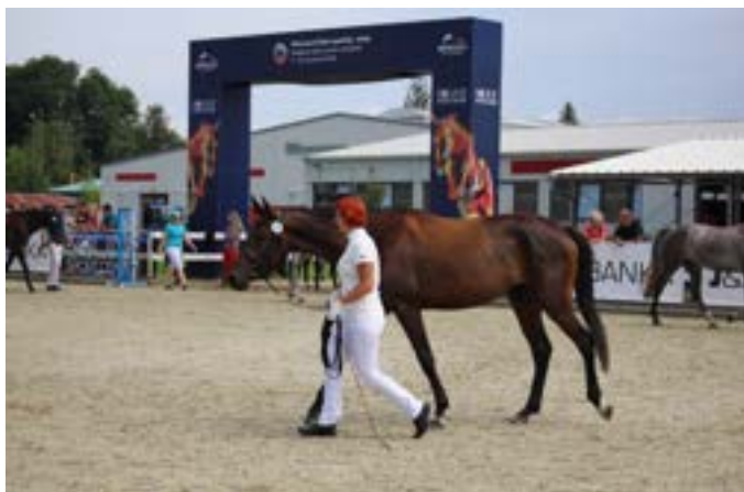
72/827 Queen Very