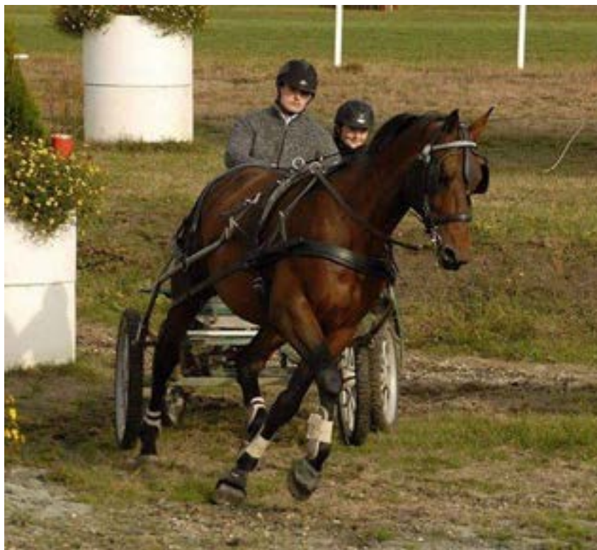
Furioso XXX – 16 / ČARDÁŠ G