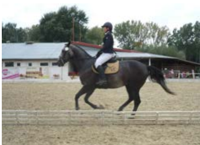
81/167 Scyris MT-2 Saturn G