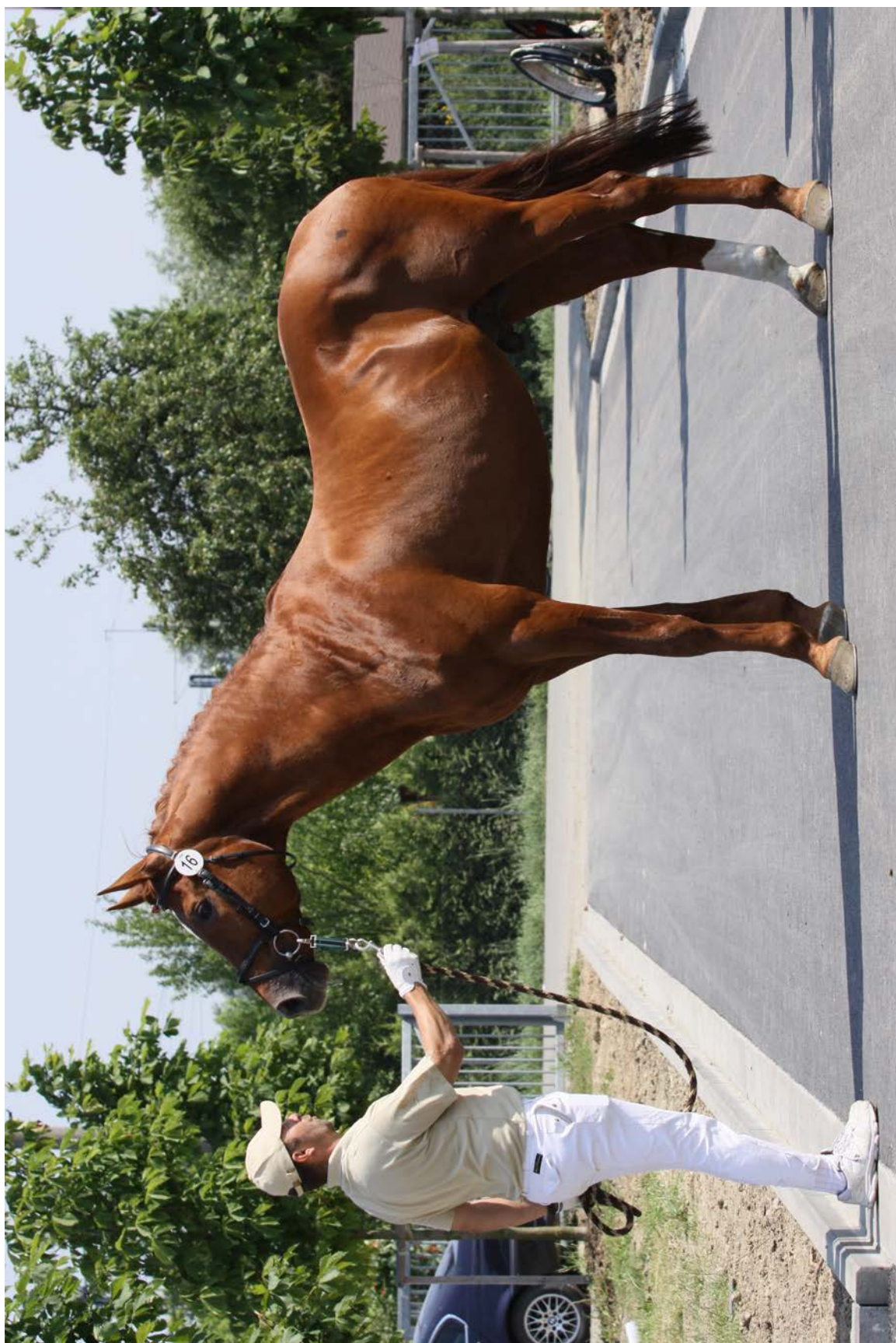
Przedswit V MT/Hary