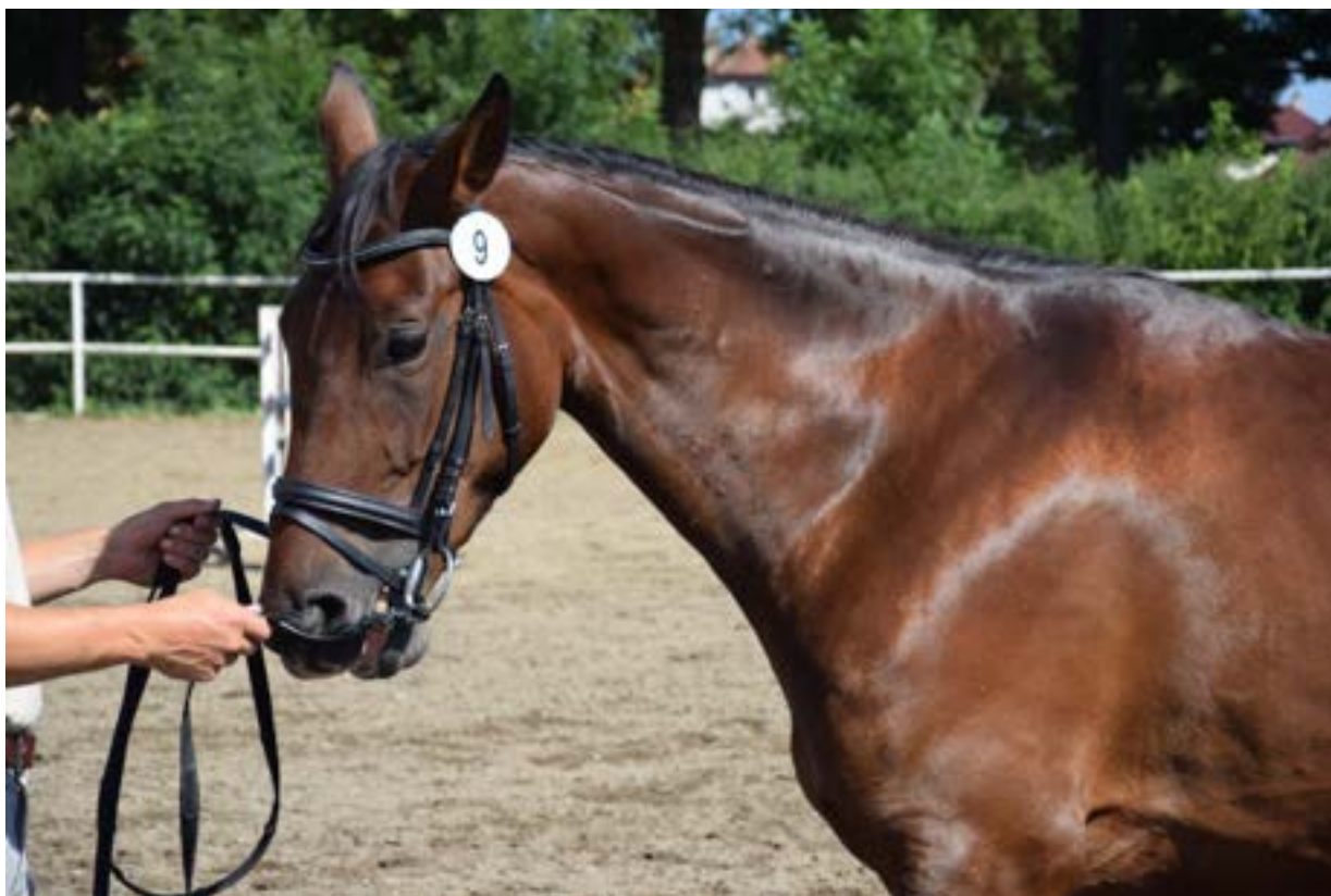
81/144 North Star I MT-2/Nina G

North Star I MT má dobrý exteriér, výraznou mechaniku pohybu , skokové schopnosti a k tomu i velmi dobrý charakter. V chovu moravského teplokrevníka působí od roku 2010. Zatím se po něm narodilo 6 hříbat, 4 klisničky a 2 hřebečci. V roce 2015 vykonala zkoušku výkonnosti jeho dcera 81/144 North Star I MT-2/Nina G, klisna kvalitního původu (matka 266 North Star X-8 Nora), dobrého exteriéru, nadprůměrné mechaniky pohybu a vynikajícího charakteru. Výsledná její známka 8.65 bodu.