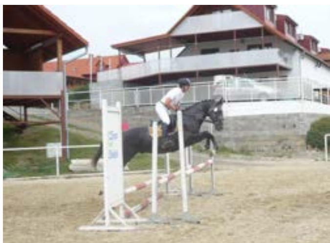
81/167 Scyris MT-2 Saturn G