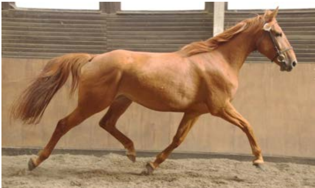
Przedswit IV MT – 2 / Kamey

Hlavním chovatelským cílem při zařazení tohoto hřebce do plemnitby je udržet odpovídající výkonnost potomstva otce a matky a především pokusit se převést z matky na potomstvo tvrdost, vytrvalost, dobrou živelnost, dlouhověkost a především s partnerkami po 2287 Przedswit Horymír a 2609 Przedswit Klam udržet linii Przedswit III - K. Zatím to vypadá, že potomstvo disponuje skokovými vlohami a dobrou mechanikou pohybu. Do chovu jsou po něm zařazeny 4 dcery, všechny do HPK.