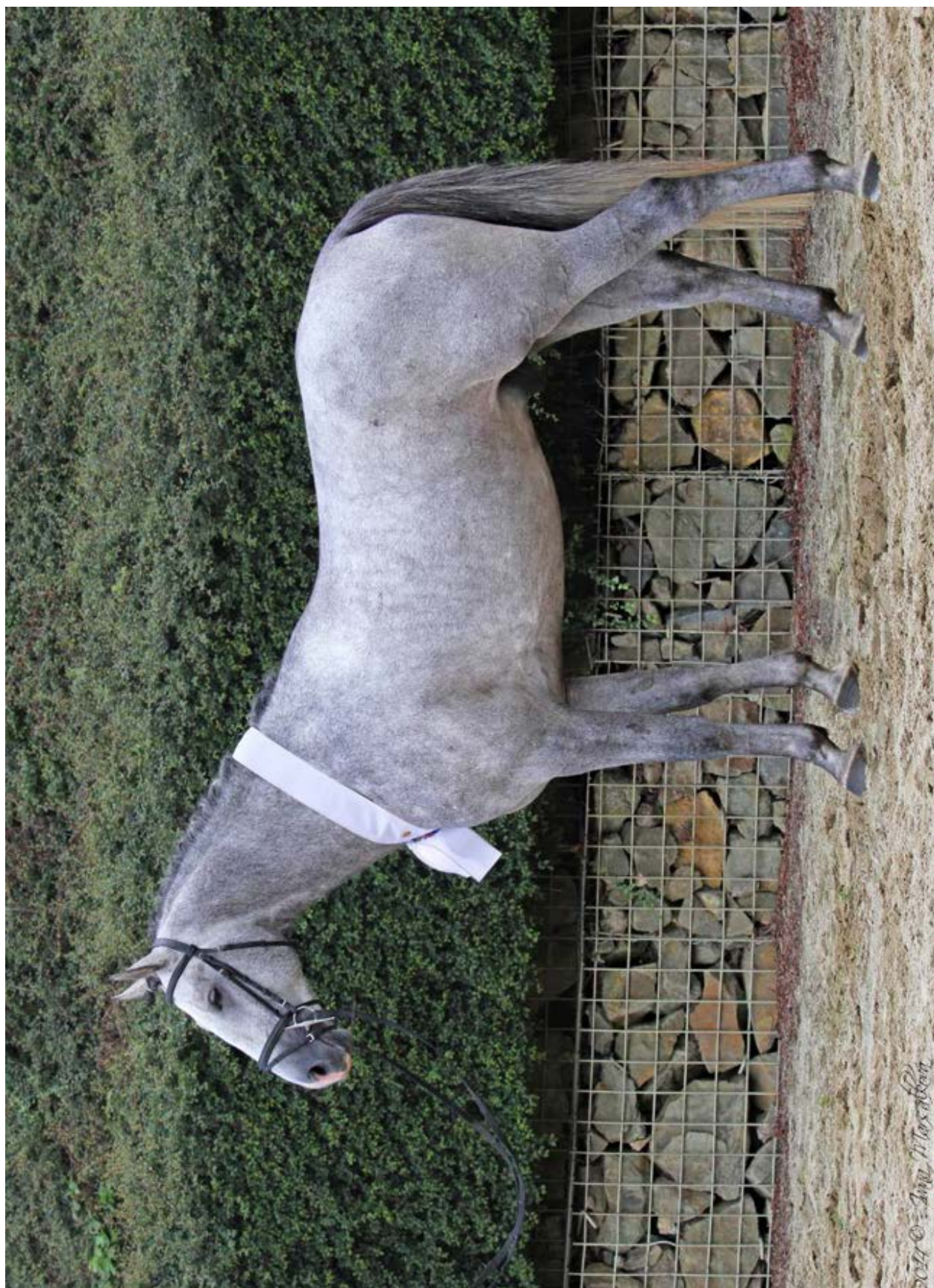
Przedswit XVIII MT / Przedswit II MT – 1 / Pares