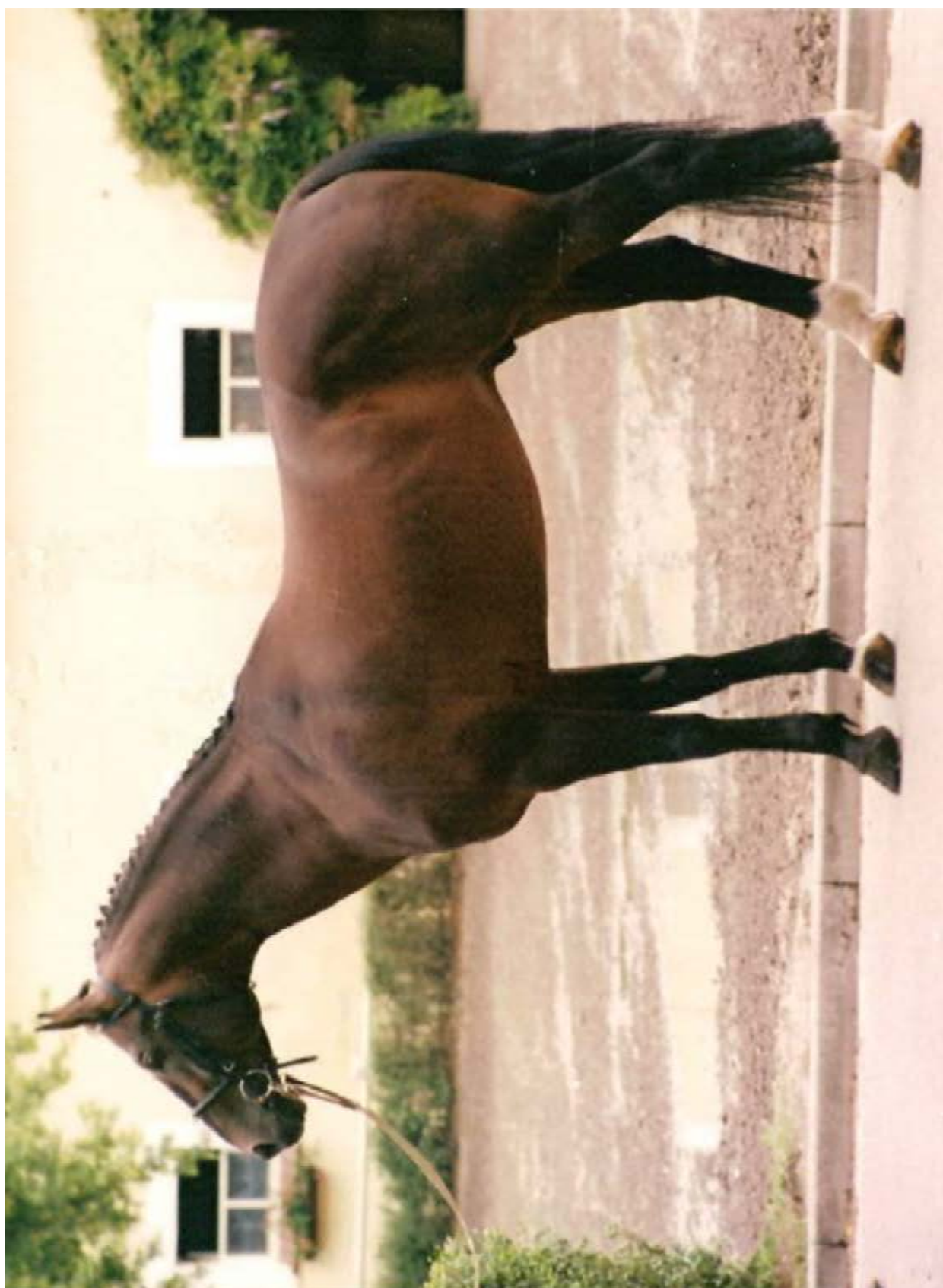
Catalin I MT/2815 Catalin IV-33 (v SK 3397)