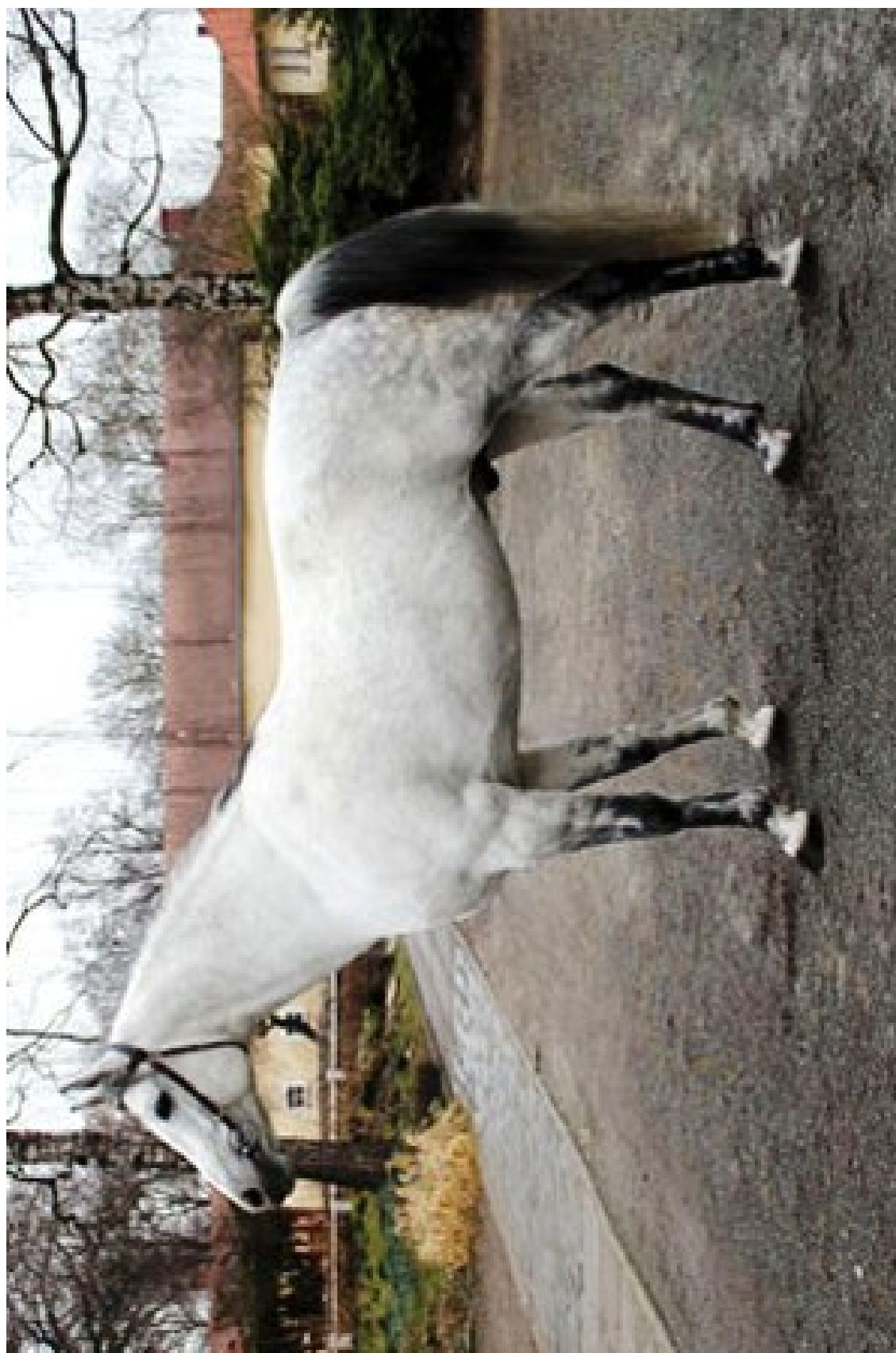
Dahoman I MT / 2943 Dahoman IV – CZ (Tamarix)