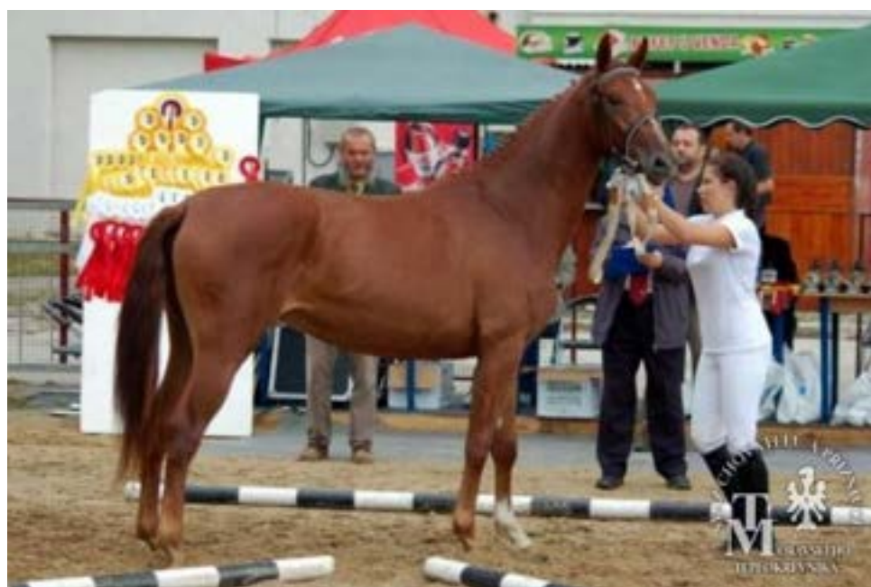
81/52 Forma - J