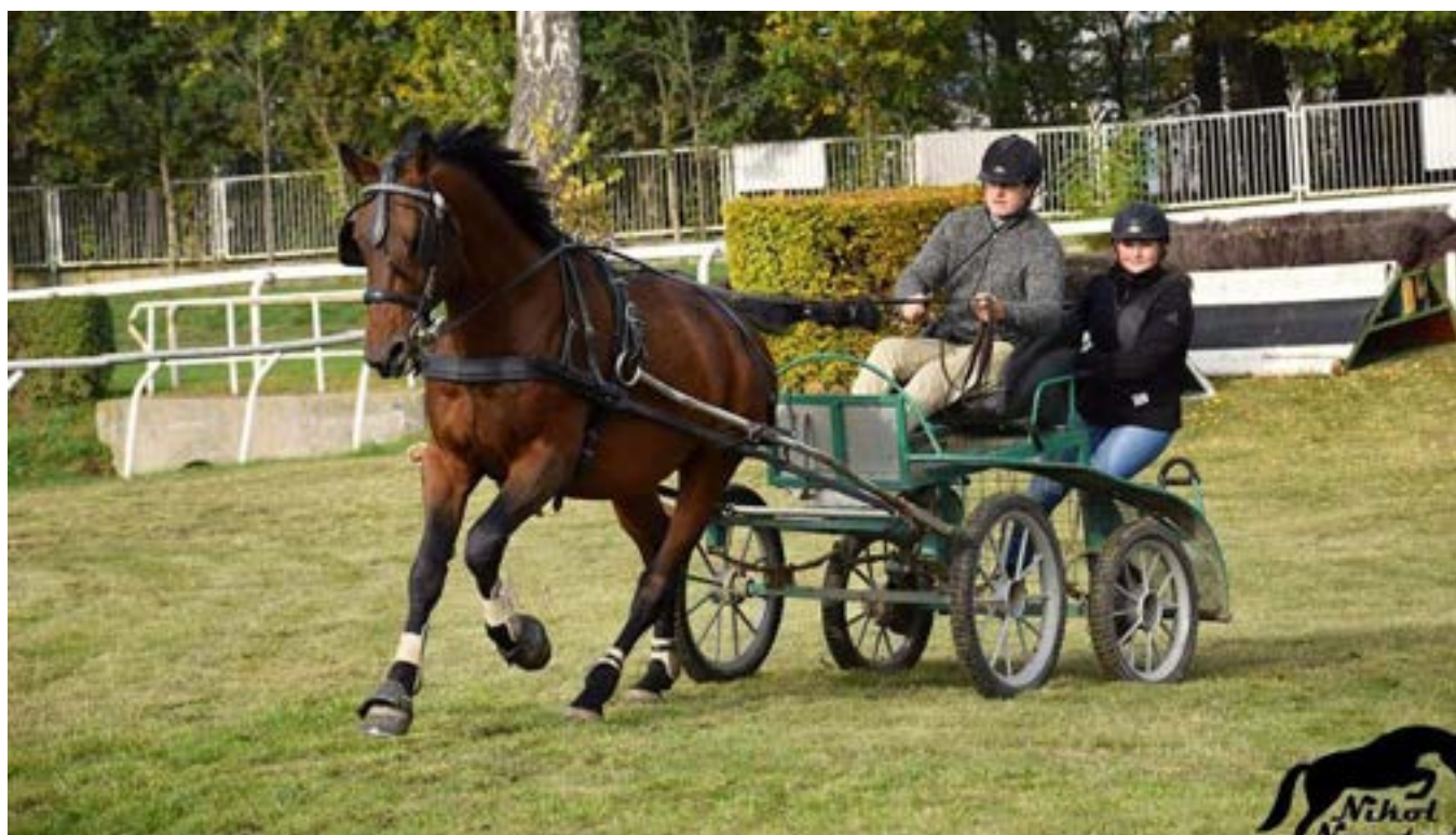
Furioso XXX – 16 SK/ Čardáš G při hobby závodech v Pardubicích, 2.místo

Opět správně ☺. Zde měl startovat LUPO a ČARDÁŠ, u kterého se před startem objevily zdravotní indispozice, takže do soutěže nenastoupil. S výkonem LUPA jsem byl velmi spokojen, což se odrazilo v celkovém hodnocení, kde skončil na 7.místě z 17ti jednospřeží.