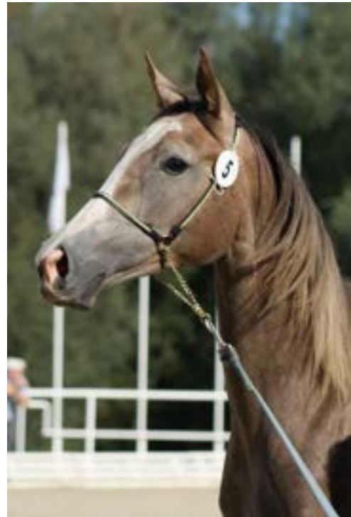
Sahib I MT - 3 / Sachmet