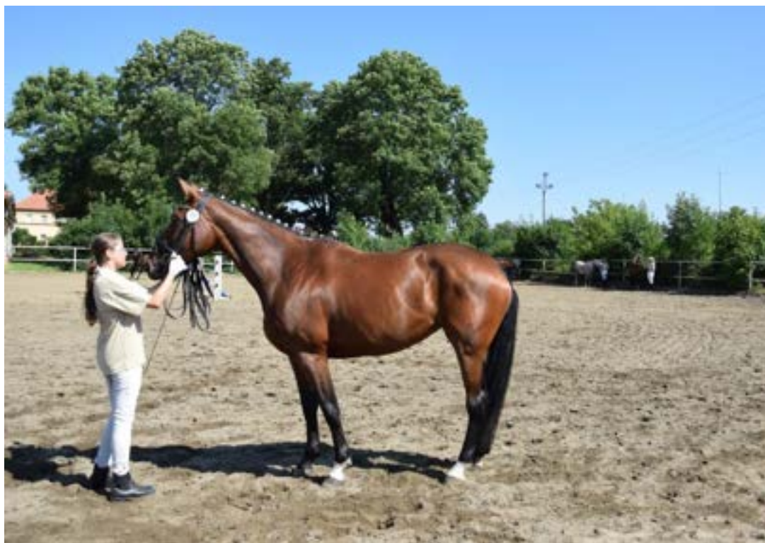
Przedswit IV MT – 4 / Galie