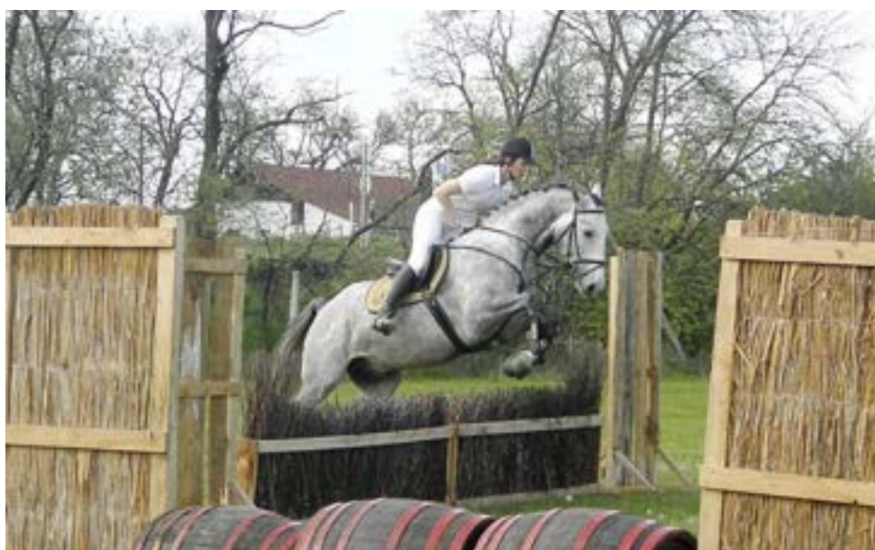
Výstava Maďarsko – Pares ve skokové ukázce