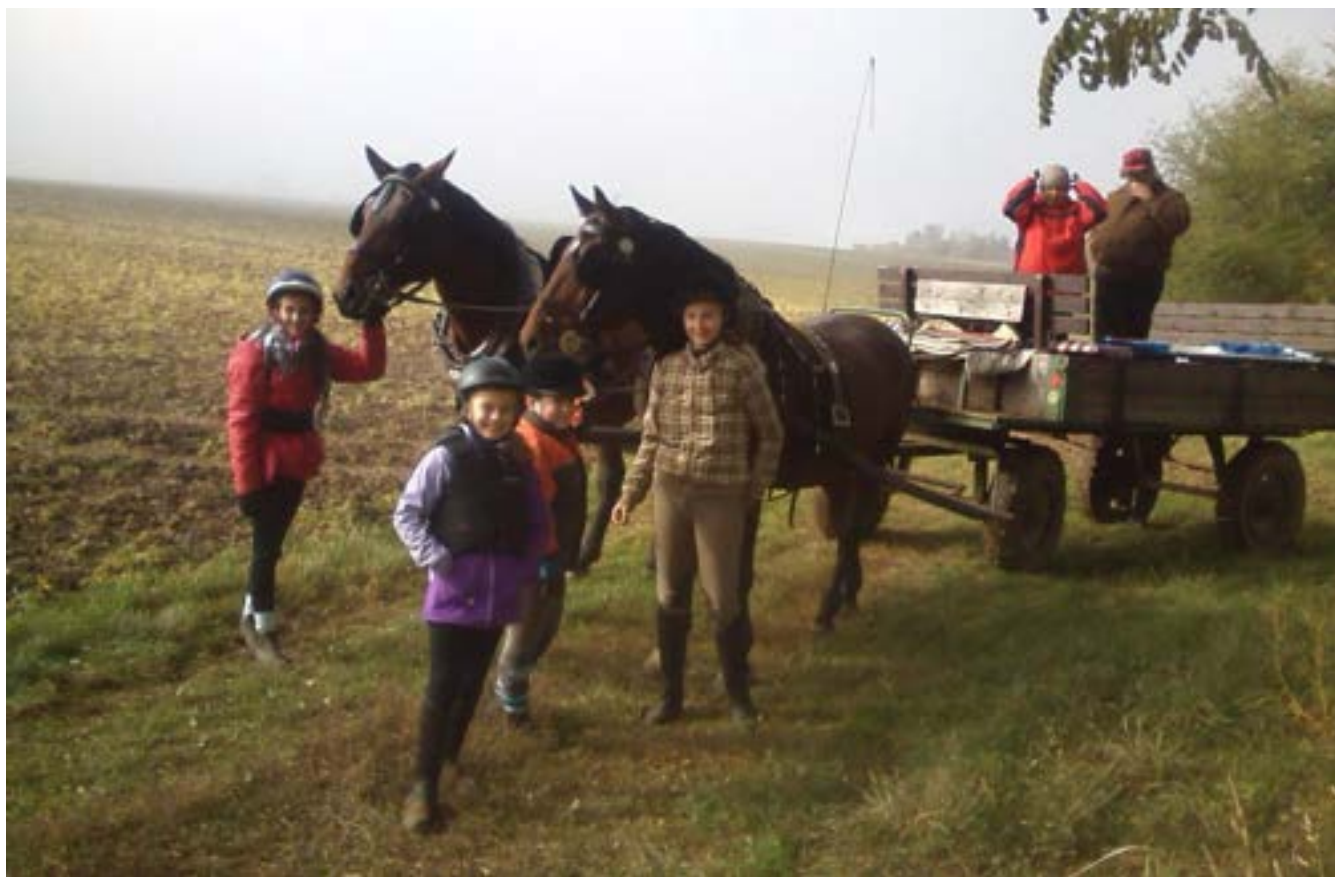
Dvojspřeží moravských hřebců LISTEK, ČARDÁŠ při podzimní Hubertově jízdě v Odrlicích