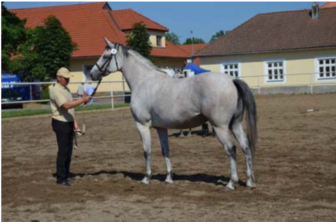
81/103 Furioso VII MT-2/Foneta

V roce 2010 se narodila klisna 81/103 Furioso VII MT-2/Foneta po hřebci 1400 Furioso VII MT (Furioso XXVII-10/Villám/), která v roce 2014 vykonala výkonnostní zkoušky klisen v zápřeži, byla ohodnocena celkovou známkou 8,33 bodu a je nositelkou 70,58% PG. Po zařazení do chovu odchovala hřebčička 81/204 Furioso XIII MT-2/Forlán po hřebci 1983 Furioso XIII MT (Furioso-68 Figura/Merlot), kterého odkoupil Zemský hřebčinec Tlumačov.