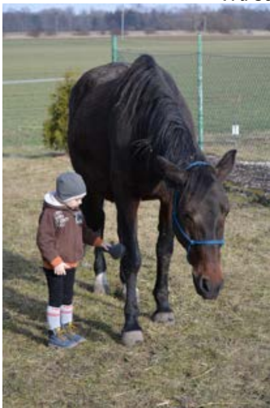
... březulky očesat..... a jede se ☺