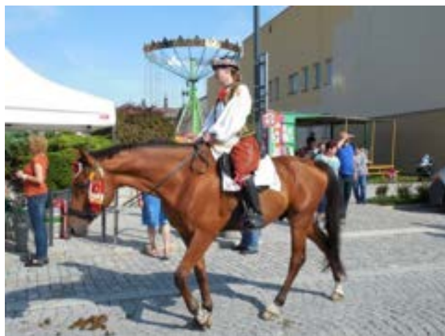
Moravští teplokrevníci pod sedlem