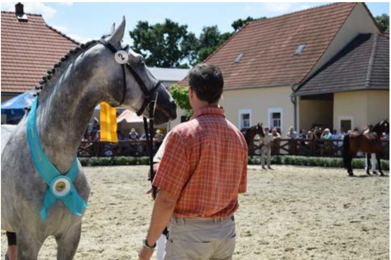
Šampion výstavy hřebec Przedswit XVIII MT/2089 Przedswit II MT-1/Pares