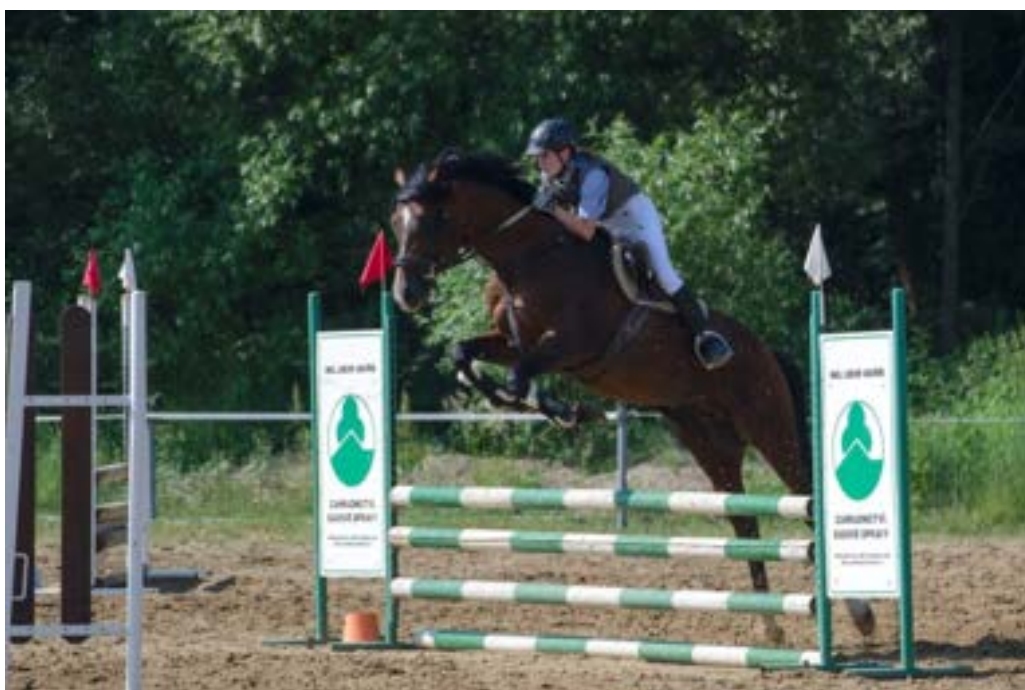
Gidran IV MT / Garnet

Exteriérově je hřebec spíše v typu angloaraba, jemnější v kostře, ale dostatečně široký a hluboký. První ročník hříbat bude mít v roce 2017.