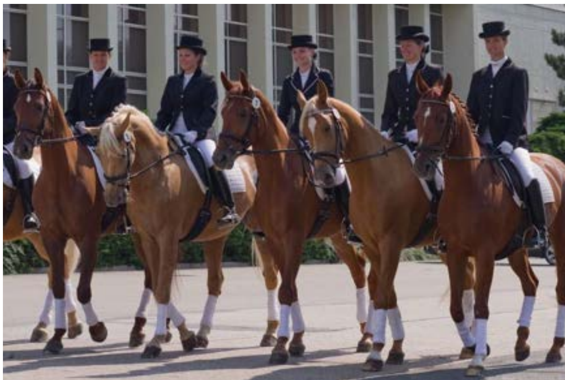
ryzé klisny MT z Kývalky – první zleva 81/12 Frida, třetí zleva 59/14 Sisi a poslední 81/52 Forma - J

Obecně je hřebec vhodný pro připáření za účelem konsolidace typové i původové, dosažení korektního exteriéru a užitkových vlastností. Jeho potomstvo je temperamentní a ušlechtilé s dobrou horní linií, výbornou mechanikou pohybu a v jednotném typu.