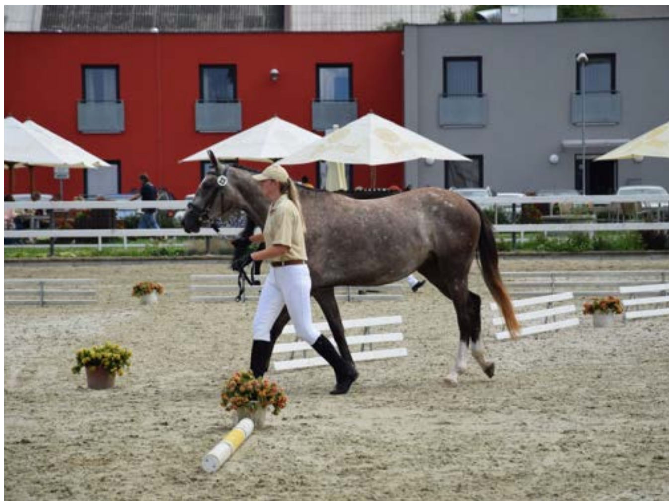
Furioso IX MT-3/Rusalka