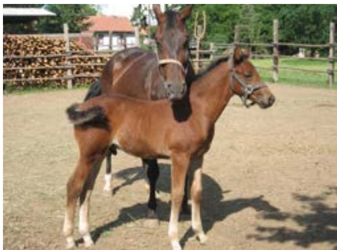
Sametka se Sedrikem

V roce 2007 se jí narodil hřebeček 58/693 Sedrik hnědák po hřebci Gidran I MT (2698 Gidran XVI-6 ). Sedrik absolvoval odchov v testovní odchovně hřebečků ČT v Měníku, kde svůj pobyt zakončil ve 3 letech v roce 2010 zkouškami výkonnosti hřebců pod sedlem s celkovým výsledkem 7,556 bodů. Domů se vrátil jako velmi hodný a vyrovnaný kůň s výborným základním příježděním, na kterém se dalo pokračovat v jeho další sportovní kariéře. V roce 2013 se úspěšně zúčastnil předvýběru hřebců do plemenitby v Těšánkách a 100 denní test zakončil zkouškami výkonnosti hřebců s výsledkem 8,5 bodů. V roce 2015 byl zařazen do plemenitby pod jménem Gidran VII MT . Sedrik se během své dosavadní sportovní kariéry zúčastnil mnoha závodů především v parkuru nebo drezúře a dosáhl sportovní výkonnosti S-L**, D-S, C-Z. Mimo to se účastní národních i mezinárodních výstav.