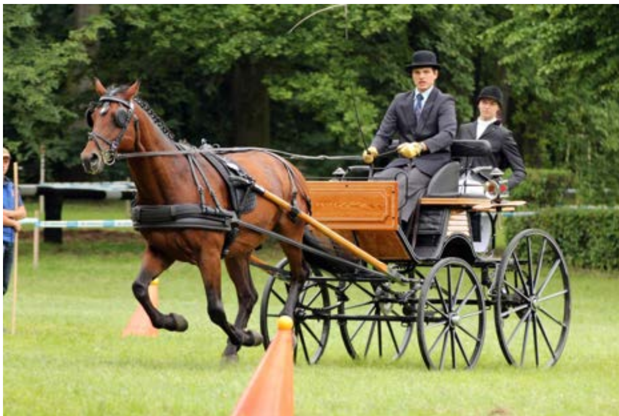
Przedswit XV MT/Listek

Hřebec Przedswit XV MT/Listek byl zařazen do plemenitby na základě vlastní sportovní výkonnosti v zápřeží „TT“. Ač je příslušníkem ryzé linie Przedswitů, sám je hnědák s hvězdičkou, jinak bez odznaků. Je to líbivý souměrný kůň středního rámce, suchého a kostnatého fundamentu s kvalitními kopyty, v hrudníku široký a hluboký, v typu jezdeckého koně, konstitučně tvrdý a vytrvalý. Povahou je zcela ideální, ochotný ke každé práci, dobře jezditelný, s dobrou mechanikou pohybu v kroku i klusu a s velmi dobrou technikou skoku, což také vyplývá z protokolu předvýběru hřebců, kde byl ohodnocen za skok ve volnosti nejvyšší známkou za skok 8,2 bodu. Skokové vlohy, dobrou jezditelnost a ochotu k práci dědí po svých předcích. Listek