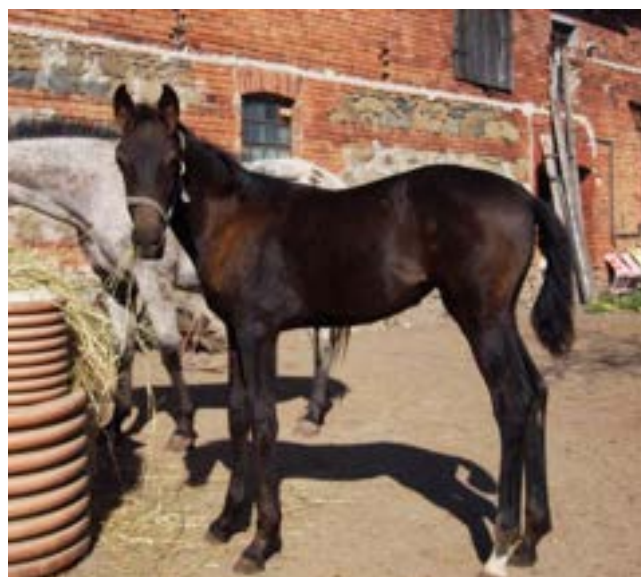
81/33 Catrin s klisničkou 81/219 Dahoman I MT-2 Camila