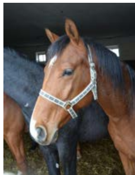
vnuk Fontány II. - 81/204 Furioso XIII MT-2/Forlán v odchovně ZH Tlumačov