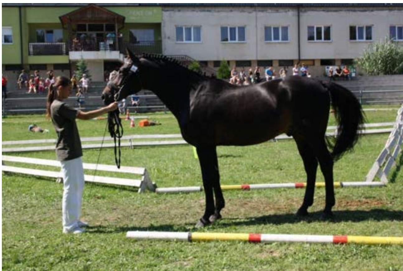
Furioso XXXIV Red Fernet