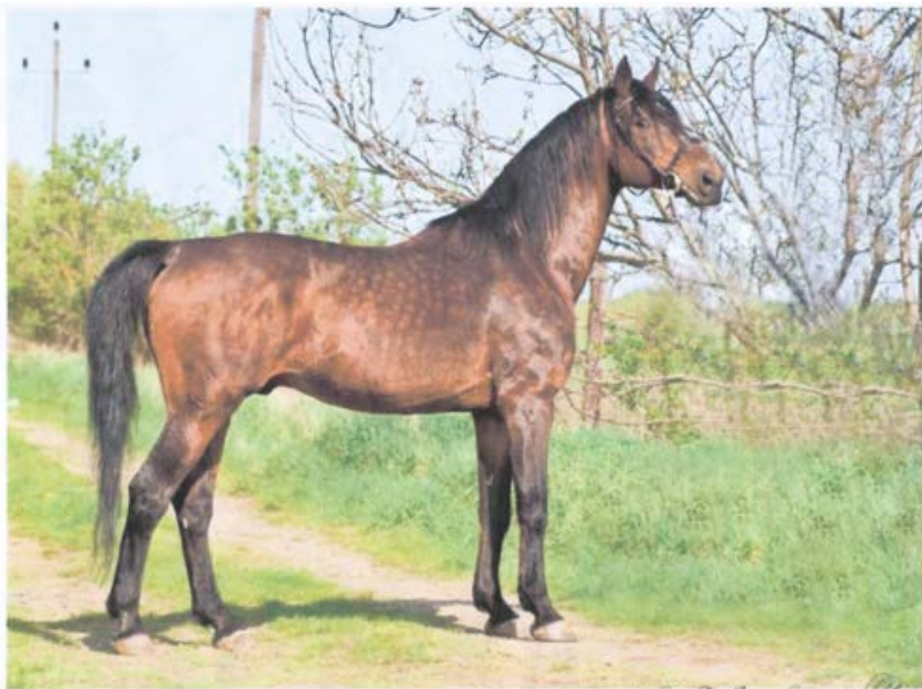
Przedswit IX MT/1867 Przedswit Jung

Zařazením tohoto plemeníka do chovu MT si slibujeme především osvěžení krve se zachováním starých předválečných linií a v neposlední řadě zachování všestrannosti potomstva a zvýšení úrovně jeho užitkovosti.