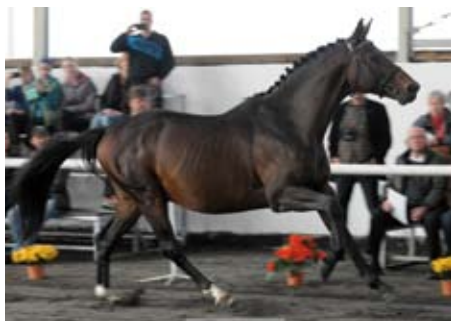
Quintar