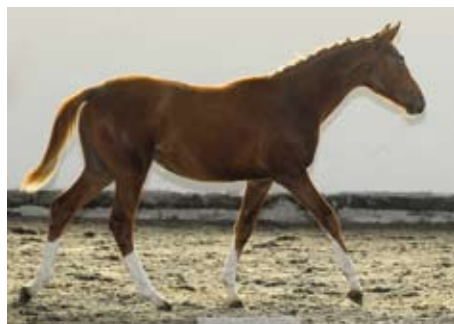
Klisnička Prostota (Prokelwitz - Parika po Lateran)