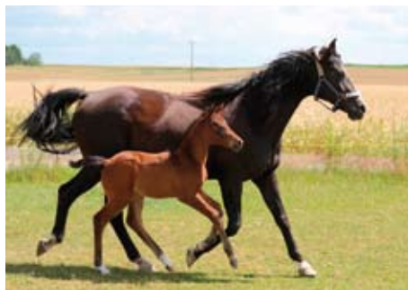
Klisna Kachetia po Chalif 5 s klisničkou Karla po Aktiv