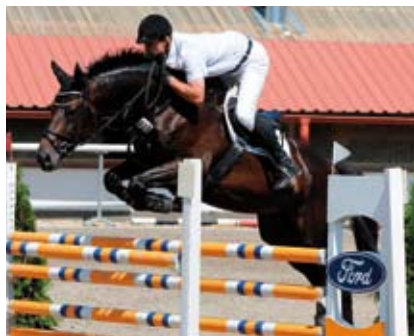
Quintar