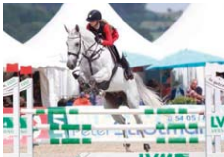
Isar - Tereza Vysoudilová foto archiv majitelky