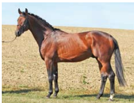
Prökelwitz (Chokkej)

Schralling z Hřebčína Amona byl dokonce pro sezonu 2016 zapůjčen do Německa k živému připouštění, do české PK tam letos působil i u nás vybraný Skandau . Chovatelem těchto hřebců je špičkový německý chovatel a náš člen a spolupracovník Dr H. E. Wezel.