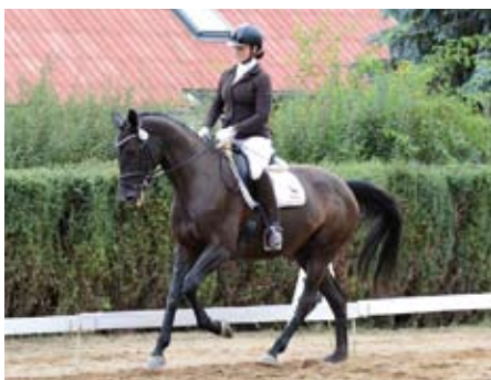
Ask Me Please - Barbora Marešová