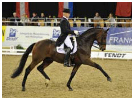
Imperio