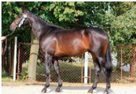
KROS po Ajbek - Sword xx, vítěz Bielice 16

Test hřebců zakončený 28. září v Bielicích se konal dohromady s ostatními teplokrevnými plemeny, které byly zastoupeny opravdu hvězdnými původy Chin Chin, Corrado, Nabab de Reve, Farmer, Coriano, Coupe D' Or ...) Došlo tak k zajímavému srovnání, ze kterého vyšli trakéni ve velmi dobrém světle a zejména v závěrečném krosu zanechali výborný dojem svým charakterem a schopnostmi. Nedílnou součástí posuzování koní v Polsku je tzv. bonitace (již od hříbat), která velmi přesně popisuje koně v 7 známkách : typ, exterieur, fundament, krok, klus, cval, celkový dojem. Závěrem se známky sečtou a dají výsledek, který je velmi dobrý nad 50 b. A vynikající nad 55.