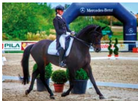
Handiness - Valeriya Belozerskikh

Landsberger (Kasimir – Lena II po Caprimond), nar. 2008. V sezoně 2016 7x zvítězil a 12 x se umístil v drezurních soutěžích S se svou stálou jezdkyňkou Zuzanou Střebákovou (JK Iluze Makotřasy). V roce 2015 získal 7 vítězství a 6 umístění. A umístil se i v mistrovských soutěžích. Kasimir patří k předním producentům drezurních koní v Německu a Landsberger byl předveden i na Körungu mladých hřebců v Neumünsteru v roce 2010, kdy již tehdy vynikal vyrovnaností a mechanikou pohybu.