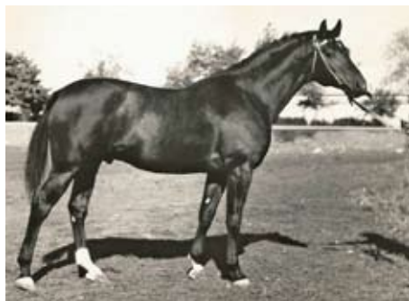
Chokkej (Pomerantes)