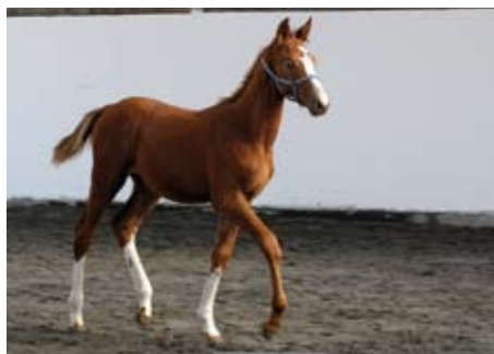
Hřebeček Sargoni Son (Sargoni - Plazma po Zakon xx)