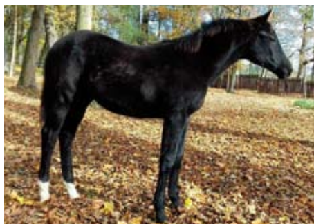
Klisnička Margo (Millennium - Džokonda po Ogoň)