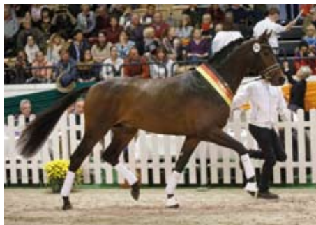
His Moment

(Rheinklang – Interconti) s dvojitým talentem. Další premiování byli HERZENBRECHER (Ruffian Reef xx – Imperio), HIGH FIVE (Saint Cyr – Summertime) a IN STEP (Schwarzgold – Buddenbrock). Nejlepším skokanem lotu byl vyhlášen KARLSSON (Dramatiker – Elimcal xx). Jeho otec Dramatiker byl již prodán do Číny, ale během letošních výběrů mu byl udělen titul ELITE HENGST za mimořádný přínos ve skokových vlastnostech. V Čechách působí ve sportu i chovu jeho syn HEIDEKRUG (z