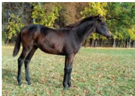
Hřebeček Master (Millennium - Pasadena po Epi-graf)

V sezoně 2016 bylo připuštěno celkem 27 klisen, použiti byli hřebci SCHRALLING (9 příp. klisen), PLESANT (5), ARIZONAS (3), QUINTAR (3), CHEOPS (2) a po 1 klisně zapustili plemenci SKANDAU, PRÖKELWITZ, SARGONI, SYMONT a EGERTON xx . Narodit by se tak mělo v příští sezoně přes 20 hříbat.