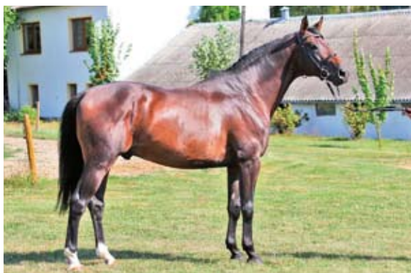
Quintar