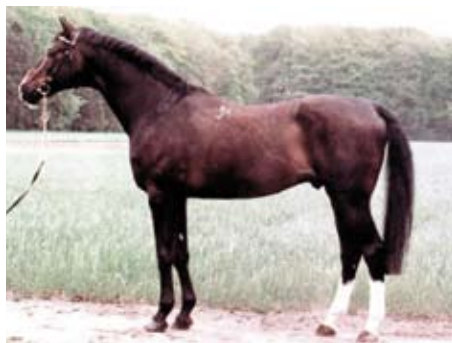
Almox Prints (Chokkej) foto archiv SCHČTrak

V Trakehner Gestüt Rhön (Burkardroth) Dr. R. Payrhubera a B. Kriegelstein byly k zápisu předvedeny 4 klisny vynikajících původů. Chov je zaměřen na skoky a military s výrazným podílem nejlepší ruské krve. Špičkou je klisna HAMINGA, matka plemeníka HAMILTONA (vnuk Abdulla). Jejím otcem je skokan mezinárodní třídy Etiudas Eskado z linie olympijského Topkije, matka je po olympijském Espadronovi a otec báby Cheopsas je otcem slavného skokana N. Skeltona – Traxdata Mulligan. Zapsána byla i dcera Hamingy HANNA po T skokanovi Waitaki a Haminga sama je po Waitaki znovu březí. Další předvedené