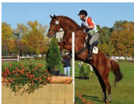
Prim - Michal Zaruban foto archiv majitele

Quintar (Quintet - Stella), nar. 2009, Hřebčín Amona. Má za sebou úspěšnou kariéru skokana a začíná se věnovat plemenitbě. Zvítězil postupně ve Finále MŠMK 4 a 5tiletých, stal se nejlepším 5tiletým skokanem ČR, nejlepším 5tiletým trakenem na Bundesturnier v Hannoveru, skončil 2. ve Finále MŠMK 6tiletých a byl nejlepším CS koněm ve Finále Martinického šampionátu 6tiletých. Letos se umístil v Májové Ceně Frenštátu p. R. (S*).