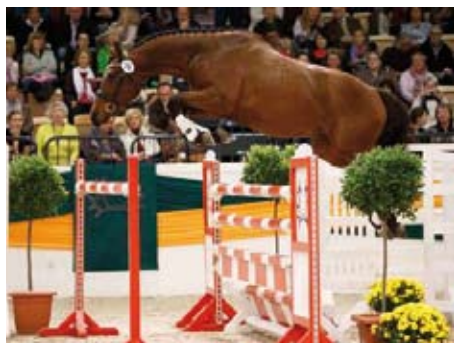
Popeye po Fragonard

matky Sky Dancer) - vítěz drezurního KMK drez. šestiletých 2016, který byl během körungu v Neumusteru v roce 2012 rovněž skvělým skokanem a navíc jako tříletý zvítězil v německém testu s hodnocením 8.31 b.