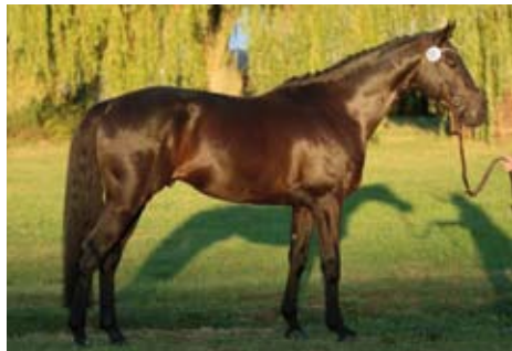
Avatar (Ajbek)

Ve dnech 26. - 28.září 2016 proběhly zápisy a bonitace polských trakénských hříbat a závěrečné zkoušky hřebců v Bielicích. V mezinárodní komisi pracovali P. Boleski (POL), H. W. Paul (GER), R. Jasiene (Litva) a MVDr. V. Holý (Česko).