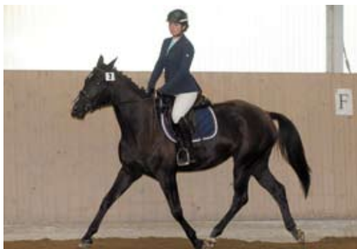
Kira