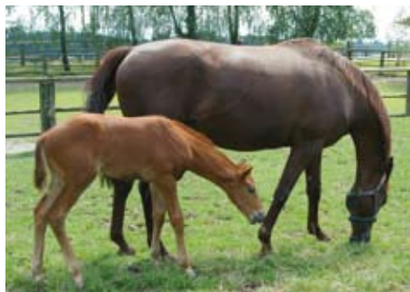
Klisna Pina Colada po Apogej s hřebečkem po Abrek