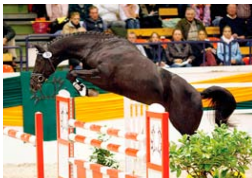
Abendtanzen (Hirtentanz)

V sezoně 2016 bude zapsáno 13 hříbat a budou to potomci plemeníků Aktiv, Prökelwitz, Plesant, Topas, Sargoni, Millennium a Abrek. Rozvoj připouštění bude znamenat minimálně 25 narozených hříbat v sezoně 2017. Pro příští sezonu počítáme s licencací kapitálního hřebce ULTIMO (Almox Prints). Pět trakénských tříletých klisen je připraveno do základních zkoušek výkonnosti klisen.