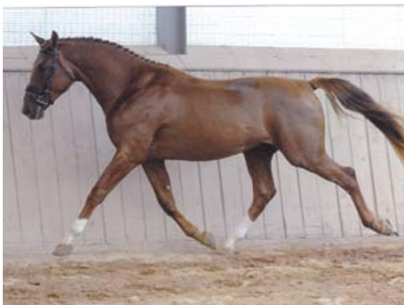
Ultimo foto archiv majitele

Po hřebci Nerv působí v německu skokový plemeník jako např. LICHTBLICK nebo LIMIT.