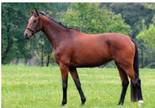
Carben foto Zenon Kisza

v Borové další klisna H. Keitela, GRE-TA GARBO (First Flight Spirit – Gräfin IX po Black Magic Boy). Typově velmi pěkná a osvalená ryzka s dobrým krokem a cvalem je pozorná ve skoku. Její celkové hodnocení je 7.3 bodu. Všechny klisny budou nadále využity ve sportu a v chovu.