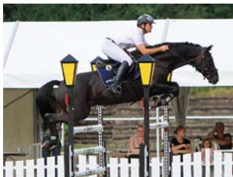
Hirtentanz