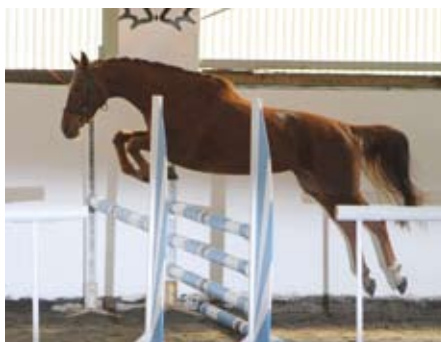
Greta Garbo