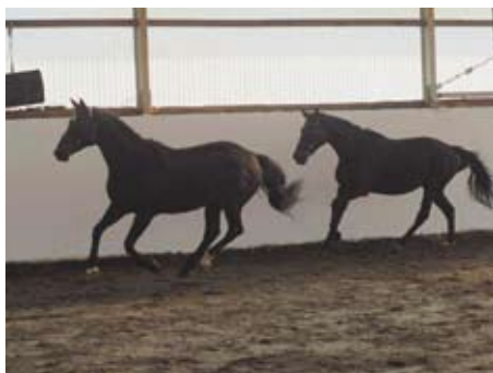
Havana (Hohenstein - Komponist) a Charisma (Sargoni- Bura po Quoniam II)