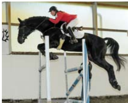
Arizonas, foto Zenon Kísza

Jeho otec ALMOX PRINTS startoval 2x na Olympijských hrách (Soul a Barcelona), zvítězil v GP Rotterdam, Wiesbaden, Fontainebleau, umístil se v GP Čáchy. Do chovu dal plemeníky Donauprints, Finest Prints, Amarettos Dream, Prints Argentinus a další.