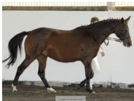
Jasná (Lateran - Tamisa po Sargoni)

již velmi úspěšná v soutěžích do stupně S. Tato krásná vranka je typickou trakéňkou a v budoucnu bude i cennou matkou, pochází z vynikající rodiny Vysluga (rodina výkonnost skok 150).