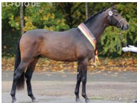
Vítěz výběru v Neumunsteru 2016 His Moment (Millennium - Le Rouge)

20. - 23. října 2016 se k výběrům sjelo do Holstenhalle v Neumünsteru celkem 36 hřebců, z nichž výběr obdrželo 13. Mezi pěti premiovánými se stal nakonec vítězem výběru HIS MOMENT (Millennium – Le Rouge). Skvěle se pohybuující i skákající hnědák potvrdil drtivou nadvládu Millennia, který má již přes 20 zařazených synů a 3 vítěze körungů. Zařazen byl i jeho další syn – RHENIUM (Millennium – Hofrat). His Moment se za 170 tis. euro přesouvá do dánské stáje ke špičkovému jezdcí A. Helgstrandovi. Rezervním vítězem se stal bílý, velmi elastický ZAUBERREIGEN