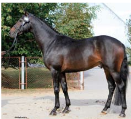
KANON po Olivier (Bielice 16)