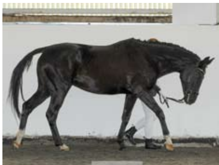
Revita (Aktiv - Remonta xx po Montelimar)