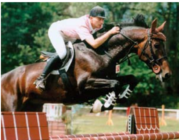
Aktiv, foto archiv Hřebčína Amona