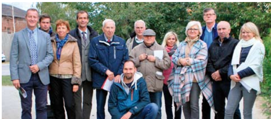
Mezinárodní komise Bielice 2016