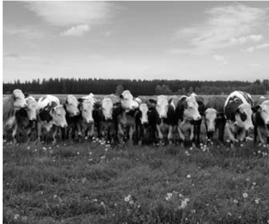
Pastva Heralec