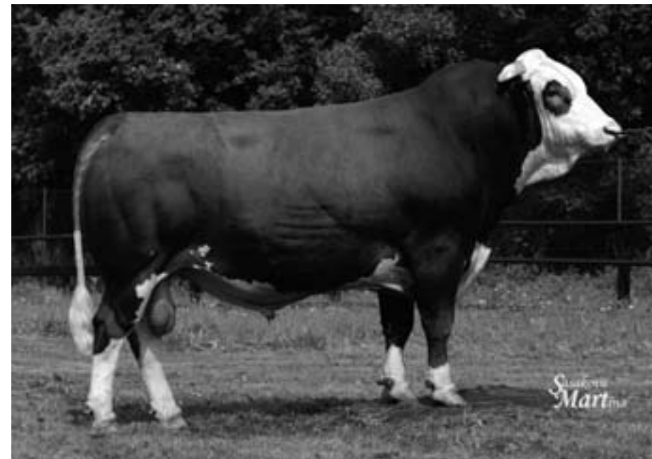
Býk RAD-331 (Hollywood)

PH plemenná kniha holštýnského skotu celkem – results of cows recorded in herdbook of Holstein Cattle (total)