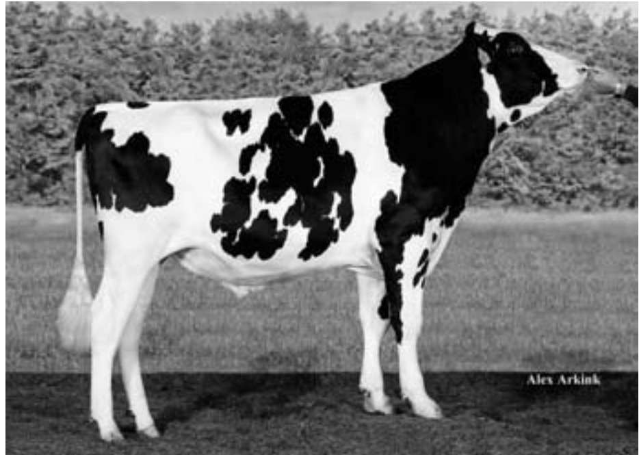
Býk NXB 095 (Rocky)

Pořadí – rank Číslo krávy – number of cow Zemědělský podnik – breeder Stáj – city, farm Středisko – region Plemeno – breed Otec – sire Otec matky – sire of dam Pořadí laktace – lact. record Lakt. dny – days of lactation Mléko kg – milk in kg Tuk % - fat in % Tuk kg – fat in kg Blk % - protein in % Blk kg – protein in kg Souc B+T – protein + fat production Mezidobí – calving interval