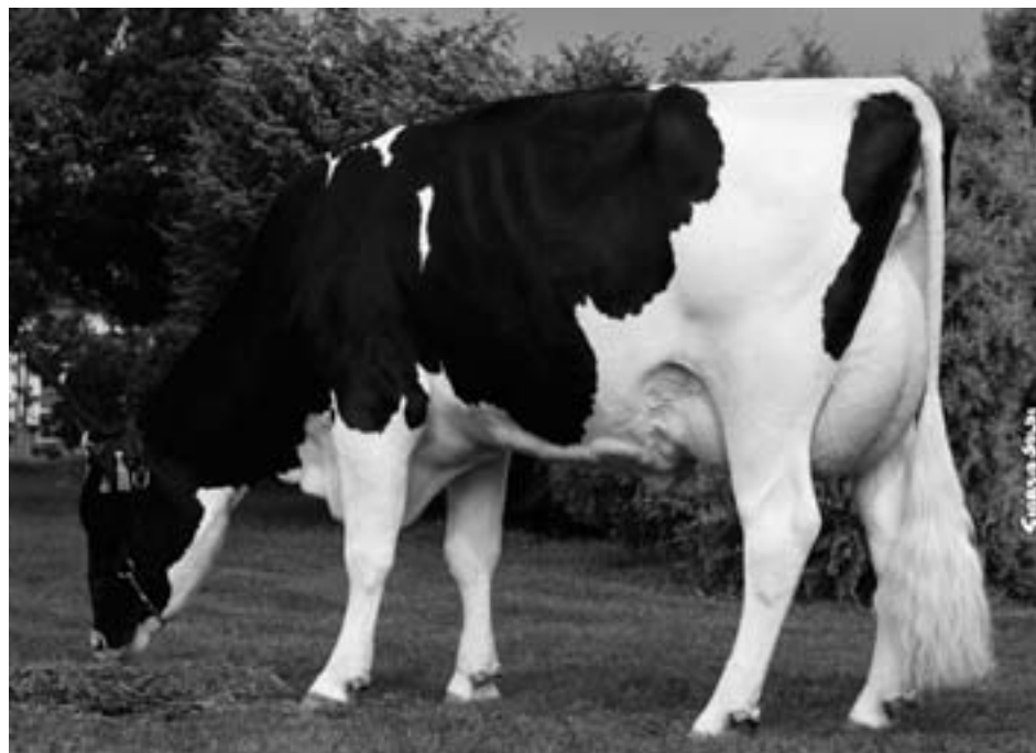
Ostretin Petra 75, VG 87, chov Zemědělská společnost Ostřetín, a. s.