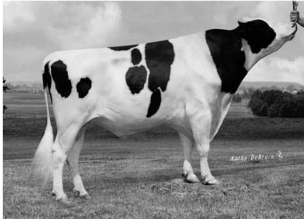
Býk NXA-816