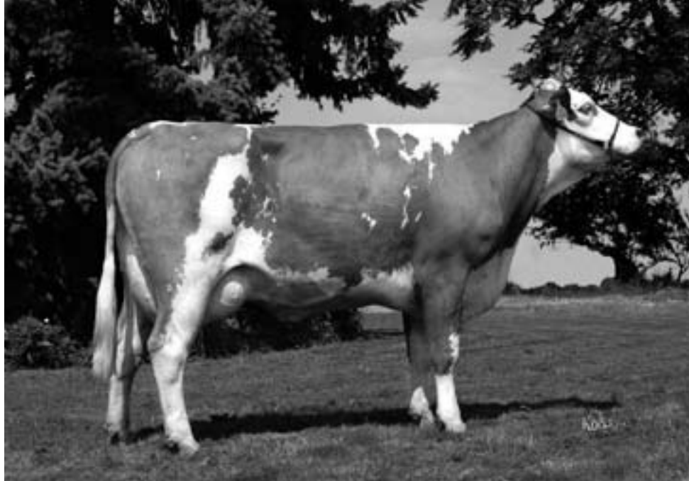
Dcera po býku RAD-331 (Hollywood), AGROSPOL Bolehošť