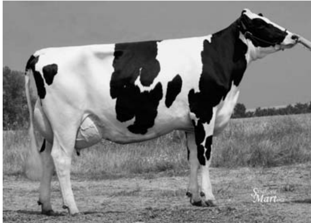
Dcera po býku NXA-816 (Yank), Vlčnovská zemědělská, a. s.