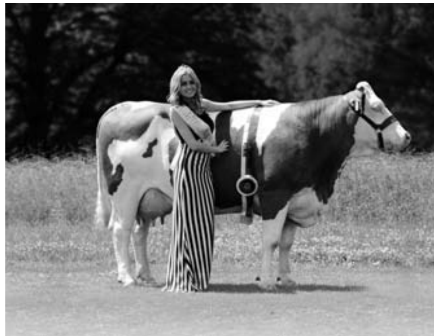
Šampionka plemene 2013, kráva číslo CZ 400410961, po býku RAD-265