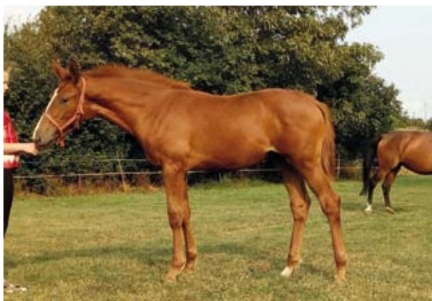
Klisnička Rozárka (Quintet - Jasná po Ikar)