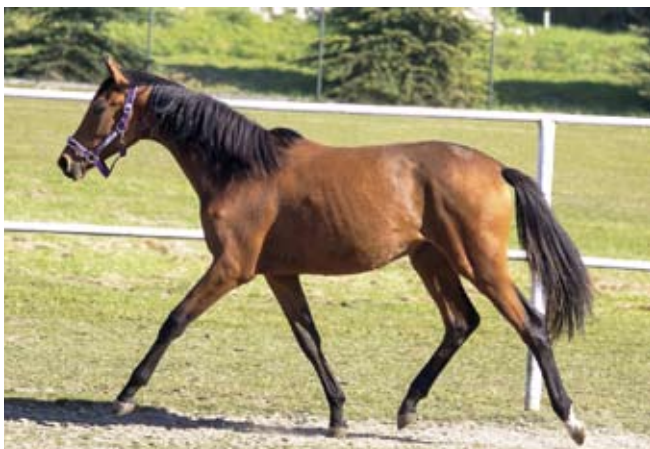
Roční klisna Chiara (Schral- ling - Charisma po Sargoni)