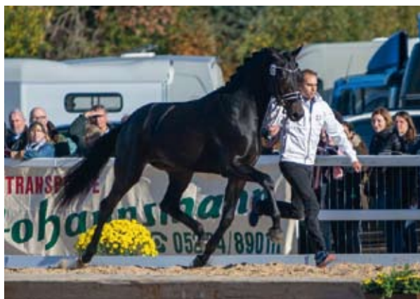
Rezervní vítěz Instagram (Schwarzgold - Vivus)