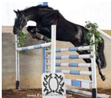
Powiew, foto Zenon Kisza

linii Sicambre xx – Prince Bio xx. Prowansja dala již také hřebce PARAVOS (Karat 1), prodaného do Německa.