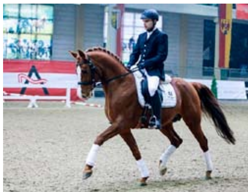
Pagur ox

Pagur je 2 x prochován na hřebce Sport a dokonce 5 x na legendárního plemeníka Pri-