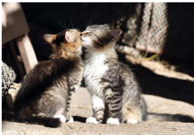
Stájoví kocourci Olda a Polda