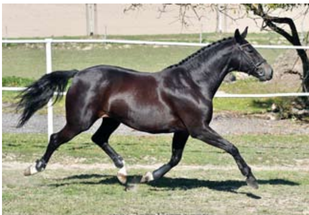
Klisna s podílem trakénské krve, Perra (Sagitta - Panama po Topas-23 (Démon))