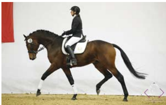
Schralling, foto archiv SCHČTrak

Bába Schlödien II ( Königspark xx ) dala již 5 plemeníků v čele s GP skokanem Schen- kendorfem (Topkij). Jedná se o cennou ro- dinu Schwalbe.