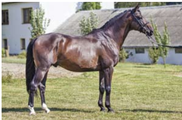
Quintar