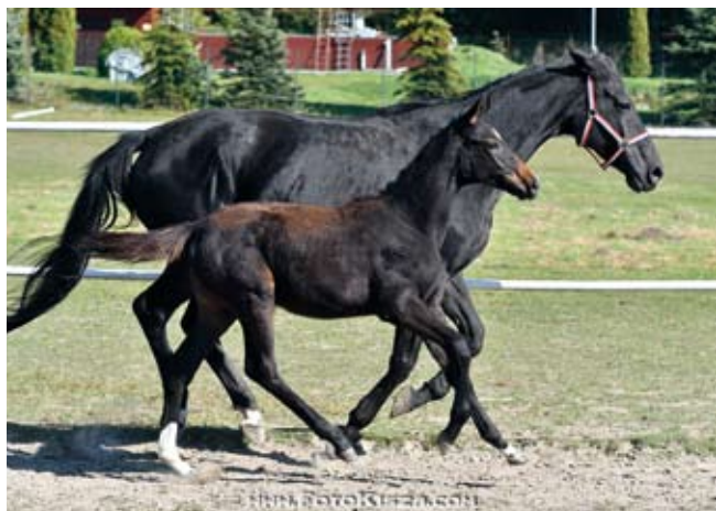
Klisnička Chaira (Quintar - Charisma po Sargoni)