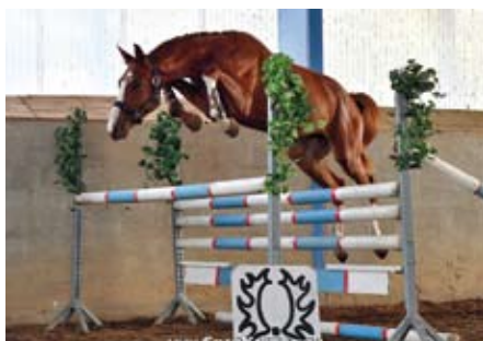
Sargoni Son LH

je po Dragun, který byl otcem famozního skokana mezinárodní třídy Palladium. Sargoni Son LH byl bonitován za 60 b.