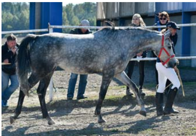
Chovná klisna Sirael (Sargoni - Synthia II po Caprimond)