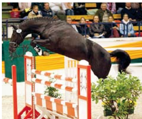
Abendtanztanz (Hirtentanz)

německé Sanditten (Lowelas) a příští rok čekáme 4 hříbata.