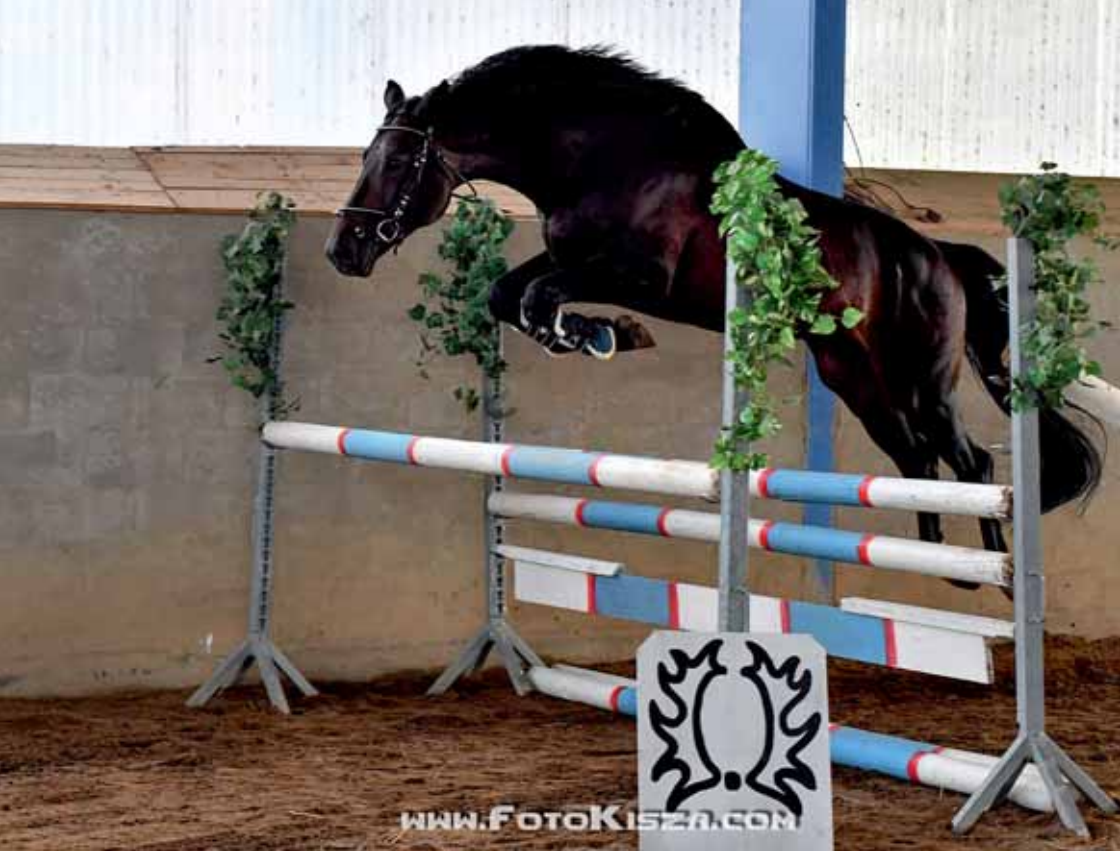
Quintar (Quintet - Stella po Saint Tropez), foto Zenon Kisza