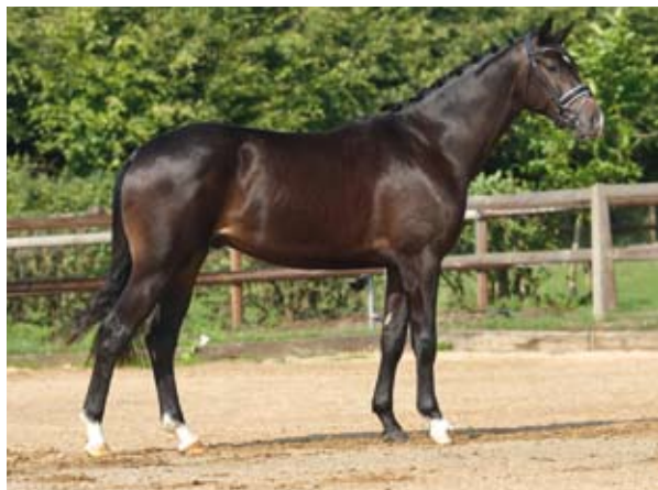
Ibrox Park

stoupeni „Hřebci roku“, GP skokani a drezuristé.