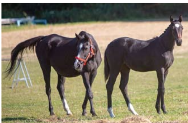
Dvaadvacetiletá chovná klisna Triana (Topas-23 - Toleda po Quoniam VIII) s klisničkou Trischa po Schralling, foto Sigrun Wiecha