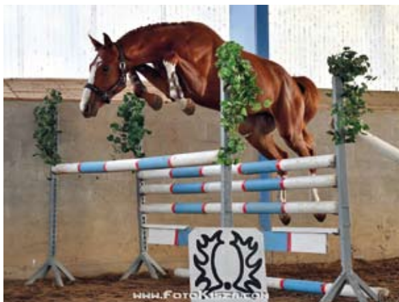
Sargoni Son LH

Jeho otec SARGONI byl importován z Německa jako dvouletý a disponoval talentem pro skok i drezuru. Již v 6ti letech zvítězil v soutěži ST – 140 a absolvoval drezuru „S“. Vynikal silou, charakterem a mechanikou pohybu. Jeho všestranné potomstvo dosáhlo výkonnosti T v drezuře i ve skákání. Mezi jeho nejlepší potomky patří Zifan (drez T), Isar (skok T), Charisma (skok ST a drez St Georg), Velma (skok ST). V původu Sargoniho je 22 % plnokrevné krve.