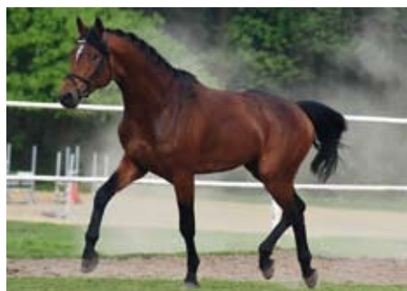
Schralling, foto Lenka Stříbrná

80-denního testu se ve finále zúčastnili 2 synové Aktiva, kteří prošli již 2letým výběrem v roce 2017 a zejména AKTIEN byl velmi využit, naživo připustil 9 klisen. Vítězem testu se s 8.3 b stal AKTIS z ruské Kachetie po Chalif 5. Silný hřebec s vizáží dědy Pepela vynikl ve skoku známkou 8.3 a za připravenost dostal dokonce 8.5 b. Jeho polosestra Karen (Arras) již dokázala zvítězit v parkuru ST* a 2x se zúčastnila mistrovství republiky ve skocích. AKTIEN (Schlodien II po Königspark xx) dokončil s výslednou známkou 8.2 b, pohyb 8.2, interier a připravenost 8.5. Aktien s vysokým podílem plnokrevné krve (50 %) je výborným plemeníkem pro