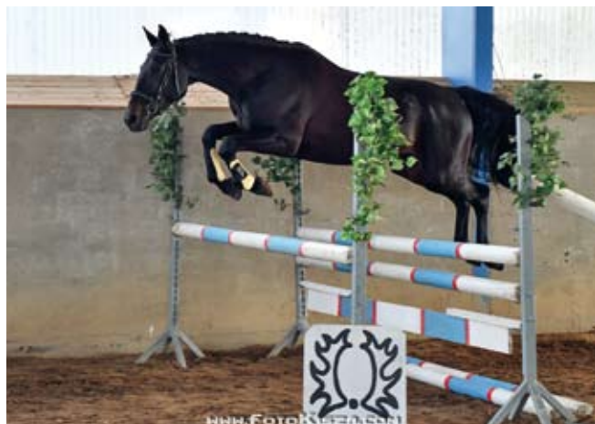
Klisna s podílem trakénské krve, Irlanda (Grand - Ikarie po Ikar), foto Zenon Kiszka