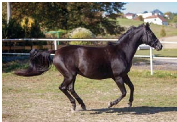
Chovná klisna Verena (Ikar - Virginie po Topas-14)