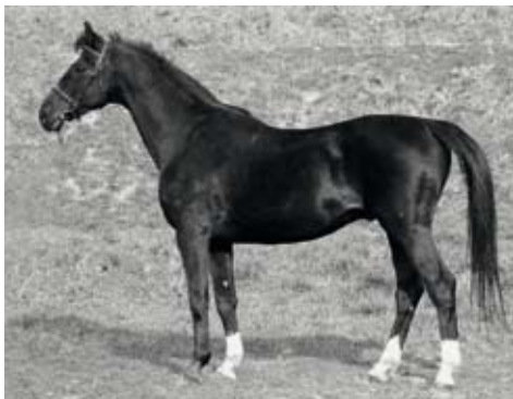
Topas - 23 (Démon), Topas - 647 Ozornice po Almanach

Co se týče plemenů, daří se nám udržet rozmanitost linií i přes relativně malé početní stavy, aby nedocházelo k nežádoucí příbuzenské plemenitbě. Kombinace výborných ruských a německých linií byla vyzkoušena již dávno a nese s sebou pozoruhodné výsledky. Za poslední roky jsme své úsilí napřeli zejména k záchraně linií Quoniam a Aktiv - Pepel. Z toho důvodu byl šampion plemene QUINTAR postaven v sezoně 2018 do Hřebčince v Tlumačově a čerstvým spermatem se podařilo připustit 14