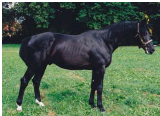
Topas - 14

Mys xx (Flying Star - Astyanax), pot. skok T