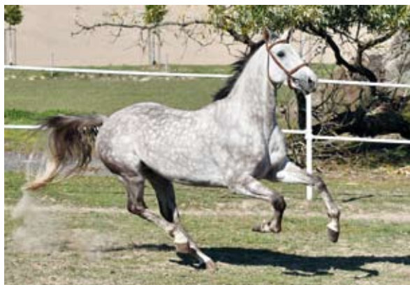
Valach s podílem trakénské krve Crusader-V (Crux - Amona II po Amon)