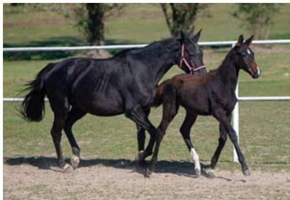
Jednadvacetiletá chovná klisna Charisma (Sargoni - Bura po Quoniam II) s klisničkou Chaira po Quintar