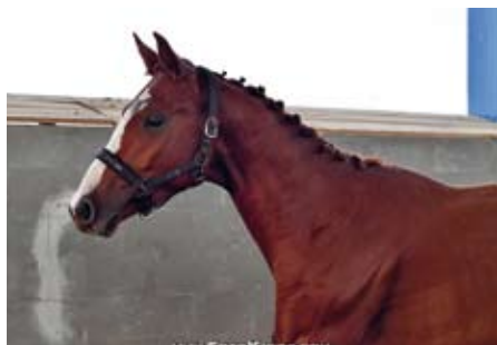
Sargoni Son LH

Ladislav Holada přivedl k výběru i druhého hřebce, ryzáka SARGONI SONA LH (Sargoni-Plazma po Zakon xx). Ten doslova šokoval svou přirozenou kvalitou, za pohyb byl hodnocen známkou 9 a neobyčejné skokové vlohy a technika mu vynesly dokonce 9.8 b ! Mohutný hřebec se silnou kostrou a dostatkem plnokrevné krve získal celkovou známku 9.2 b a je velkým příslibem do budoucna. Jeho skokový a pohybový manýr ho předurčuje k nejvyšším výkonům. V příštím roce bude působit v plemenitbě a zúčastní se i testu. Otec Sargoni dosáhl výkonnosti skok ST již v šesti letech a absolvoval i drezuru st. S. Tento mohutný univerzální talent dal již potomstvo na stupni T v drezuře i ve skoku. Matka Sargoni Sona LH, klisna Plazma je vítězkou drezurního testu 3letých klisen v Rusku a bába Paduja