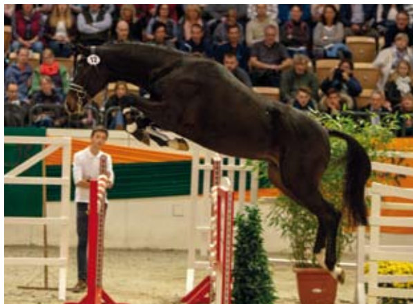
Ibrox Park