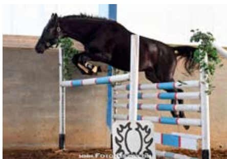
Aktis (Aktiv - Kachetia po Chalif 5)