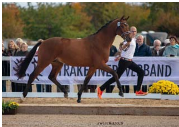
Kattenau, foto Sigrun Wiecha

Kvalitou si s vítězem nezahladal rezervní vítěz INSTAGRAM, černý hnědák po ceněném Schwarzgold (Imperio) z matky po Vivus (Habicht), dále Langata Express xx. Instagram se výborně pohyboval a skvěle skákal. Nový majitel z Taiwanu ho koupil za 160 tisíc euro.