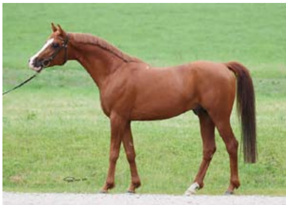
Pagur ox

boj. V původu vyniká zejména jeho syn Pomeranec, otec olympijského hřebce Paketa a hřebce století Chokkeje.