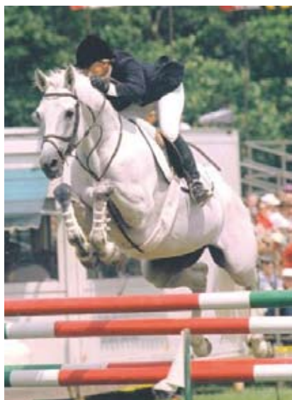
Special Memories, foto archiv SCHČTrak

Celkový počet trakénů v Čechách překročí v příštím roce 200 kusů.