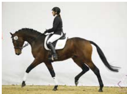
Schralling s Ivetou Červenkovou ve Stadl Paura

V Čechách patří jeho dcera Trischa (Triana po Topas - 23) ke špičce ročníku a velmi nadějný je jeho syn Schampus (Chanelle po Quintet).