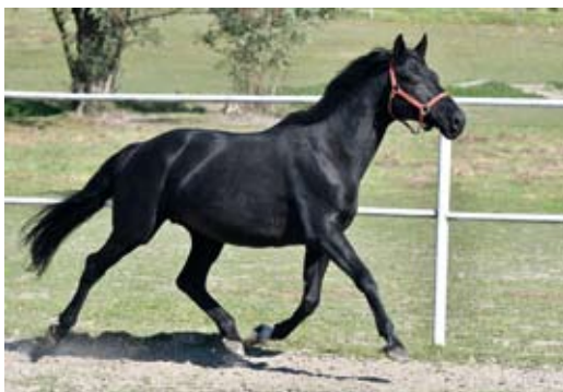
Chovná klisna Grafín (Black Magic Boy - Gottin po Goerlitz), foto Zenon Kiszka

Celá přehlídka se nesla v duchu přátelské atmosféry, na závěr nechybělo malé posezení u občerstvení. Účinkující i diváci byli spokojeni a odjížděli s dobrou náladou. Přijďte se podívat na přehlídku v roce 2019!