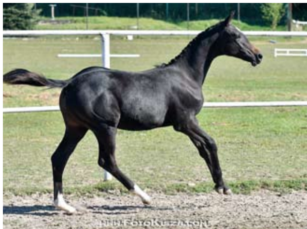
Klisnička Trischa (Schralling - Triana po Topas-23), foto Zenon Kísza