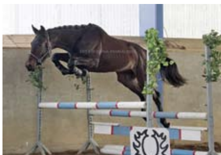
Atraktiv LH, foto Ivana Maršálková