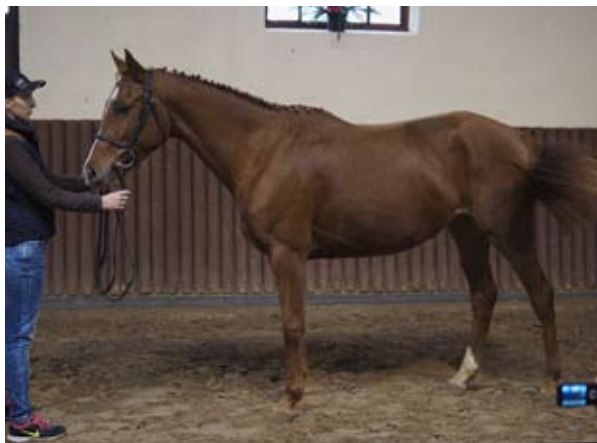
Tříletá Pasjonata (Impuls - Pistacja po Gluosnis xx)

Stadnina koni Sokolnik leží nedaleko Gdaňsku, pár desítek kilometrů od ruských hranic. Oblast královských trakén je charakterizovaná krásným vlnitým terénem, hlubokými lesy, rozsáhlými pastvinami a krásnými vodními plochami. Symbolický je výskyt losů, jejichž paroží je právě tak typickým znakem trakénského chovu. Chov Mirka Kulpinského má dlouhou a úspěšnou tradici a jeho pěkný areál hostil letošty testy klisen a šampionát