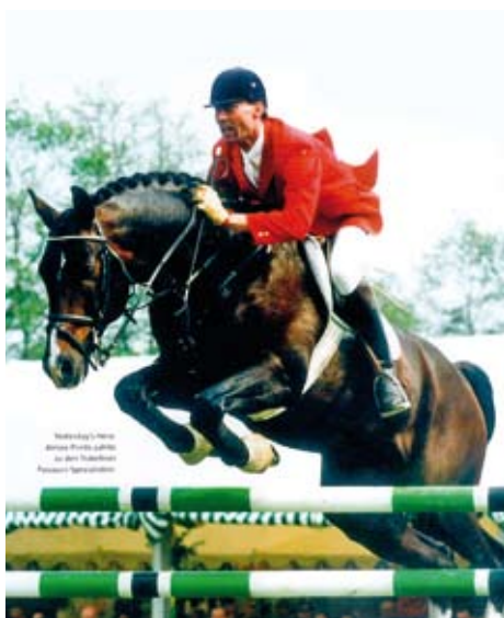
Almoxt Prints, foto archiv SCHČTrak