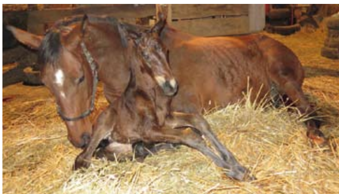
Hřebeček Schampus (Schralling - Chanelle po Quintet), nar. 28. 10. 2018