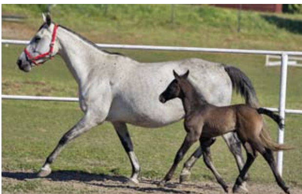
Klisna s podílem trakénské krve, Arcadia (Celer - Askáda po Ermitaž) s klisničkou Robinsonka po Robinson, foto Ivana Maršálková