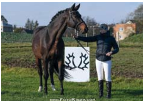
Quintar (Quintet - Stella po Saint Tropez), foto Zenon Kiszka