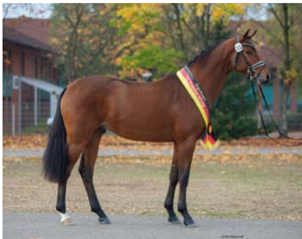
Vítěz výběru Kattenau (Honoré du Soir - Perechlest)

Celkem 43 dvouletých hřebců se ucházelo o výběr. Uspělo 13 z nich, vítězem se stal hnědák KATTENAU (Honoré du Soir – Perechlest). Krásný hřebec s vynikajícím pohybem i skokem je z linie Gribaldi – Kostolany, matčina strana je linie Chokej – Pomeranets ox, dále Stradivari a plnokrevný Vollkorn xx. Z rodiny Kattenaua pochází mnoho špičkových koní a plemeníků ve všech disciplínách (K 2, Kaiser Wilhelm TSF, Kentucky, Karon, Keep Smiling, TSF Karascada M, Key West...). Vydražen za 270 tisíc euro putoval do Rakouska.