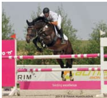
Quintar - MVDr. Vít Holý

Quintarova matka Stella je dcerou premiovaného hřebce Saint Tropez , syna vítěze ně- meckého kórungu Tolstoie . Tolstoi je synem legendy trak. chovu Kostolanyho (děd hřebce století Totilase). Původ na straně matky pak oživují angloarabský Cacir a plnokrevný Bando- liero xx .