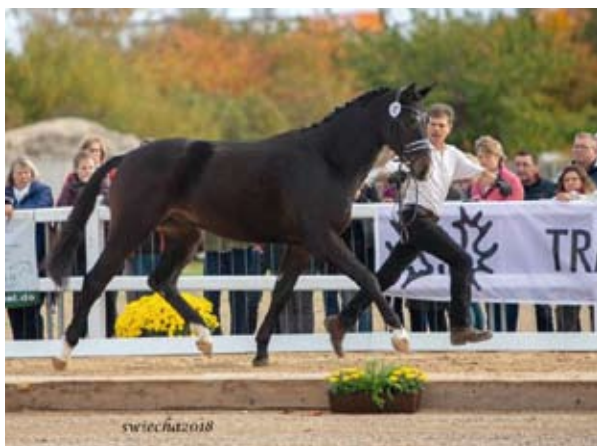
Ibrox Park

Bába IDEE dala military šampiona Iliase (Canada). Z rodiny pocházejí další vynikající plemeničí a sportovní koně jako např: IBIKUS (plemeník, GP drez.), ITAXERXES (plemeník, GP drez.), INFANT (GP skok), INTERMEZZO (GP skok), INDIGO (GP drez.), INTIMUS (GP drez.) INGWER (GP drez.) a další.