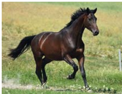
Aktien, foto Zenon Kisza

Matka SCHLÖDIEN II patří k nejlepším chovným klisnám Německa, když dodnes dala 5 (!) plemeníků a T skokana (Schenkendorf po Topkij). V Čechách jsme již viděli jejího syna Skandau (EH Singolo), licentovaného v sezoně 2016. Otcem Schlödien II je ceněný plnokrevný Königspark xx. Klisna patří k velmi ceněné rodině Schwalbe, která dala i otce u nás známého vynikajícího skokana Topase. Königspark xx dal GP koně a plemeníky Herzruf (vítěz testu hřebců, Hřebec roku 2004 a otec špičkového drezuristy Ully Salzgeber Herzrufs Erbe), dále Kilian, Donaukönig, Permessio. Herzruf dal další špičkové koně v drezuře (Payano) a military Haysome, Hayvaras, Heart's Desire)